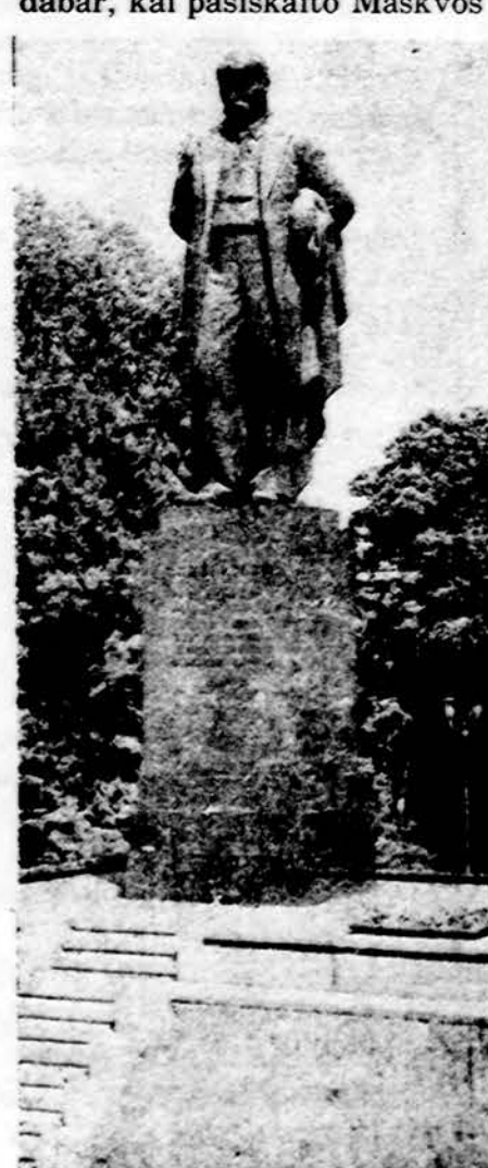
Kijeve, Ukrainos sostinėje, 1939 m. pastatytas ukrainiečių tautinio poeto Taras Ševčenko paminklas. Jo paminklai yra pastatyti dar Washingtono, Paryžiaus, Romos, Buenos Aires ir net Maskvos miestuose.

Saulė teka 6:06, leidžiiasi 5:55. Temperatūra dieną 52 l., naktį 38 l.