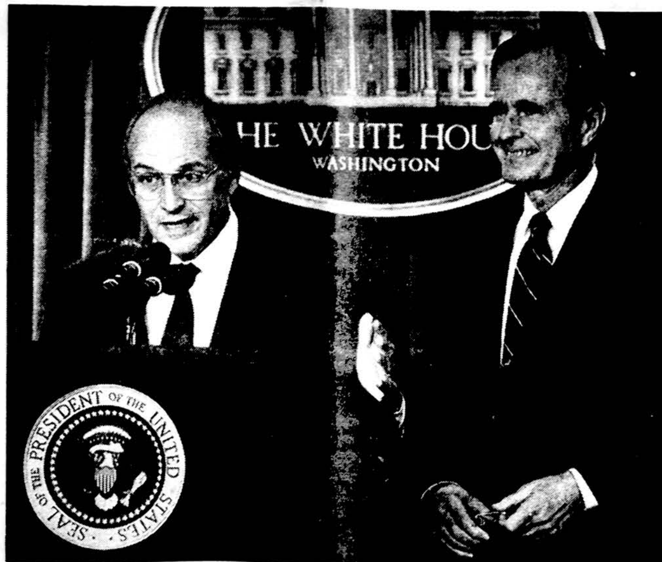
Prez. G. Bushas pristato spaudai kongresmaną Dick Cheney, kurį nominavo Gynybos departamentui sekretoriaus pareigoms