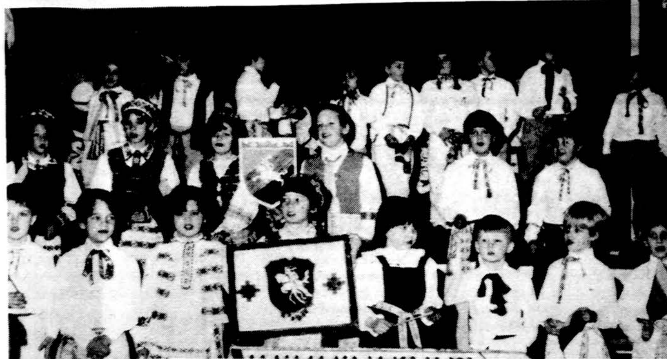
Lemonto Maironio lietuvininkų mokyklos moksleiviai atlieka meninės programos dalį, minint Vasario 16-tosios šventę.