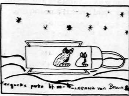
Mano katytės Piešė Larana von Braun Marquette Parko lit. m-las 8 sk. mokinė

[steigtas Lietuvių Mokytojų Sąjungos Chicago skyriaus