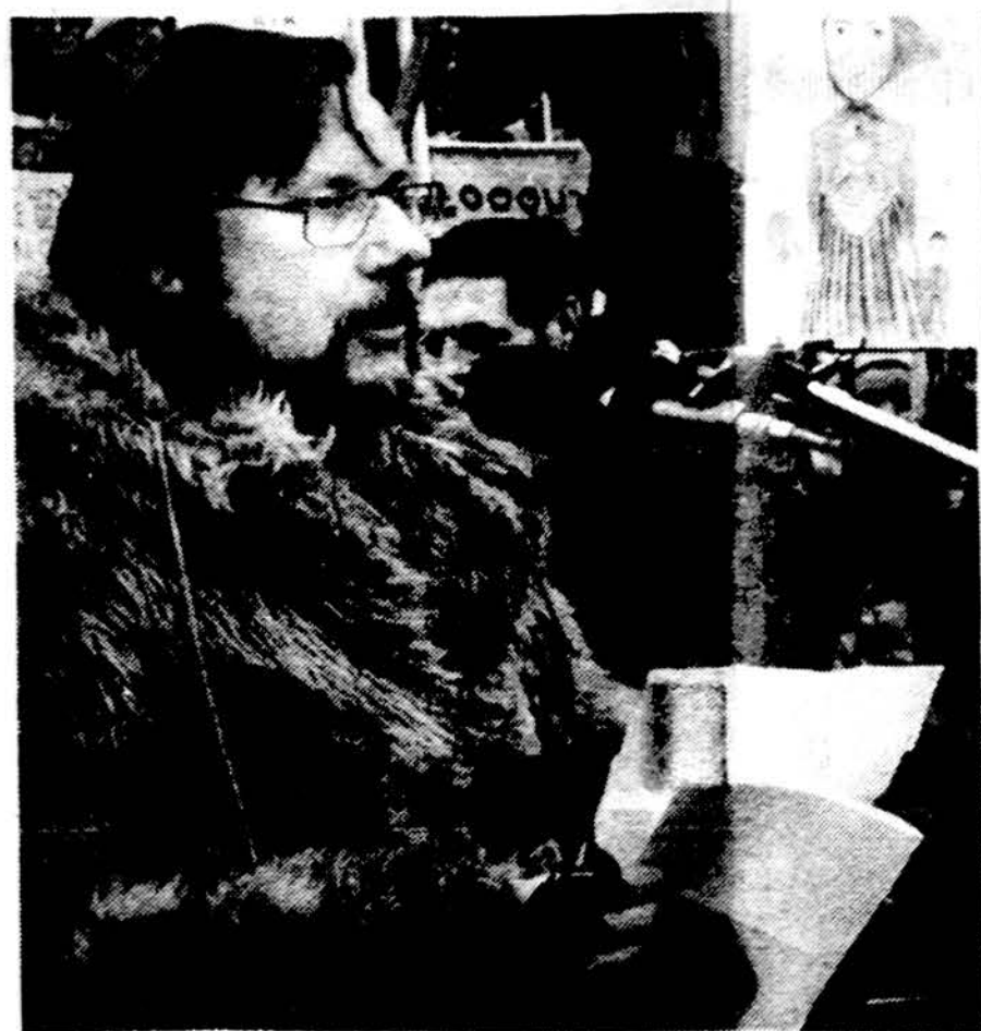
Vytautas Landsbergis, Sąjūdžio prezidentas, kalba rinkimų masiniame susirinkime Kalnų parke Vilniuje.

– Nikaragvos sandinistų vyriausybė pažadėjo aprūpinti žeme tuos karius, kurie grįš iš Honduro ir Nikaragvą.