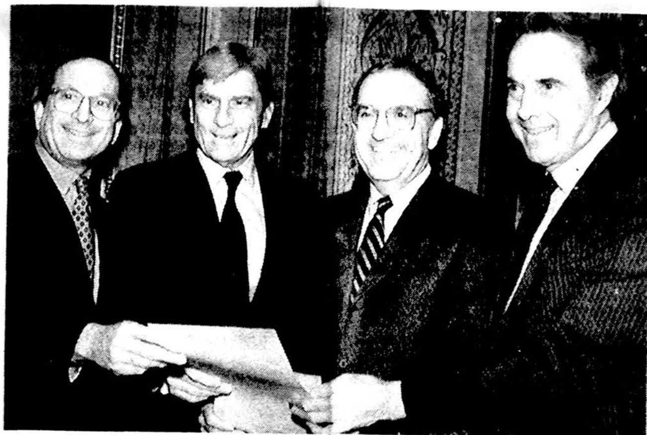
Po to, kai buvo vienbalsiai patvirtintas kongresmenas Dick Cheney Gynybos sekretoriumi, džiaugiasi senatoriai — iš kairės Sam Nunn, John Warner, George Mitchell ir Bob Dole.