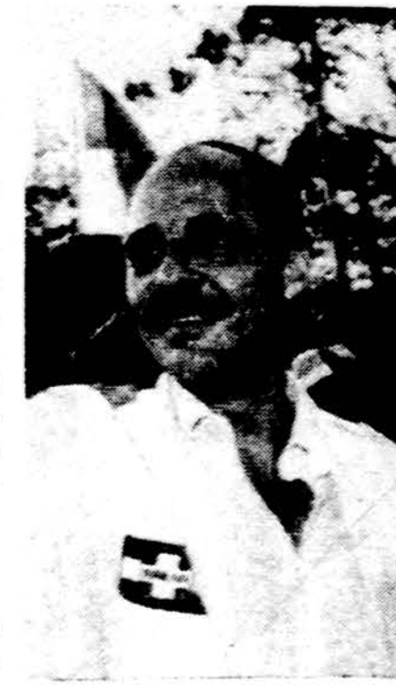
Naujai išrinktasis El Salvadore prezidentas Alfredo Cristiani.