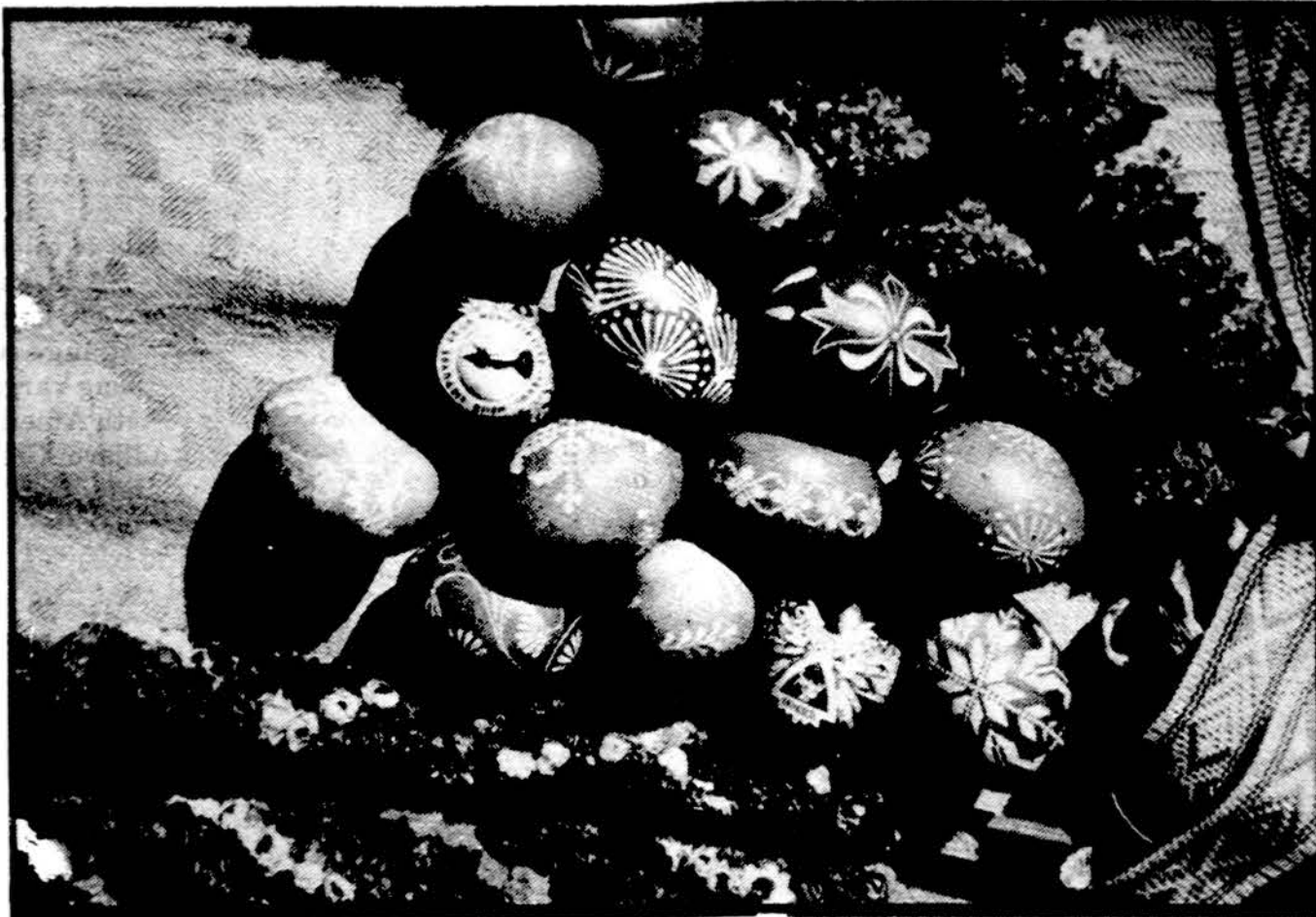
Margučiai — velykaičiai.

„Aušros Vartų“ skaučių tuntas „Kernavės“ skaučių tuntas „Nerijos“ jūrų skaučių tuntas „Lituanicos“ skaučių tuntas Chicago skautininkų-ųjų Ramovė Chicago skautininkų draugovė