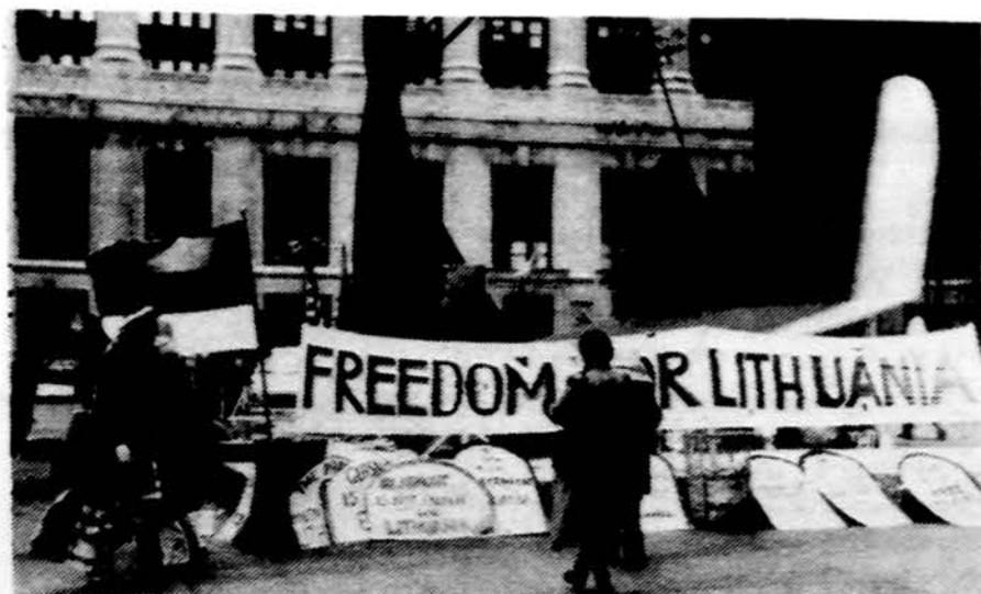
Lietuviai dalyviai demonstracijoje – budėjime Vasario 16 Chicago miesto centre.