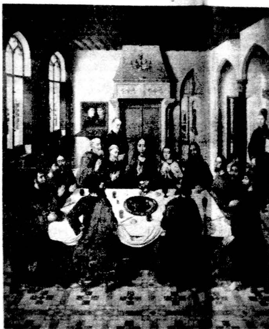
Dirc Bouts kūrinyje Briuselio muziejuje: Paskutinė vakariene – Švenčiausiojo Sakramento įsteigimas.

– Maskvoje leidžiamas savaitraštis „Ogonyok“ paprašė Komunistų partijos Centro komitetą leisti savarankiškai spausdinti tokią medžiagą, kokia redakcijai atrodo reikalinga. Redaktorius Vitaly Korotich pasakė, pažiūrėsim, kas bus, bet bandyti reikia, kad nebebūtų kontrolės.