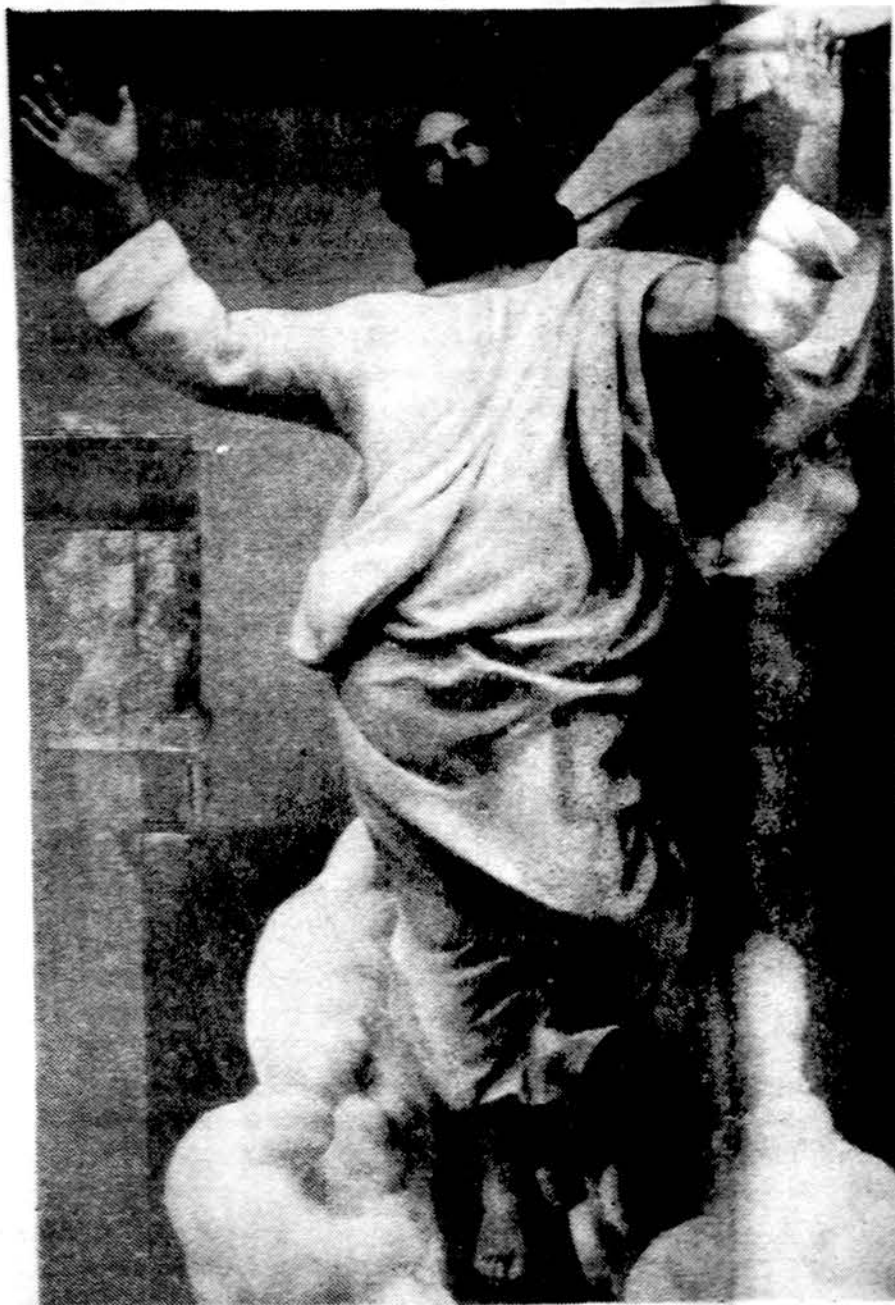
Popiežius Clementas VII 1517 metais užsakė Kristaus prisikėlimo tema kūrinių Renesanso genijui Rafaeliui, kurio originalas saugojamas Vatikane.

Tipitapa. – Nikaragvos sandinistų vyriausybė oficialiai amnestavo 1,894 buvusius Samozės laukų kareivius, kurie buvo suimti, kai marksistai užgrobė valdžią prieš 10 metų. Vyriausybės pranešimu, tebekalinami 39 asmenys, kurie esą kalti „už žiaurios nusikaltimus“, ir kurie nebendradarbiavo kalėjimuose. Visi kaliniai buvo išrikiuoti jau aprengtais Raudonojo Kryžiaus padovanotais rūbais, bet dar su grandinėmis. Jie visi tyliai išklausė, beveik suklaupę, vyriausybės atstovą skaitant amnestijos dekretą. Dalyvavo ir sandinistų prez. Danel Ortega kartu su Vidaus reikalų min. Tomas Borge. Kalinių giminių buvo apie 3,500, kurie entuziastiškai plojo. Kad jie būtų amnestuoti, daug pastangų padėjo Amerikų organizacija, Raudonasis Kryžius, o ypač Nikaragvos Katalikų Bažnyčia.