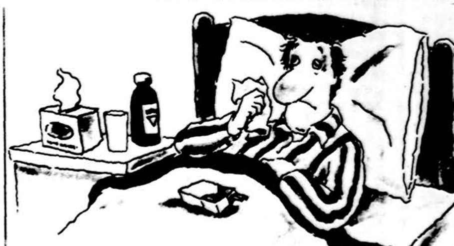
Lengviausia mesti rūkčius sloguojant. Tada rūkymas yra nepatrauklus. Rūkant žaizda skrandyje bei dvylikapirštėje žarnoje negyja.