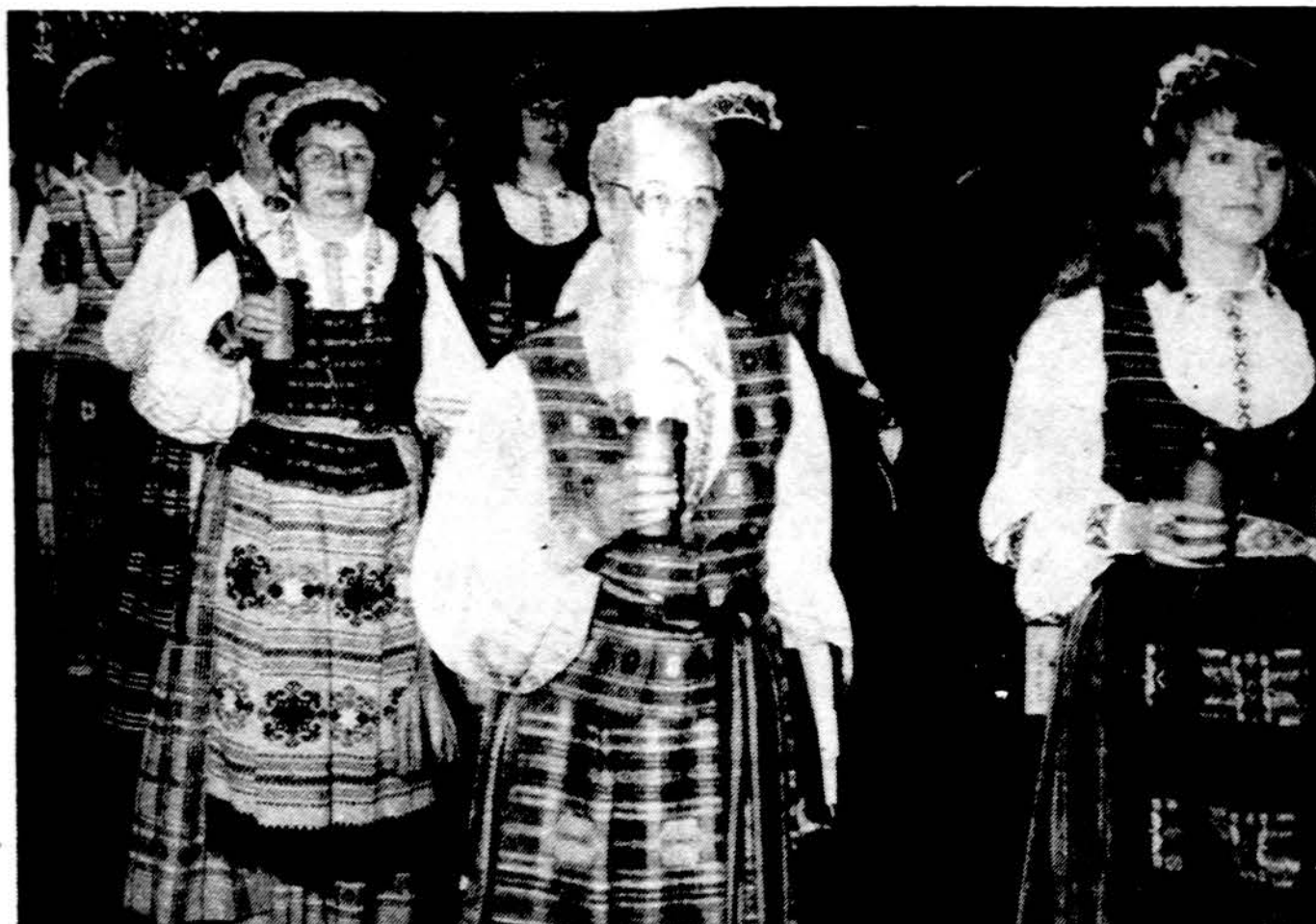
Dainavos ansambliu specialia eiseną eina į Nekalto Prasidėjimo parapijos bažnyčią religiniam koncertui.

x Darome nuotraukas pasams ir kitiems dokumentams, kurias galima tuojau atsimiti. American Travel Service Bureau, 9727 S. Western Ave., Chicago, Ill. 60643. Tel. 238-9787. (sk)