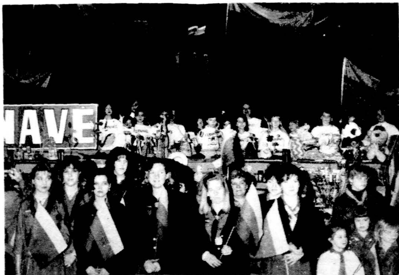
Gedimino pilies papėdėje „Kernavės“ tunto sesės dainuoja Atgimimo Sajūdžio dainą.