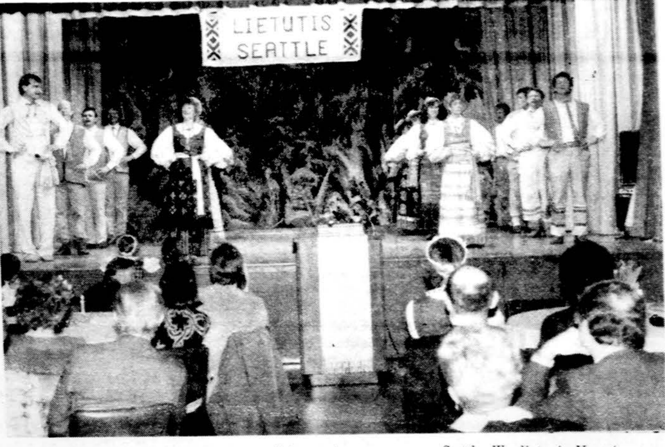
„Lietučių“ tautinių šokių grupė atlieka meninę programą per Seattle, Wa, lietuvių Vasario 16-tosios minėjimą.