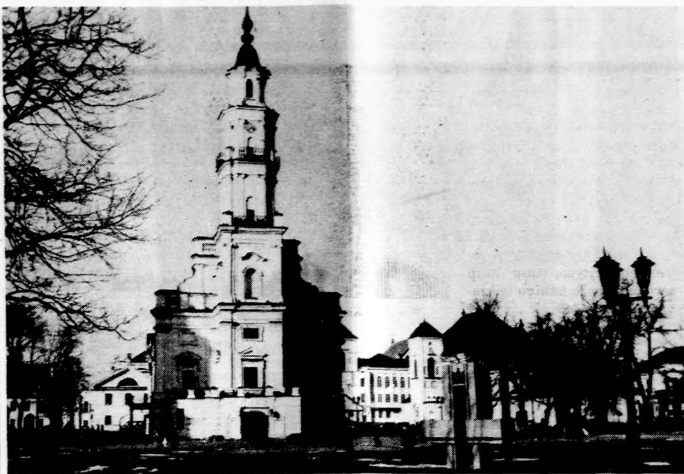
Kauno rotušė — atnaujinta ir padaryta vedybų metrikacijos įstaiga.