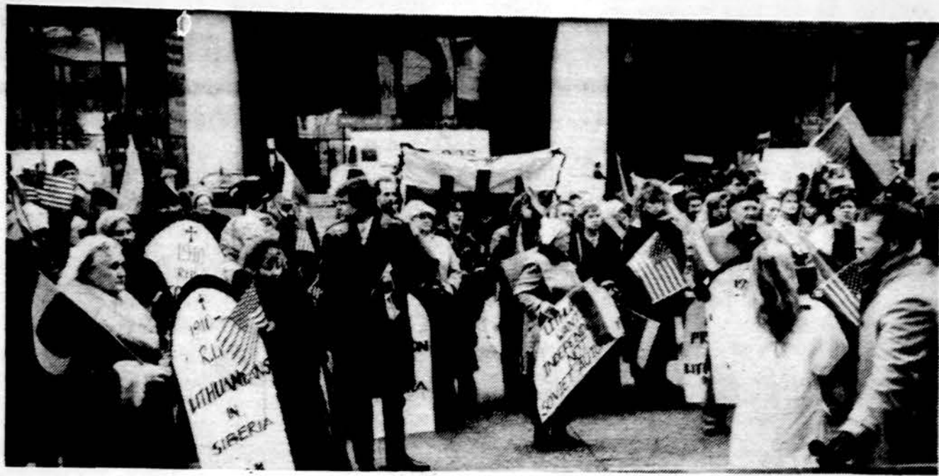
Visi šaukia „laisvė“ Chicagos miesto centro būdėjime.