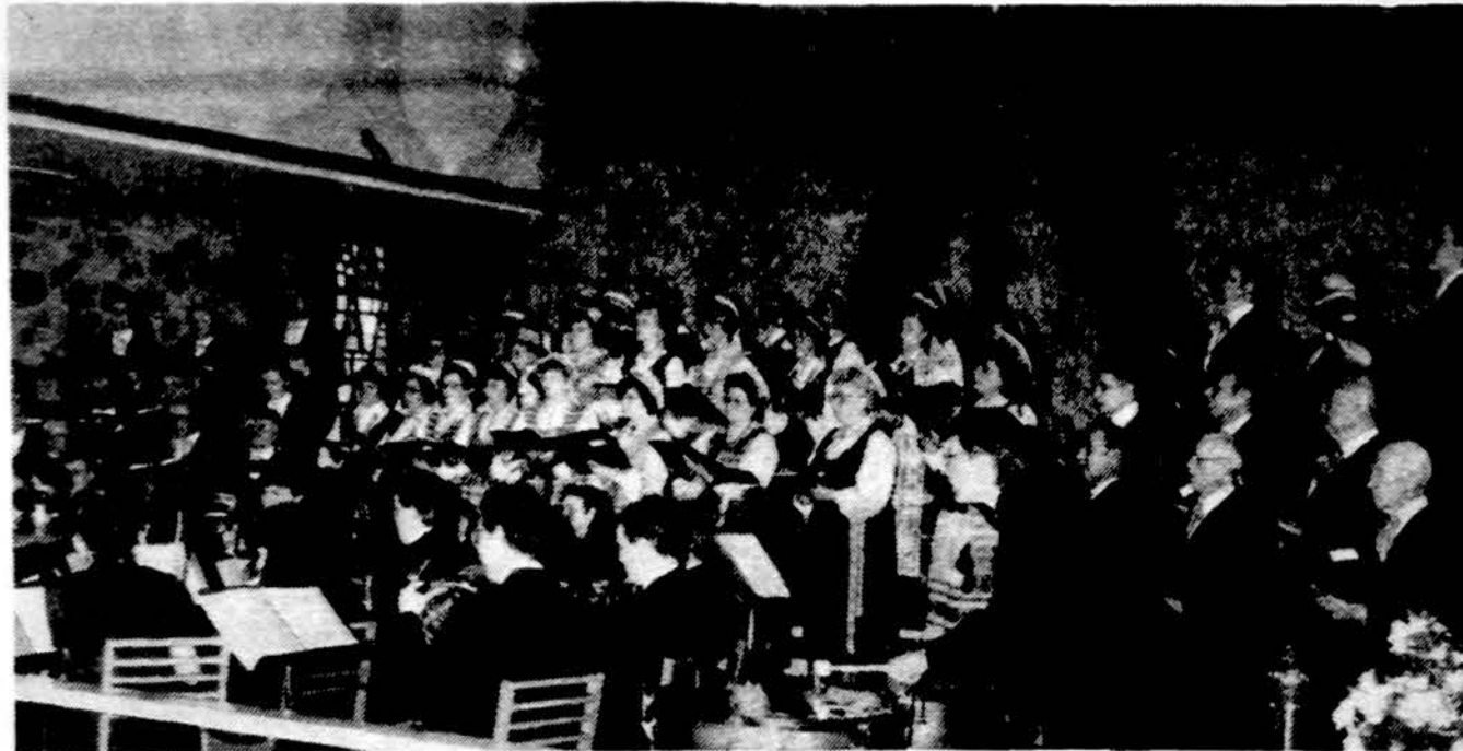
Vaidas iš Dainavos religinio koncerto atlikimo Nekalto Prasidėjimo bažnyčioje Brighton Parke.