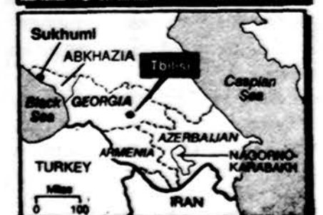
Respublikos, kurios iš Sovietų Sąjunos reikalauja suvereniteto.

ma, kai tuo pačiu metu tankai patruliuoja sostinės gatvėse. Gruzinų žiniomis, sovietai suėmė 464 žmones, dalį vėliau paleido. Šiuo metu padėtis apimstanti. „Pravda“ sako, kad turi būti apsaugotos kons-titucinės žmonių teisės prieš įstatymų laužytjus. Tbilise tačiau skelbiama, kad žuvusių esama daugiau negu 150 asme-nų. Žmonėms draudžiama pasi-rodyti gatvėse nuo 11 val. vak. iki 6 val. ryto.