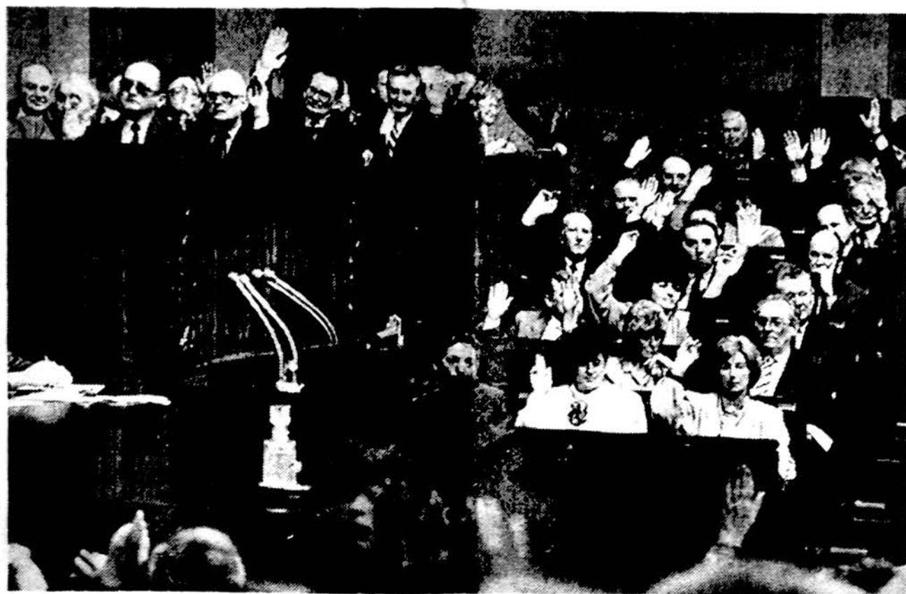
Lenkijos komunistų parlamentas priima šešis naujus įstatymus, kurie buvo aptarti tarp Solidarumo ir vyriausybės delegatų. Solidarumas dabar jau laisvai veikia lenkų organizacija. Skelbiami nauji demokratiški rinkimai birželio mėnesį. Čia matomi parlamento nariai iki šiol būdavo tik „mechaniški rankų kelejai“, nes viskas būdavo iš anksto nutariama Politbiure. Viršuj, su tamsiais akiniais, matyti Lenkijos komunistų viršininkas gen. Wojciech Jaruzelski.

— Kinija pirmą kartą išleis Taikos korpuso savonius šią vasarą į Kiniją, kurie mokins kinus anglų kalbos.