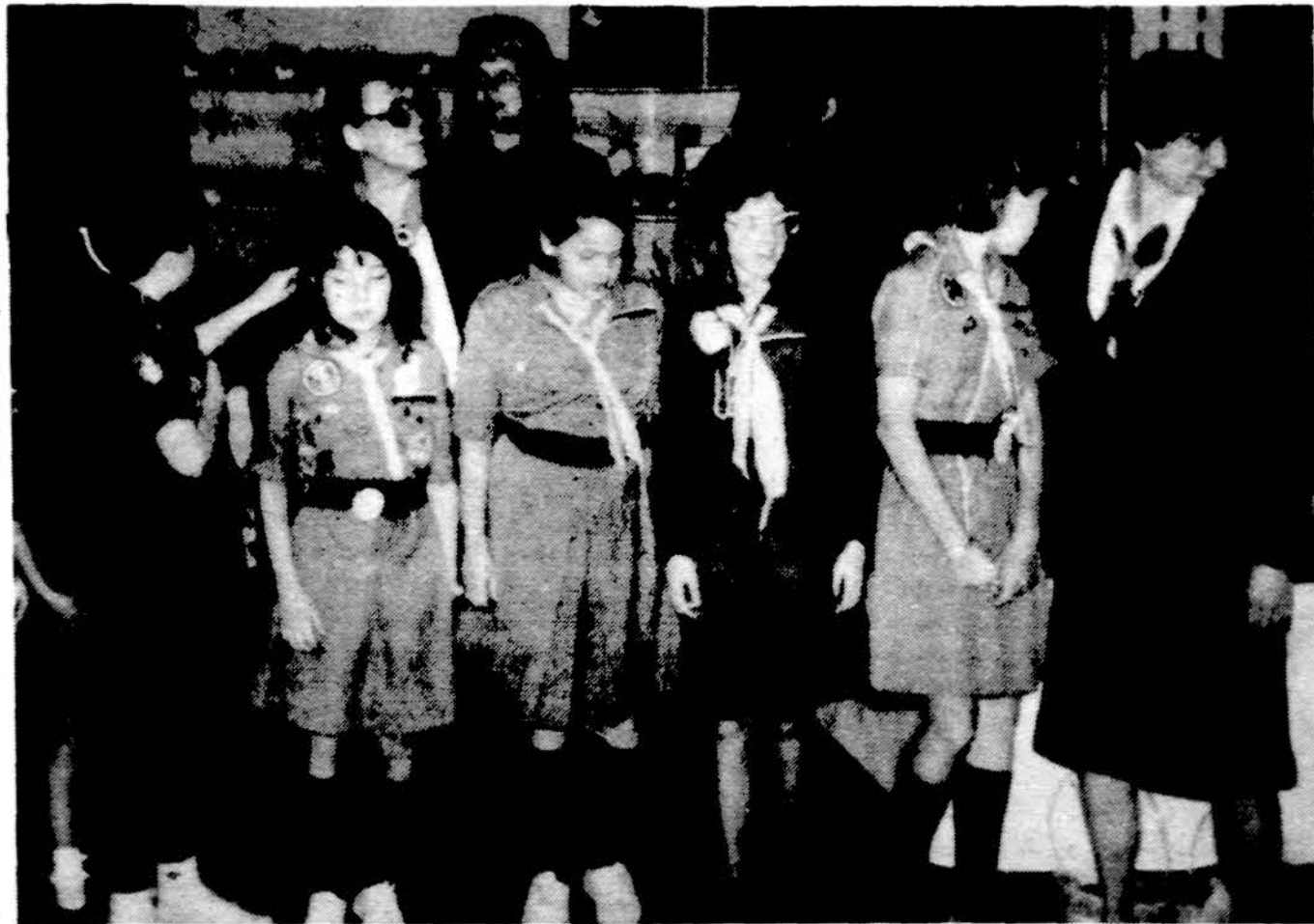
Skautės rikiuojasi Kaziuko mugėi Detroito.

Chicagoje, Hyatt Regency viešbuty balandžio 8 ir 9 dienomis įvyko monetų paroda, kur iš įvairių kraštų dalyvavo per 100 kolekcionierių. Buvo daug aukso, sidabro, net ir plastikiniai pinigai iš įvairiausių kraštų. Vienas auksinis Ispanijos pinigas buvo įvertintas 50,000 dol.