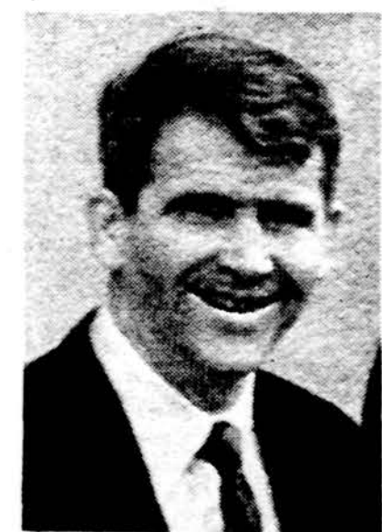
Marinų pulk. Oliver North po teismo sesijos vakar Washingtono.

Pulkininkas prisiėkusiems pasakė, jog jis buvo paskirtas padėti Contrams po Kongreso atsisakymo duoti pinigų ginklams ir po uždraudimo CIA ir kitoms Amerikos agentūroms jiems padėti. Jam niekada nebuvo pasakyta Reagano ir Saugumo tarybos narių, kurių įsakymus jis vykdė, kad Bolan-do papildomas įsakymas draudžia ir prezidento Saugumo tarybai tai daryti. Ir North manė, kad tai, ką jis daro, yra įstatyminiai pilnoje tvarkoje. Reaganas asmeniškai prašęs Saudi Arabijos karalių skirti Contrams 32 mil. dol., bet apie tai jam būvę uždrausta kalbėti, pasakė North savo teisme. Teisėjas Gesell pasakė, kad North turi teisę savo apsigyn-imui naudoti šią medžiagą. Reaganas asmeniškai patvirtinęs visą tą planą ir raštu pra-šęs Honduro prezidentą padėti Contrams.