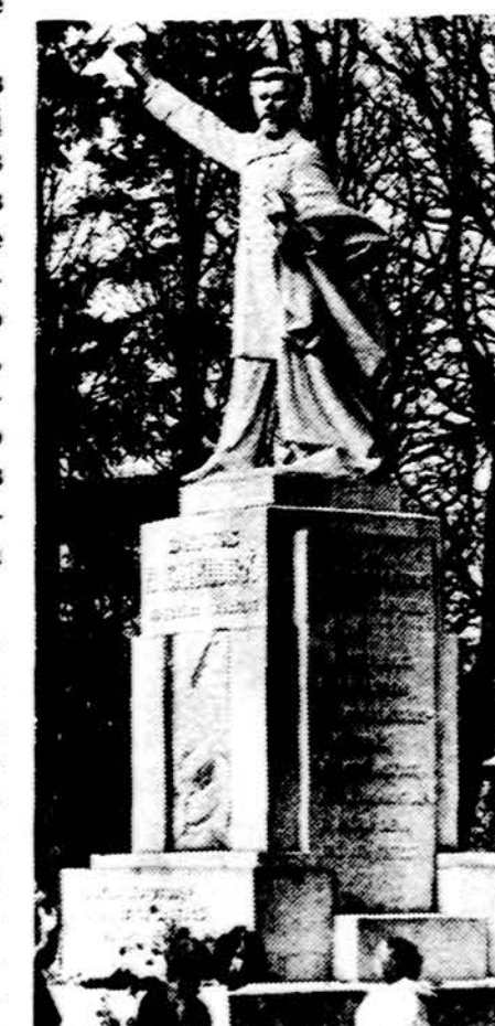
Lietuvoje kas savaitgalį dedamos gėlės prie Vinco Kudirkos paminklo Kudirkos Naumiesčio aikštėje.