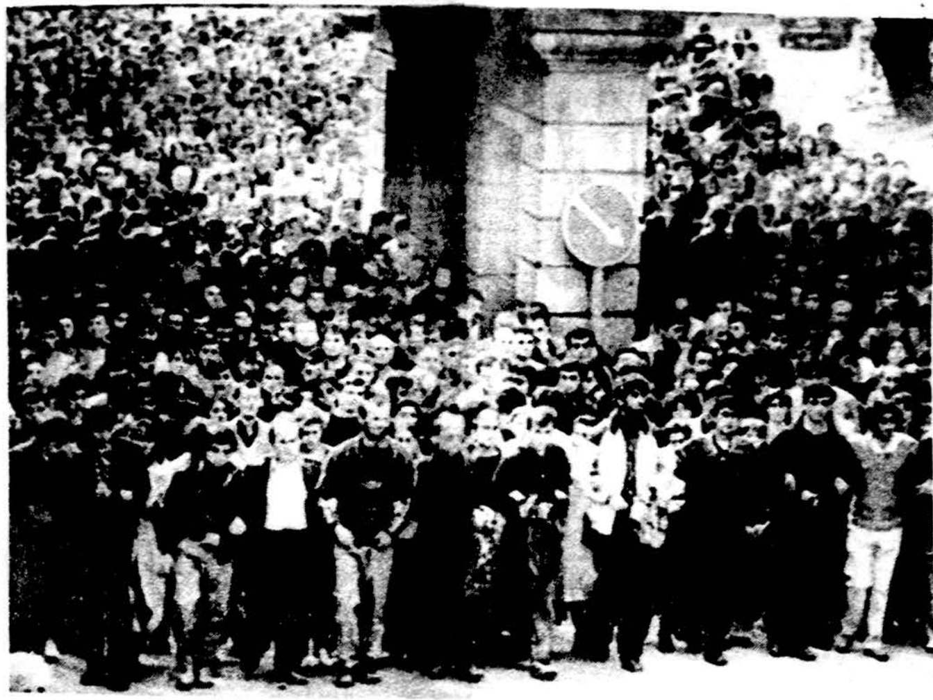
Gruzinai laidoja savo žuvusiuosius praėjusios savaitės susirėmimuose su sovietų kariuomenės daliniais. Žinių agentūros praneša, kad trūksta dar 14 žmonių, kurių nesuranda šeimos ir gimines Tbiliso mieste.