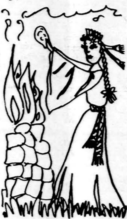
Piešė Lina Sidrytė