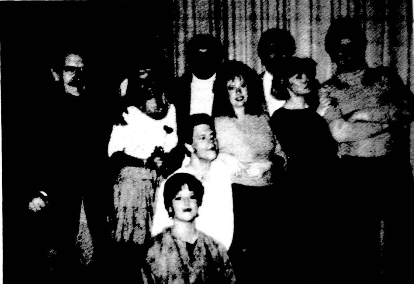
Gerai nusiteikę „Antro kaimo“ aktoriai po sėkmingo pasirodymo Detroito lietuviams.

Specialybė – Vidaus ligų gydytojas Kalbame lietuviškai 6165 S. Archer Ave. (prie Austin) Valandos pagal susitarimą Tel. 585-7755