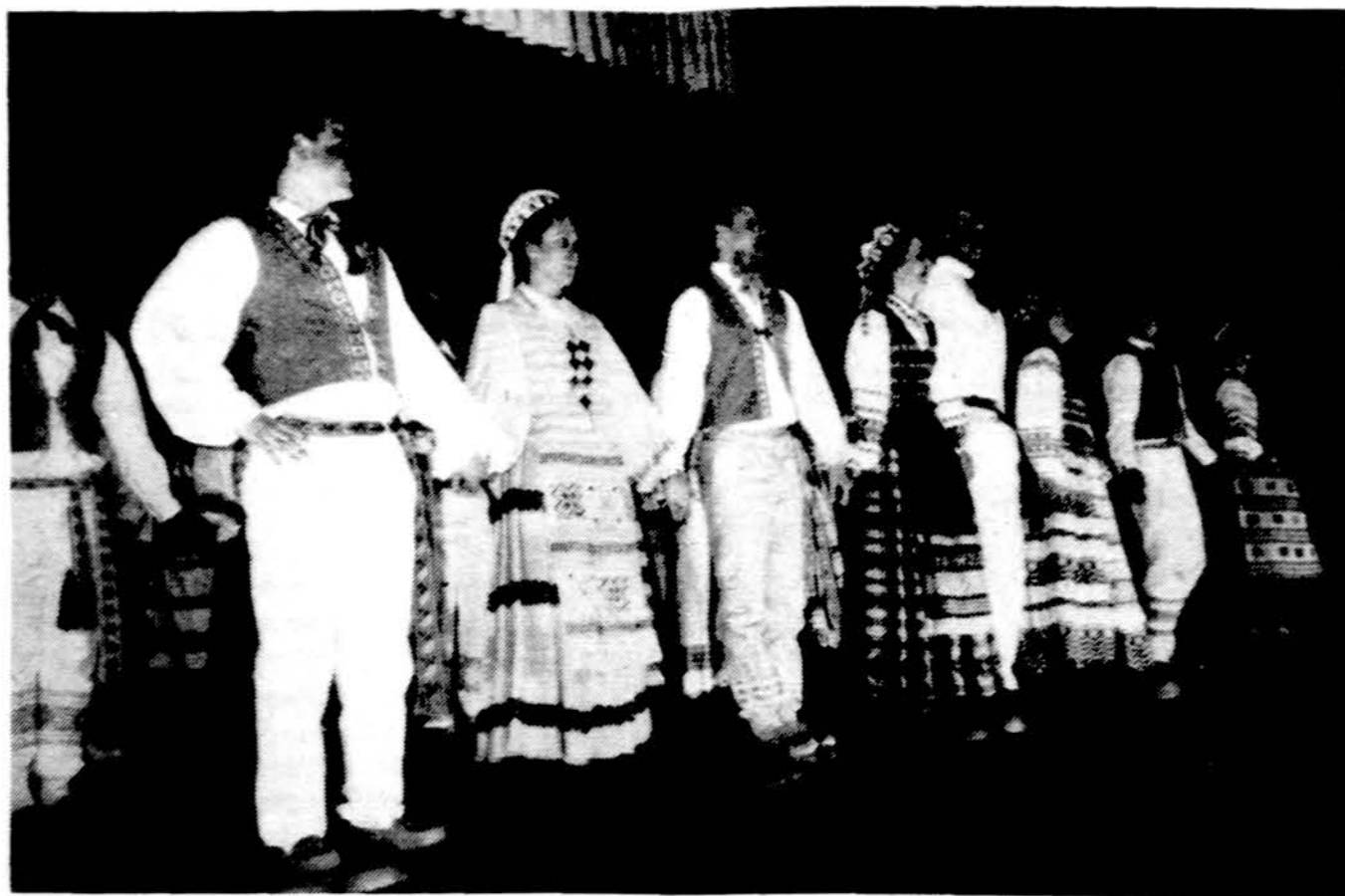
Detroito „Audiinio“ šokėjai radijo klubo „Lietuviškas balsas“ renginio programoje š.m. balandžio 2 d.

Paskaitininkė, kalbėdama apie Tautos Fondo veiklą, pažymėjo, kad Tautos fondo izdas įgalina Vliką vykdyti Lietuvos laisvinimo veiklą. Ankstyvesnioji iševija per Tautos fondą surinkusi 700,000 dol. Lietuvai stiprinti. Vokietijoje, 1944 m. Tautos fondas atgimęs Vliko