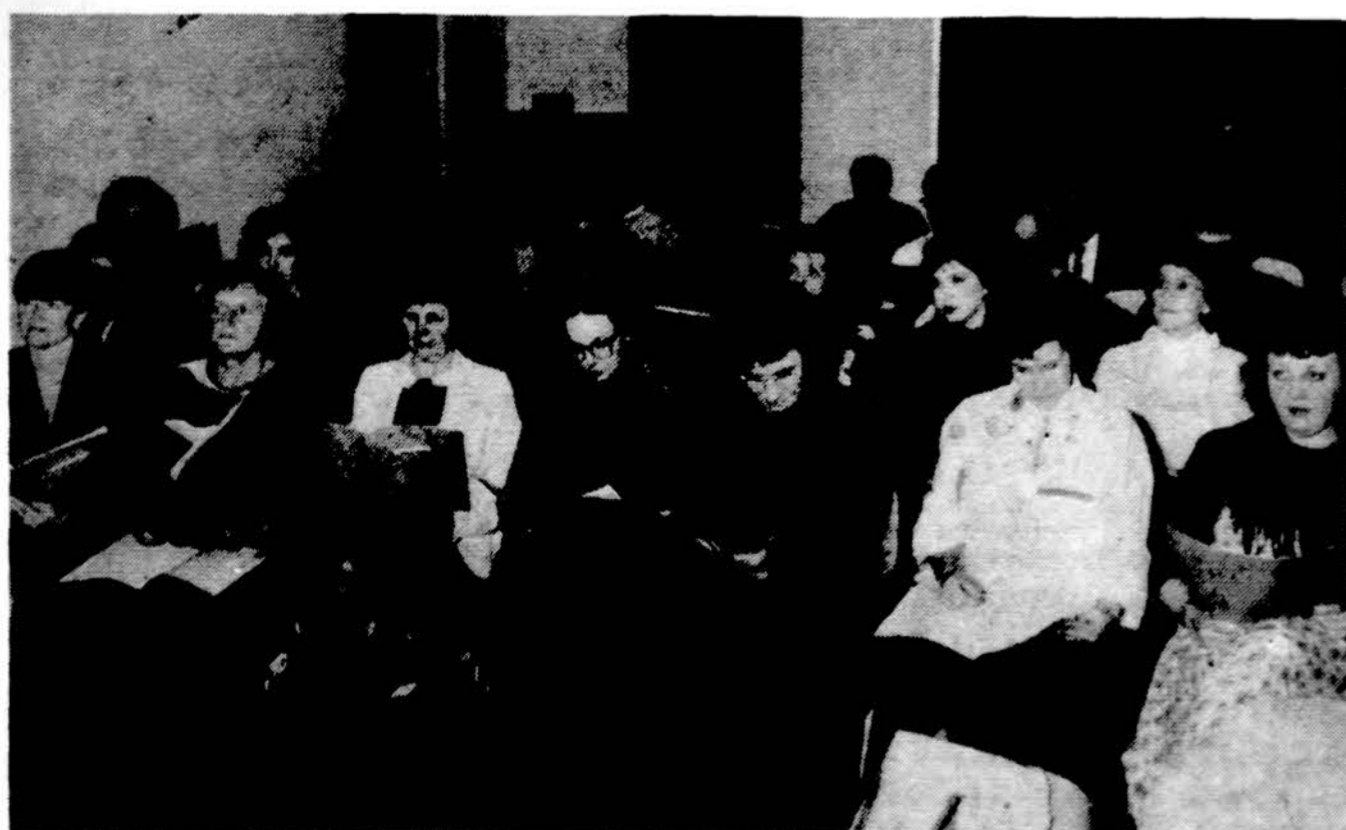
Lietuvių Operos dalis repetičių metu...