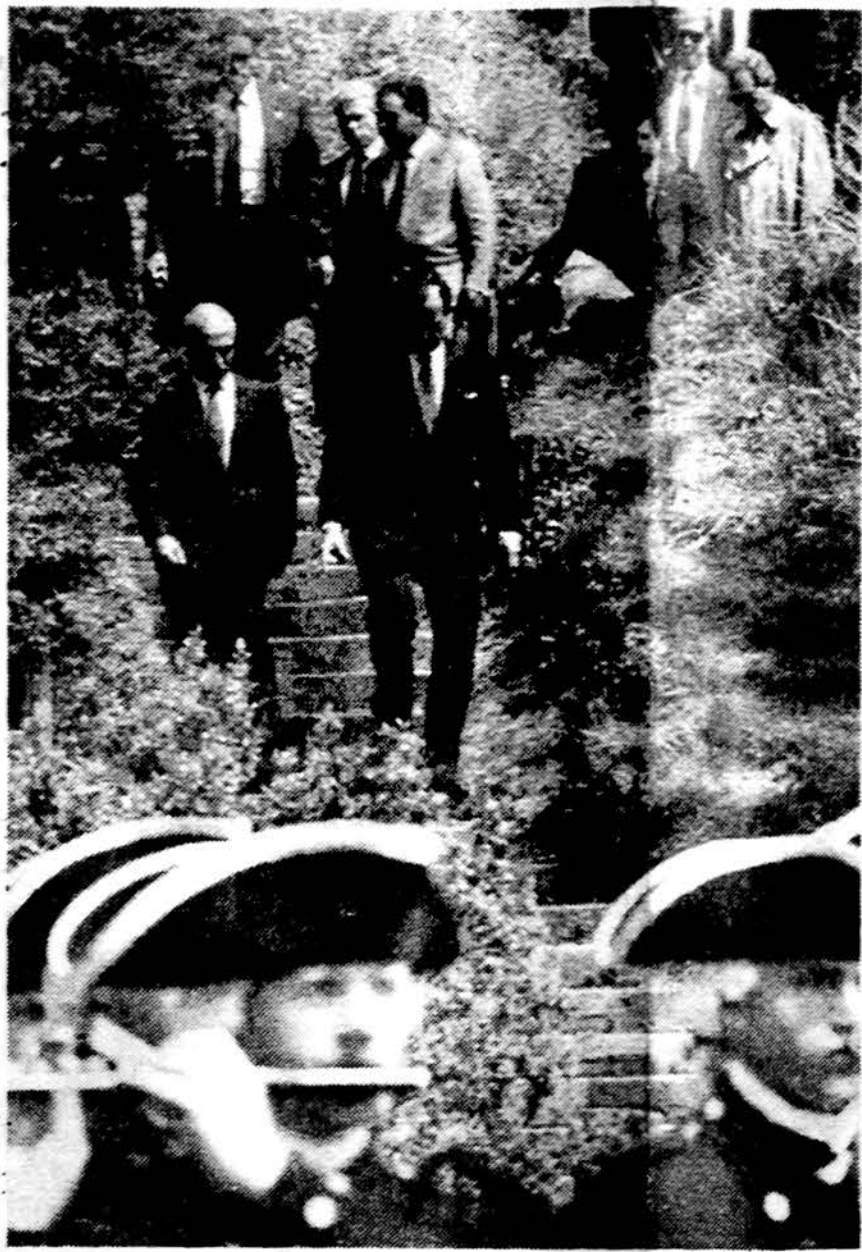
Prez. Bushas lydi savo svečią Jordano karalių Husseina, aprodydamas pirmojo Amerikos prezidento Jurgio Washingtono dvarą Mt. Vernon apylinkėje, netoli Potomac upės.