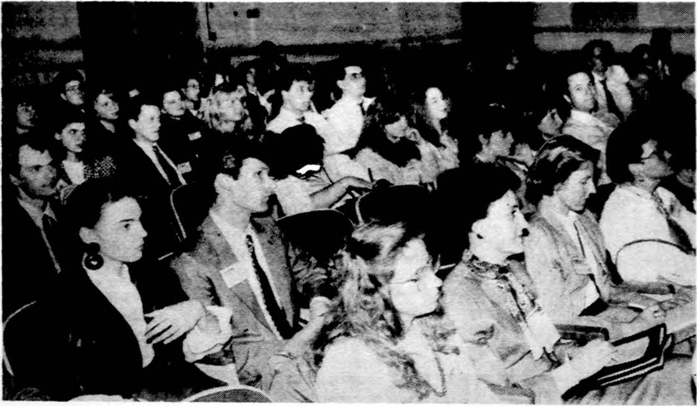
Suvažiavę jaunimas į JAV LJS politinį seminarą Washingtono balandžio 14 d. klausosi paskaitos Valstybės departamente.