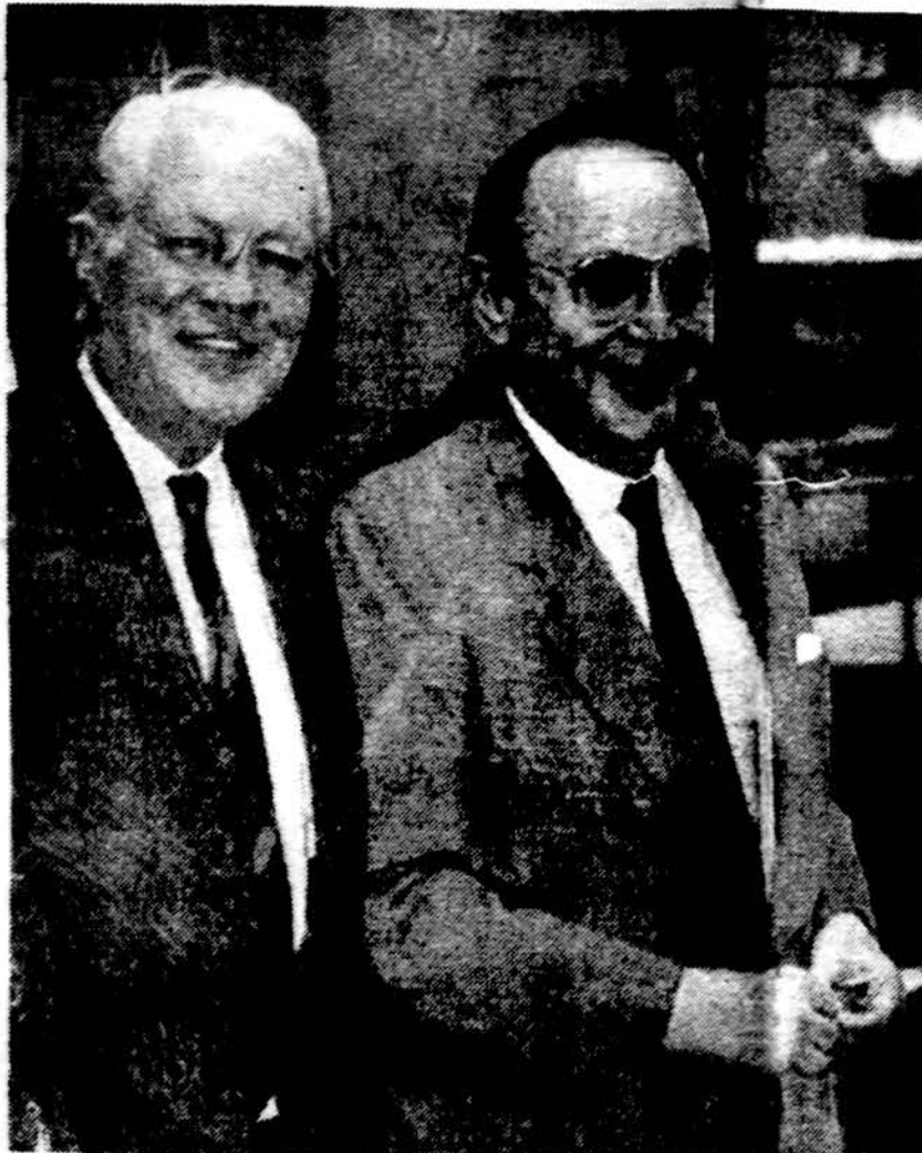
Vakarų Vokietijos ministrai – Gynybės Gerhard Stoltenberg, kairėje, ir Užsienio Hans-Dietrich Genscher, dešinėje, po pasitarimų Valstybės departamente su sek. James Baker III. Valstybės departamentas praneša, kad šiuo metu pradėti derybos su Sovietų Sąjunga trumpųjų nuotolių raketų klausimu, būtų didelė klaida.