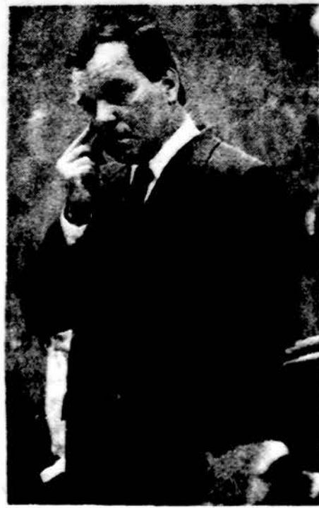
Naujasis Chicago miesto meras Richard M. Daley kalbasi su žurnalistais baigęs savo pirmąjį darbo dieną City Hall įstaigoje.

NATO kraštai jau kurį laiką pastebėjo kanclerio „balandį“ paskutiniu metu nusistatymą kariniuose reikaluose. Europoje kyla susirūpinimas, bet kartu ir pritarimas šiai politikai. Šią ministerių kelionę pats kancleris suorganizavo, telefonu pasikalbėjęs su prez. Bushu. Bonoje po to įvyko visą naktį trukęs vyriausybės su koalicionių grupių vadais pasita-