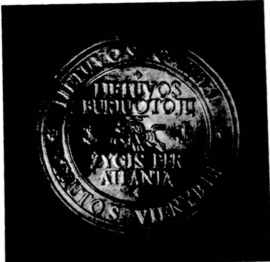
Lietuvos buriuotojų žygio per Atlantą komemoratyvinis medalis, nukaltas ok. Lietuvoje.