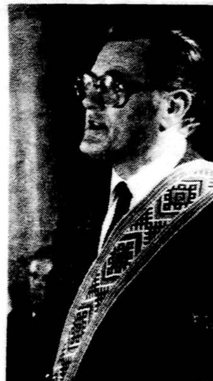
Dr. Valdas Adamkus taria padėkos žodį Vilniaus universitete, priimdamas garbės daktaro laipsnį.