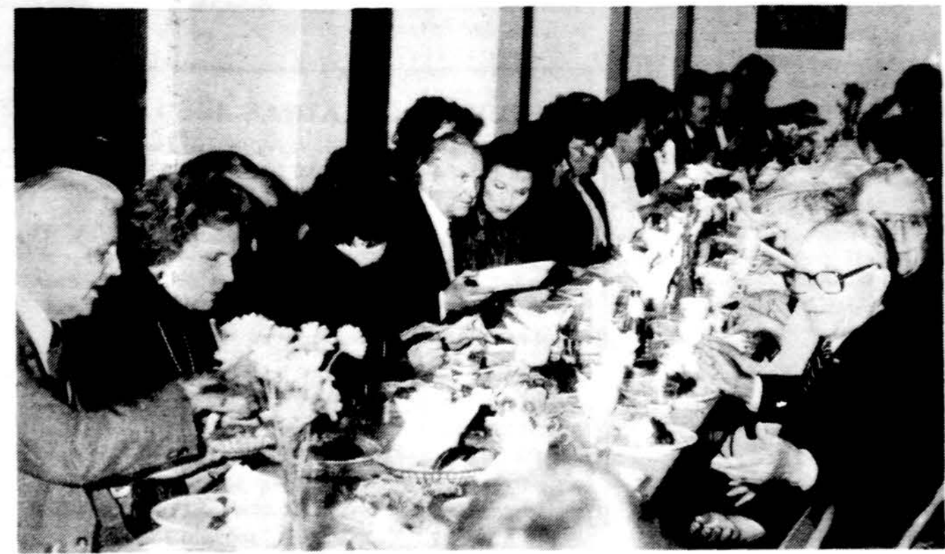
„Draugo“ 80 metų gyvavimo sukakties proga priėmimo Jaunimo centre vienas iš stalų.

Sugrįžimui į Lietuvą atskris nauja pamaina igulų ir prie jų prisijungs ir JAV buriuotojų ir jūros keliais vėl pasieks Klaipėdą. Nuostabiai gražiai sutikome Vilniaus universiteto studentų folklorinį ansamblį Ratilio. Jis su koncertais aplankė didžiulias lietuvių kolonijas. Visur sutikome nuosirdžiai ir sveitintai globuojame. Nemažiau turėtume rūpintis ir trijų burlaivių igula. Ir šiems drąsuoliams užtikrinkime sveitumą ir šaunią viešnagę, nes jie to verti. Buriuotojams sėkmingai išskleisti bures ir gero vėjo!