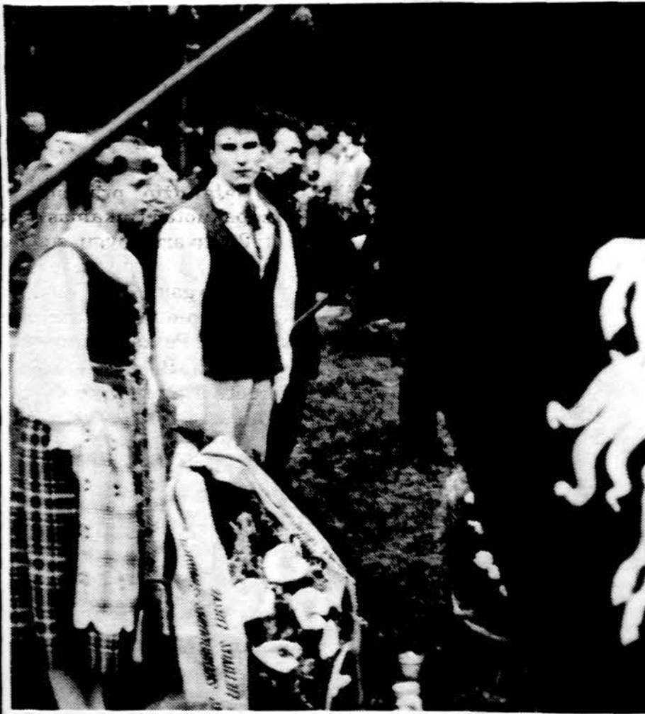
Garbės sargyba Kauno Šančių kapinėse prie žuvusių už Laisvę kapų.

Palaim. J. Matulaitis mėgino lietuvius — broliukus įtikinti, kad jie paliktų prie savo vienuolyno, tačiau, be sėkmės. Jie nori įstoti į tokį vienuolyną, kur tautiniai reikalai sprendžiami teisingai. Vysk. J. Matulaitį aplankė du broliukai, tačiau jų esama daugiau. Toliau palaim. rašo, kad lietuviams susilaukė sunkumų ir dvasiniuose reikaluose, nes kai kurie vienuoliai visiškai nemoka lenkų kalbos. O ji plačiai naudojama vienuolyne. Į Rygą at-