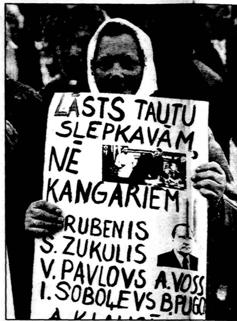
Rygoje demonstracijų metu latviai pasmerkia stalinistų partijos vadus. Latviškai užrašytame plakate matome šį įrašą – Prakeikimas tautos žudikams ir išdavikams.