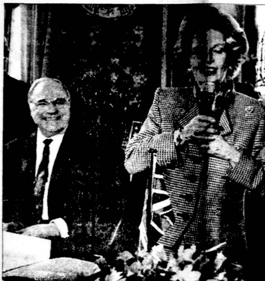
Nežiūrint nuomonių išsiskyrimo, Vakarų Vokietijos kancleris Helmut Kohl klausosi Britanijos premjerės Margaret Thatcher kalbos, kai ji sekmadienį atvyko įspėti kanclerį trumpųjų distancijų branduolinių raketų reikalu į Vokietiją. Po pasitarimų kancleris pasakė, kad nesutarimų nepavyko išlyginti.