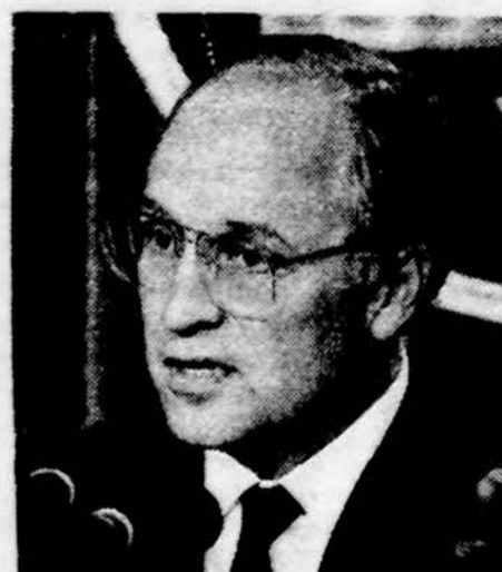
Amerikos Gynybos departamento sek. Dick Cheney pasakė, kad Gorbačiovas gali neišsilaikyti savo pozicijoje.

Paryžiuje pranešama, jog trečiadienį Amerika įteikė NATO įstaigai Briuselyje tam tikrą dokumentą, kurį diplomatai laiko svarbiu ir kurio turinys neskelbiamas, bet manoma, kad gali būti siūlomas kompromiso kelias. Šiuo metu yra žinoma, kad Vokietija palaiko Belgiją, Daniją, Graikiją, Italiją, Norvegiją ir Ispaniją. Susilaiko nuo oficialios pozicijos pareiškimo Kanada, Prancūzija, Islandija, Liuksemburgas, Portugalija ir Turkija. Prieš Vokietijos nusistatymą nemoderninti trumpųjų distancijų raketų aiškiai pasisako Amerika, Britanija ir Olandija. Prisimintina, kad Gorbačiovas vizituos Vokietiją kitą mėnesį.