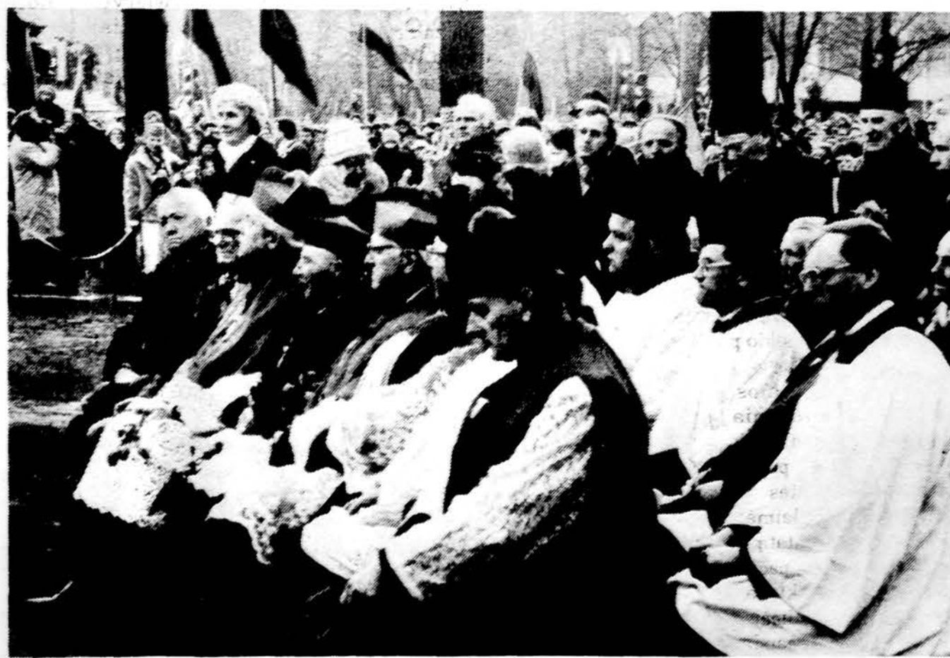
Vasario 16-tosios minėjimas Kaune. Sėdi pirmoj eilėj Landsbergis—Žemkainis, vysk. J. Preikšas, kard. V. Sladkevičius, vysk. V. Michelevičius ir kt.