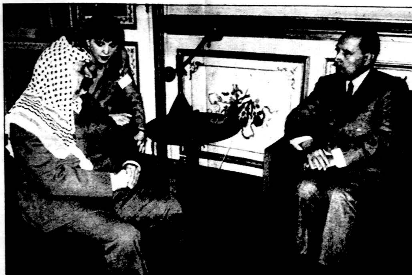
Palestiniečių Išlaisvinimo organizacijos vadas Yasser Arafatas kalbasi su Prancūzijos prezidentu François Mitterrand Paryžiuje Palestinos valstybės įsteigimo klausimais.