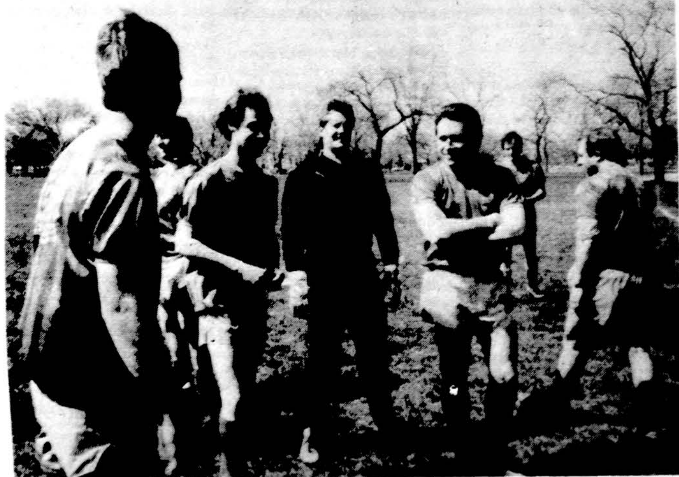
Prieš futbolo rungtynes tariais „Lituanicos“ klubo žaidėjai.