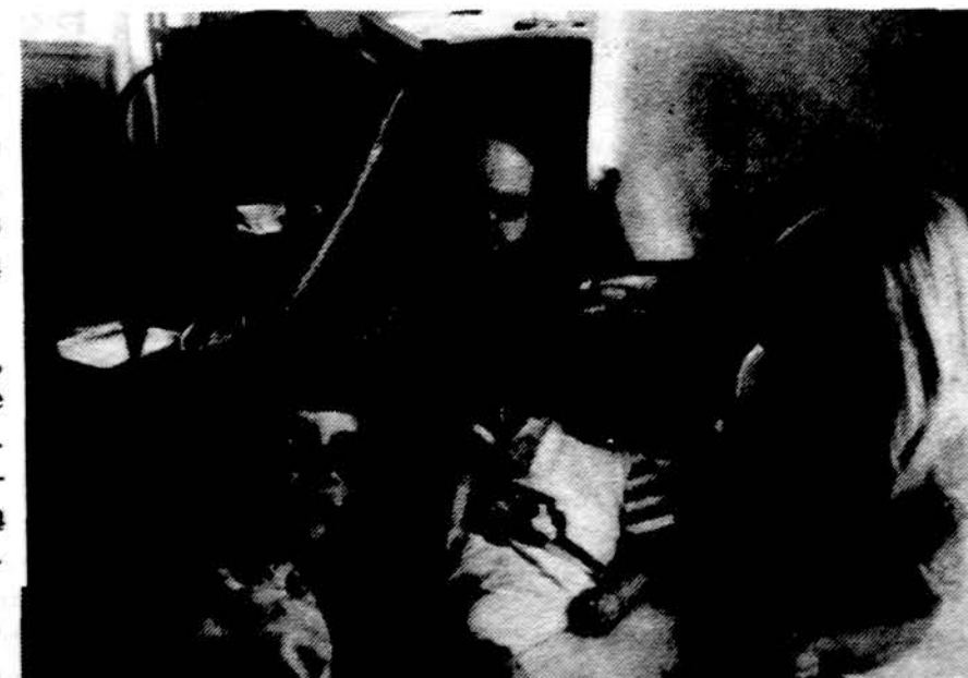
Laiminga mamytė ją mylinčių vaikučių tarpe.

Mano mama yra labai gera. Ji moko mane būti geru, kartais duoda gerų patarimų apie gyvenimą.