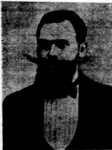
Muzikas Juozas Naujalis

Daugelis Naujalis kūrinių, o ypač jo „Jaunimo giesmė“, „Už Raseinių ant Dubysos“, „Lietuva brangi“ tapo liaudies dainomis. Kai buvo minimas Maironio 125-metis, tai ir Naujalis dainos vėl suskambėjo. Ypač jo bažnytinė muzika susilaukė didelio pripažinimo. Rašė jis ir instrumentinę muziką, tik ji kitokios vertės. Jo simfoninė poema „Ruduo“ 1930 m. dirigavo dirigentas N. Malko, o vėliau Dvarionas. Jo muzika skambėjo ir Amerikoje, ypač pasaulinėje parodoje 1933 m. S. Šimkus yra rašęs, kad tikrasis muzikos jūdėjimas Lietuvoje prasidėjo su Naujaliu.