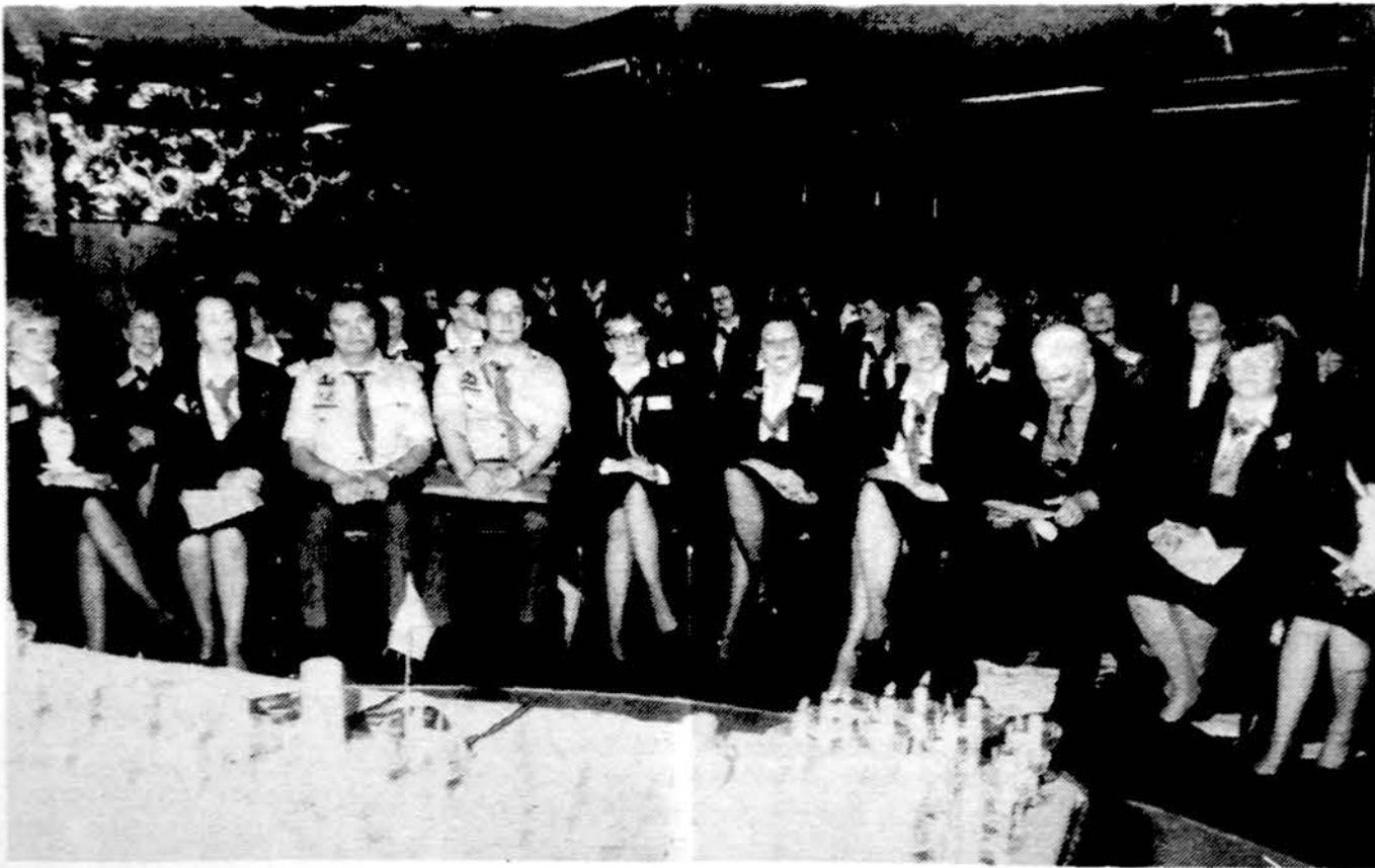
Vaidelis iš LSS skautininkų, ių suvažiavimo Chicagoje atidarymo š.m. balandžio 1 d.