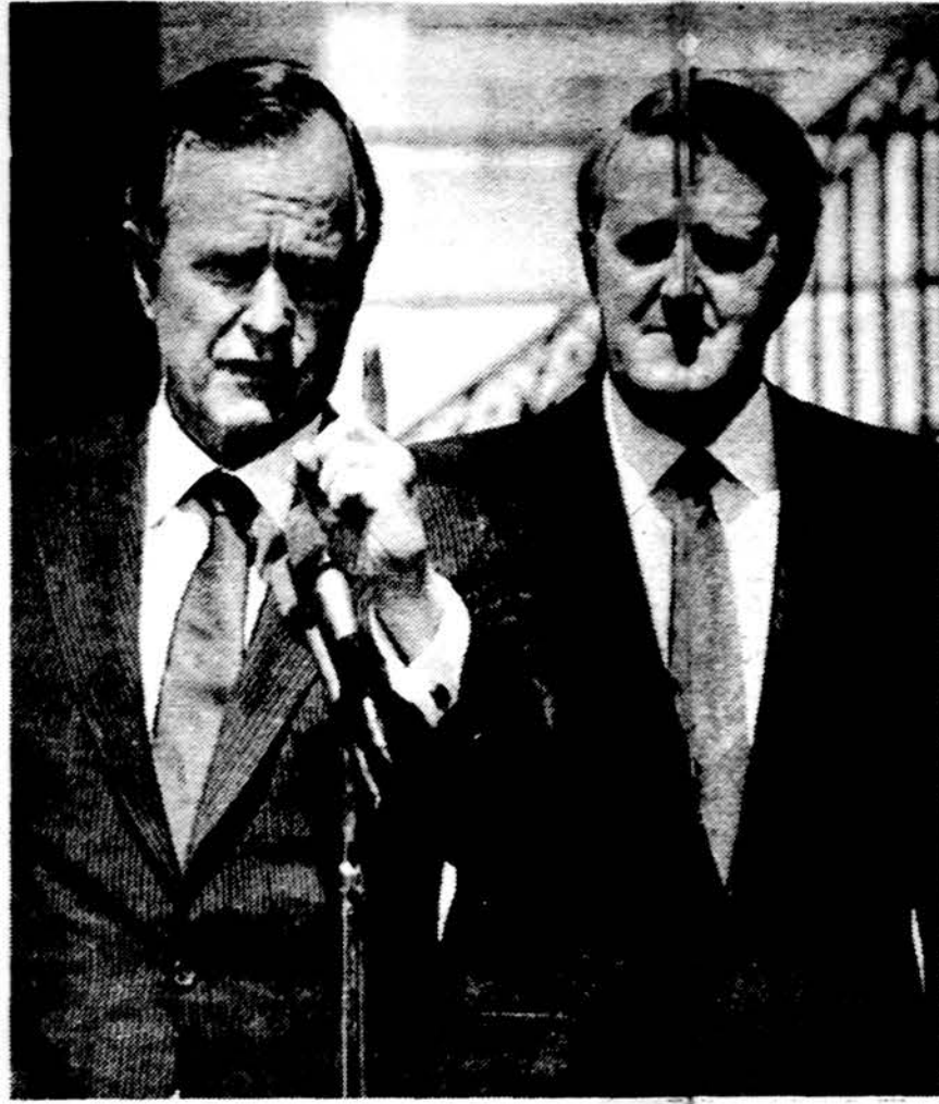
Prez. Bushas atsako į žurnalistų klausimus, kai jis išlydėjo Kanados ministrę pirmininką Brian Mulroneį, dešinėje, kad niekada „nebuvo quid pro quo“ Hondurasui pagalbos suteikime.