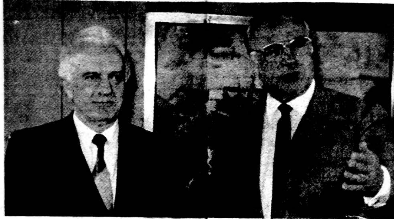
Sovietų Sąjungos Užsienio reikalų ministras Eduard A. Shevardnadze, kairėje, kartu su Vokietijos kancleriu Helmut Kohl praeiūio šėdėdienio pasitarimo metu, kai abu tie kraštai, kartu su Bonos sąjungininkais, pasisako už pasitarimus panaikinti trumpųjų distancijų branduolines raketas, prieš ką pasisako Amerika ir Anglija.

Gegužės 13-14 dieną Taline įvyks pabaltiečių TSRS AT deputatų, sąjūdiečių ir frontininkų asamblėja. Būkstaujama, kad deputatai gali padaryti savo vardu pražūtingus Pabaltijo tautoms kompromisus, nuolaidas Maskvai Molotovo-Ribbentropo pakto 50-ųjų metinių proga. Ar pasmerke pakta? Ir jo pasekmes, deputatai išdrįs reikalauti jas likviduoti, t.y. išvesti iš Pabaltijo valstybių okupacinę kariuomenę! Tautines, kultūras ir ekonomines problemas aneksuotose Pabaltijo valstybėse galime išspręsti tik išvedus iš ten okupacinę Rusijos kariuomenę, sugrąžinus toms valstybėms politinę nepriklausomybę. Tegul šios akcijos suvokimas neapleidžia deputatų asamblėjoje.