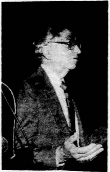
Poetas Bernardas Brazdžionis Tautos Dainių, po 45 m. atvykusį į tėvynę, Vilniaus aerodrome sutiko kelių tūkstančių tėvynainių minia. Jį