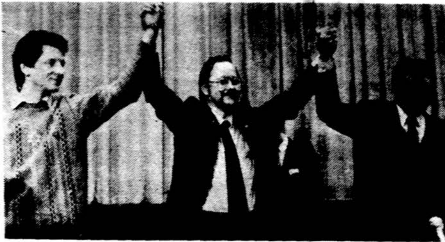
Po Pabaltijo Asamblėjos dokumentų-sutarčių pasirašymo Taline gegužės 14 d. Kairėje Latvijos Liaudies Fronto Dūmos tarybos pirmininkas Dainis Ivans, Lietuvos persitvarkymo Sąjūdžio Seimo tarybos pirmininkas Vytautas Landsbergis, viduryje, Estijos Liaudies Fronto valdybos pirmininkas Edgar Savisaar, dešinėje. Susitarimo tekstas buvo atspausdintas praėjusio šeštadienio gegužės 20 dienos laidoje.