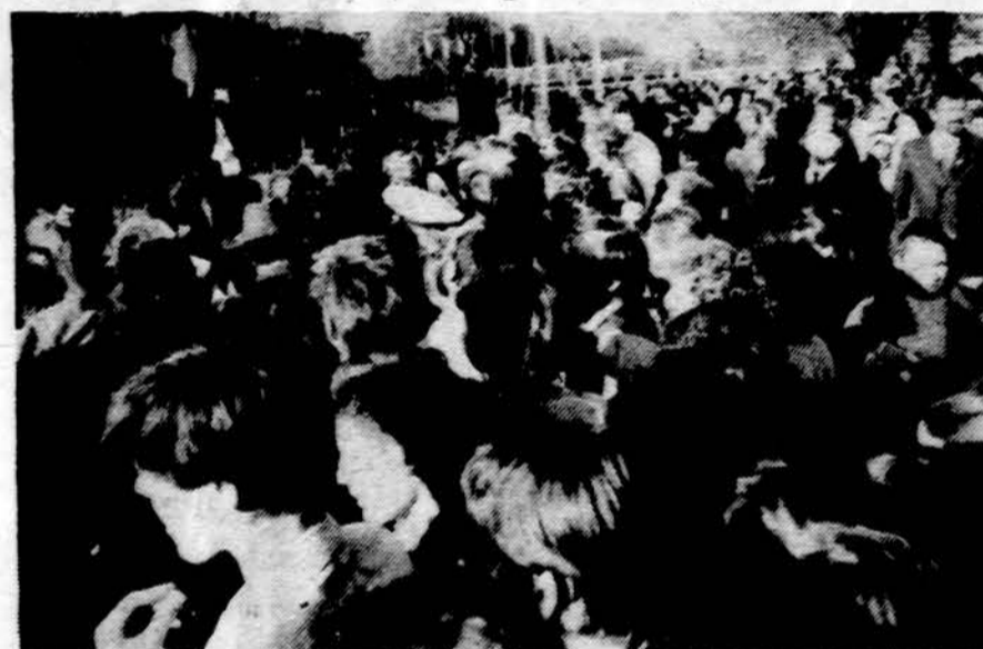
Minio žmonių susirinko Klaipėdos uoste palydėti buriuotojus transatlantinė kelionėn.

Sutikimas New Yorko uoste jau yra suplanuotas New Yorko priėmimo organizacinio komi-