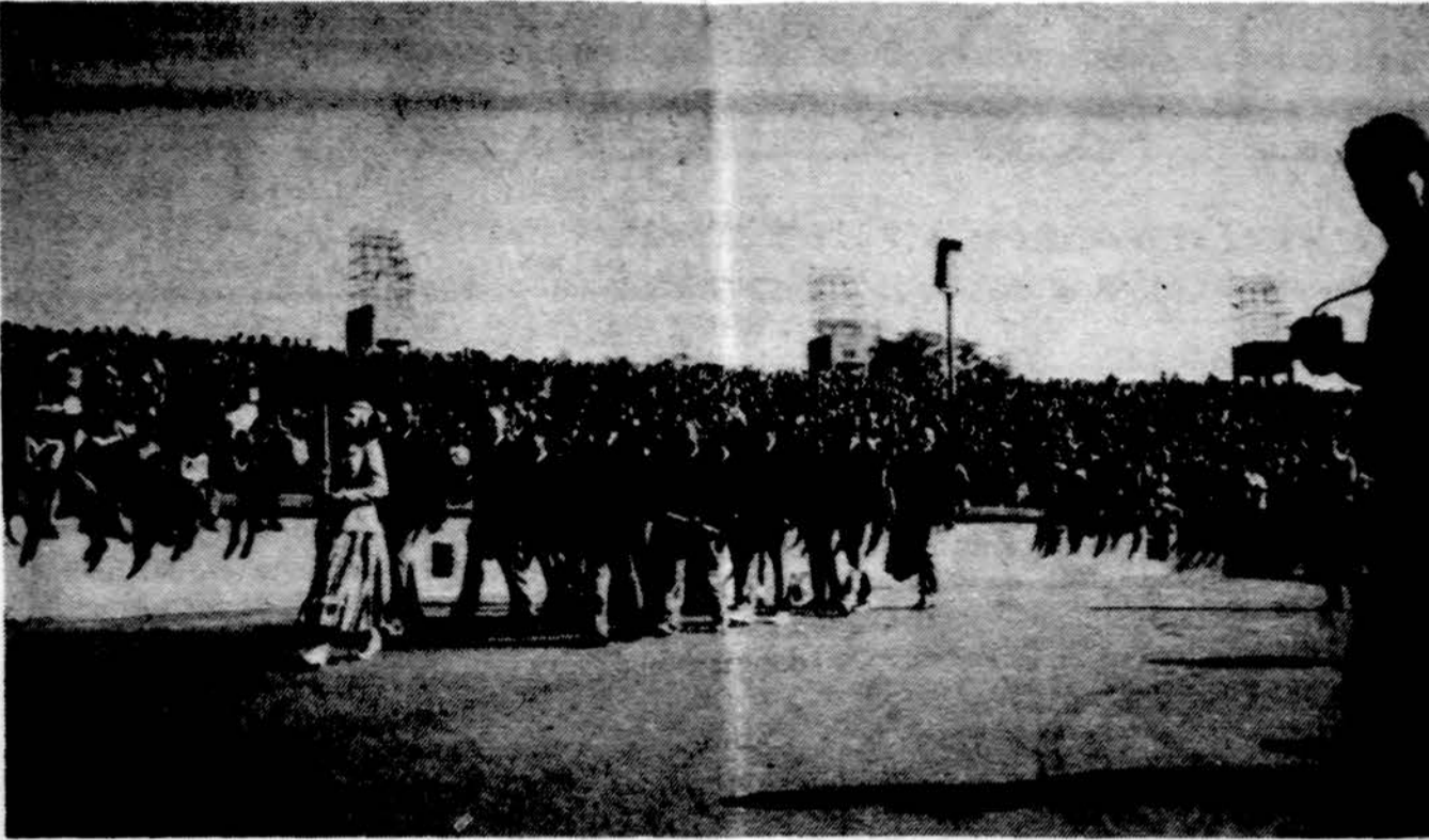
Buriuotojų išlydėjimo iškilmės Klaipėdos sporto stadione. Žygiuoja jachtos „Lietuva“ igula.

Metinio „Kovo“ susirinkimo metu dalyvavo ir svečiai sportininkai iš Lietuvos – buvęs Lie-