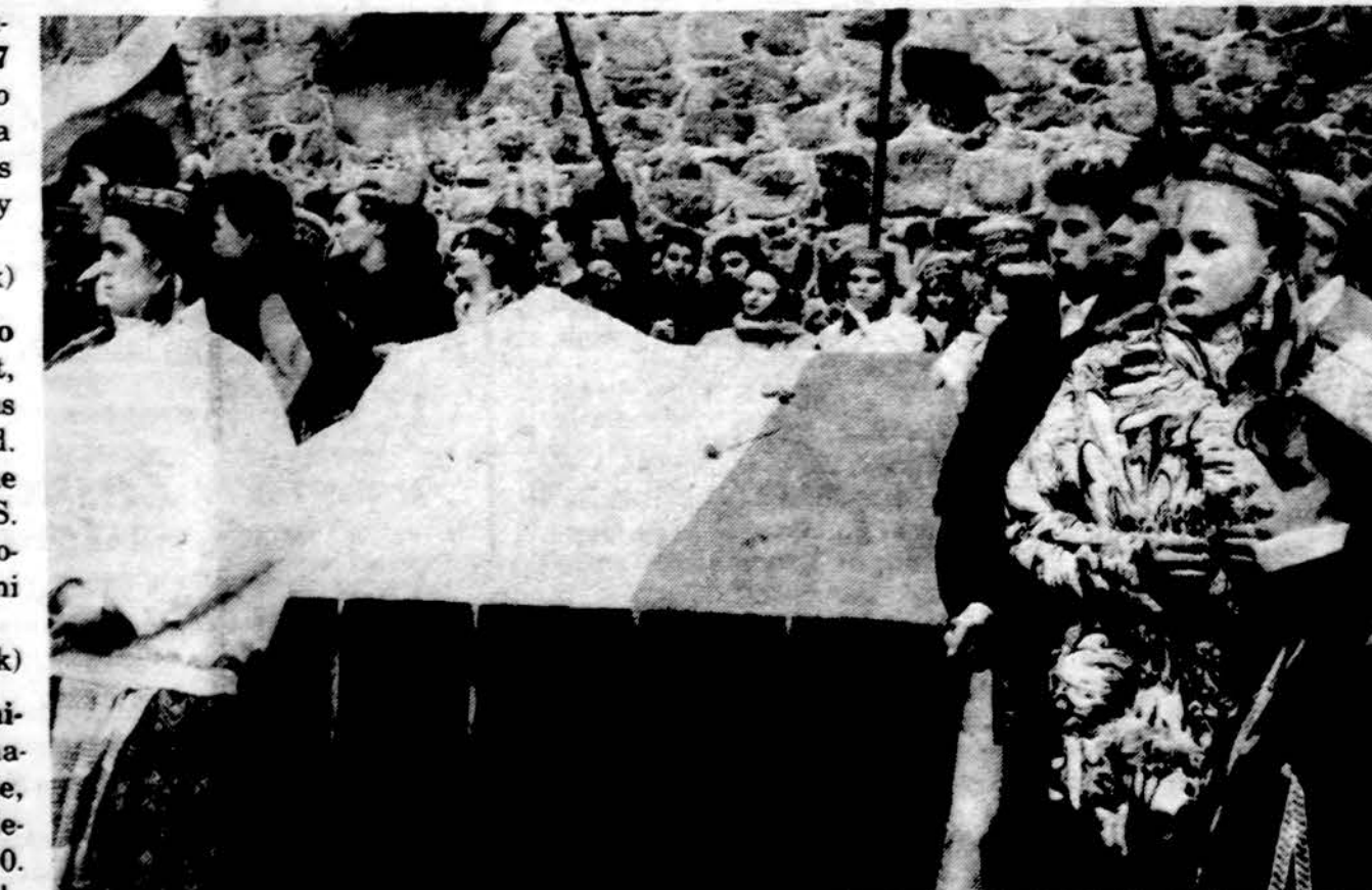
Tautinės vėliavos iškilimas Trakų pilyje. Kelė lietuvių jaunimas.

Darbo val. nuo 9 iki 7 val. vak. Šeštad. 9 v. r. iki 1 val. d.