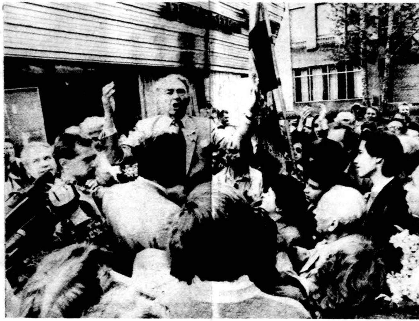
Poetas Bernardas Brazdžionis kalba Vilniaus aerouoste.

Bejingas. Kinijos sostinėje liejasi kinų kraujas. Partija įsakė kariuomenei pulti tankais ir šarvuotais beginkliais studentus. Tūkstančiai kinų, ir senų ir jaunų, net ir moteris įskaitant, šeštadienį, sekmadienį ir pirmadienį priešinosi prieš savo kareivius, kurie traukė kinus su tankais, šaudė į žmones, leido ašarines dujas. Kareivius kinai vadino gyvuliais, kurie teisinosi, kad jiems įsakytą tai daryti, o kareivis negalys neklausyti įsakymo. Tačiau studentai ir vyresni žmonės vis iš naujo sudarydavo susikibę rankomis žiedus apie kiekvieną šarvuotą sunkvežimį ir reikalavė drausti trauktis. Ligoninėms uždrausta pasakyti, kiek yra žuvusių ir sužeistų, bet jau žinoma, kad tūkstančiai. Žuvusiųjų ar sužeistųjų vietos tuoj užima nauji kinų būriai. Zada skelbti generalinį streiką. Sekmadienį buvo apmažėje demonstrantų, bet pirmadienį vėl šimtai tūkstančių pirsipildė sostinės gatvės. Iš automatinųjų šautuvų šaudoma visomis kryptimis.