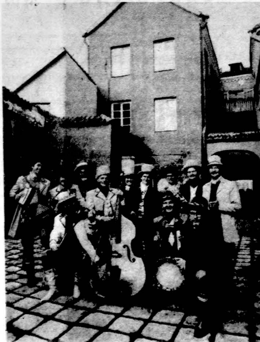
„Armonika“, ansamblis iš Vilniaus, pasirodė lietuvių kolonijoje.