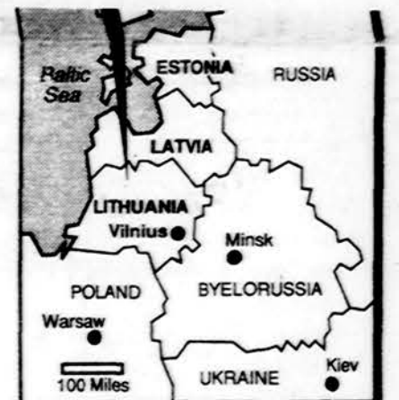
Ši žemėlapi prideda pasaulio žinių agentūros, išskeldamos 1939 m. sutarčių autentiškumą.

Kartu su amerikiečių karininku jie iškasė tą metalinę dėžę, kurioje buvo mikrofilmai. 1945 m. gegužės 14 d. Tiuringijoje, netoli Miulhauseno, kuris dabar priklauso Rytų Vokietijai. Vokiečių mikrofilmas buvo nuvežtas i Angliją, kur 1945 m. buvo padarytos fotografijos. Iš jų buvo padaryti nauji mikrofilmai. Sovietai nelaiko jų autentiškais, sakydami, jog nežinoma, kur yra originalas, o kur fabrikatas.