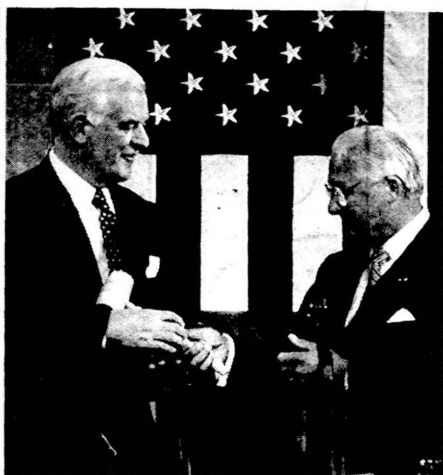
Kongr. Thomas Foley, kairėje, priima Atstovų rūmų speakerio ženklą — plaktuką iš mažumos vado Robert Michel, kuris jį pristatė, kai jis buvo išrinktas. R. Michel gavo plaktuką iš pasitraukusio Jim Wright, o paskui jį įteikė naujam speakeriui.

Gorbačiovo pastabos buvo pareiktos tada, kai tebesėdėdžiąją delegatą reikė protestus, kodėl Kremlius tyli, kai Kinijoje vyksta masinės žudy-