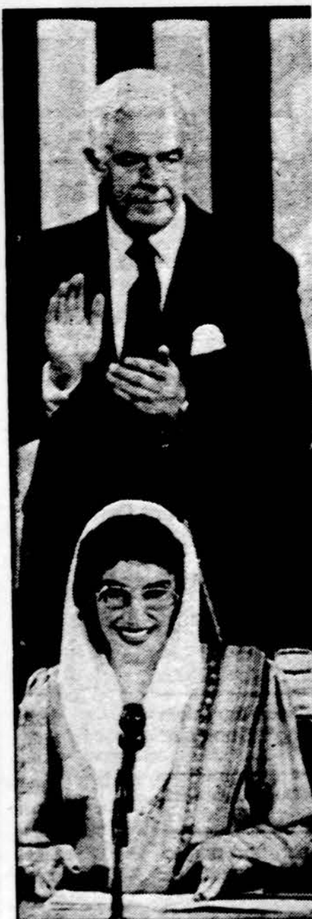
Pakistano ministrė pirmininkė Benazir Bhutto kalba jungtinėje JAV Kongreso sesijoje. Už jos — naujasis Atstovų rūmų speakeris Thomas Foley.

binius pietus. Senato vadai jau pritarė prašomai sumai. Pakistano premjerė Benazir Bhutto yra baigusi Harwarde universitetą, o taip pat ir Oxfordo universitetą.