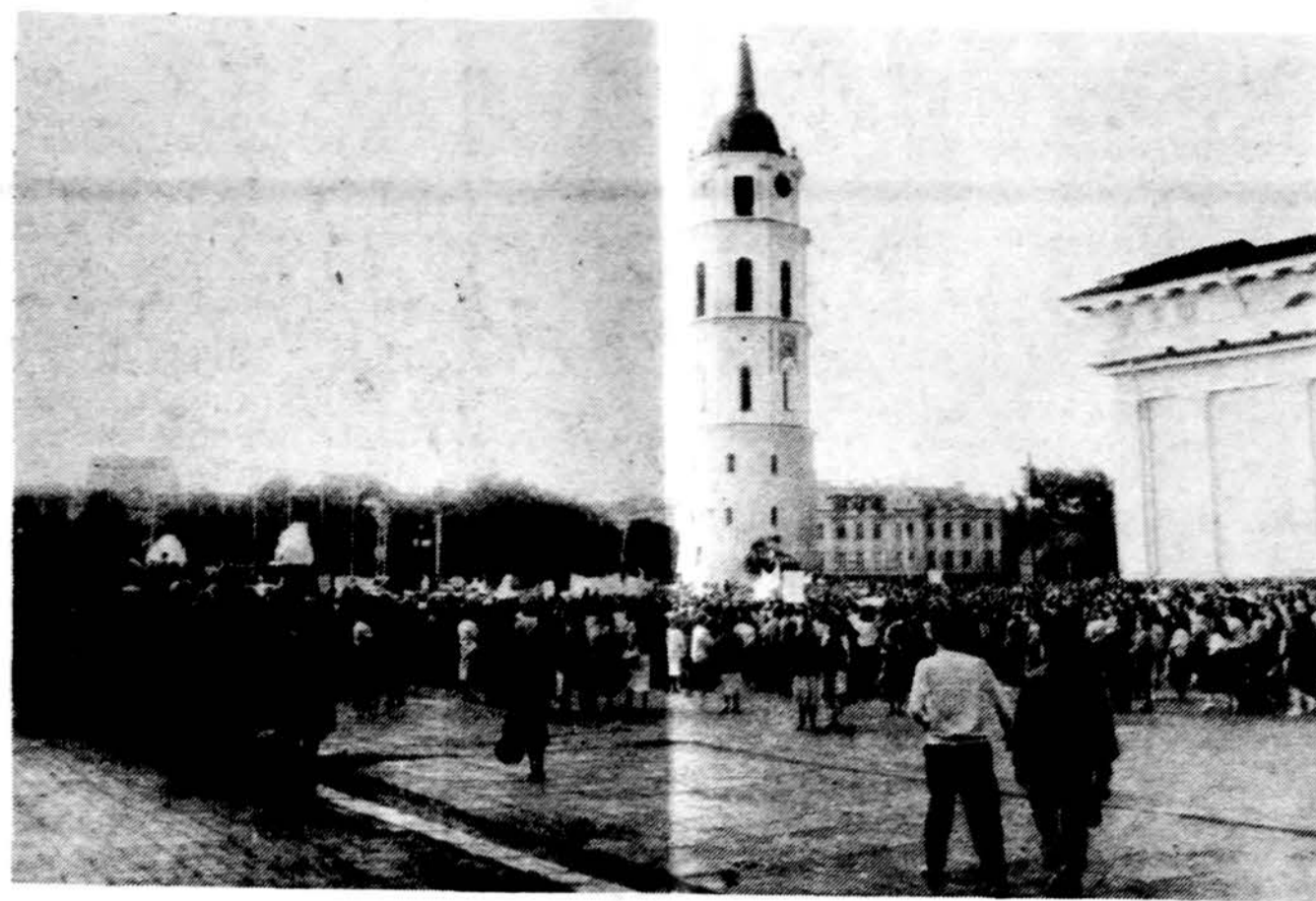
Pasiruošę pamaldoms Vilniaus katedros aikštėje.