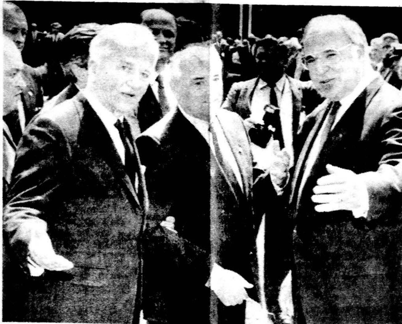
Sovietų Sąjungos prez. Michailas Gorbaciovus, iduryje, kai jis pirmą kartą atvyko į Vakarų Vokietiją. Už rankos jį laiko Vokietijos prez. Richard von Weizsacker, kaireje, ir kancleris Helmut Kohl, dešinėje.