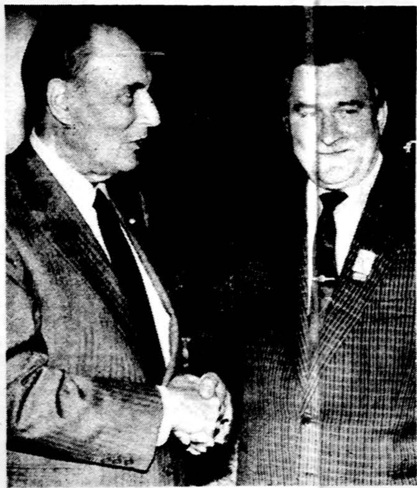
Prancūzijos prez. François Mitterrand atvyko į Gdanską pas Solidarumo vadą Lechą Wałęsą su kuriuo turėjo pastarimus paskolos klausimais ir prekybos išplėtimo reikalais.