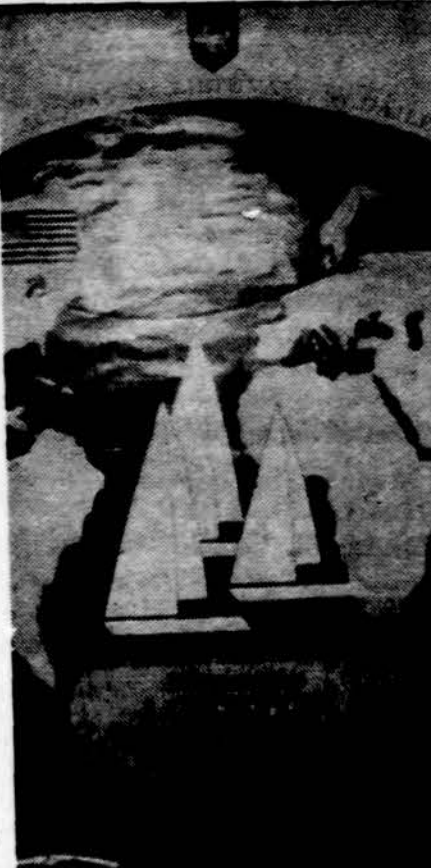
rinės laivas švirksdamas vandens vaivorykštes, 40 jachtų, pasipuošusių Lietuvos trispal-