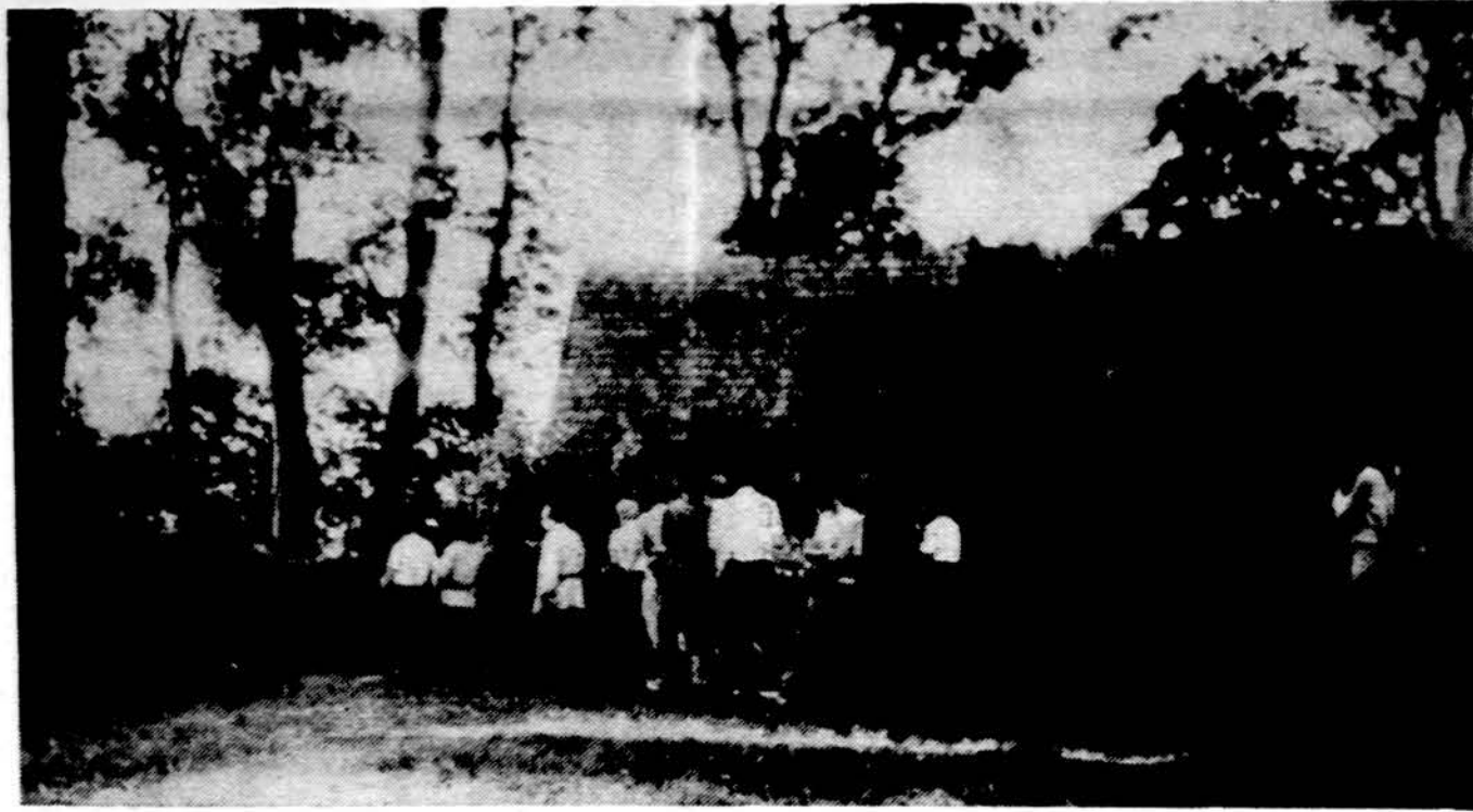
Lietuvos jaunimas apžiūri 19-to amž. sodybą Krokialaukyje.

Taip pat augo jaunos katali- kiškos šeimos, pasiryžusios au- ginti maldą praktikuojančius vaikus, gerai žinančius ir Lie- tuvos istoriją.