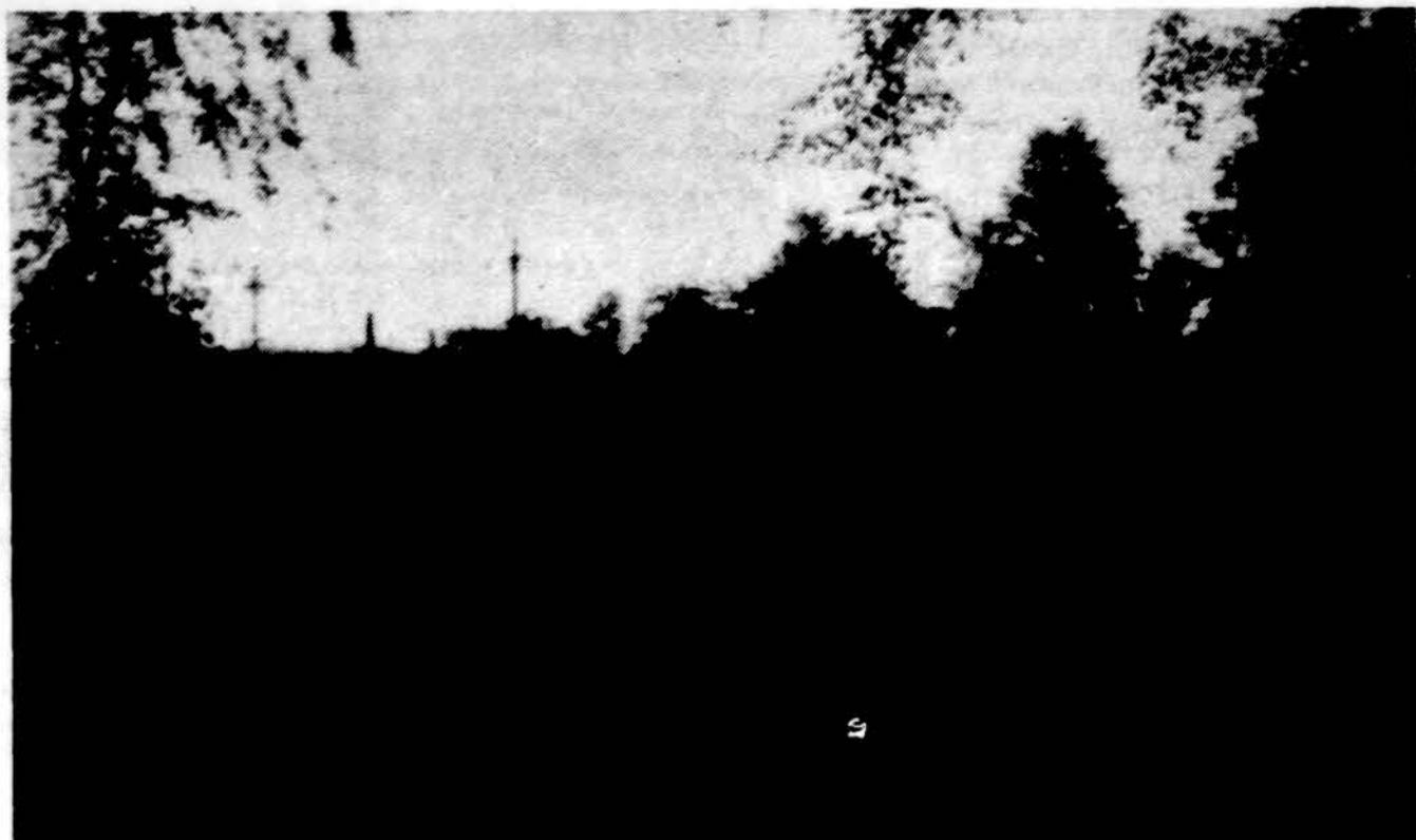
Dainava po audros – su nuverstais kryžiais

Metinė šventė bus liepos 23 d. Dainavoje, 15100 Austin Rd.