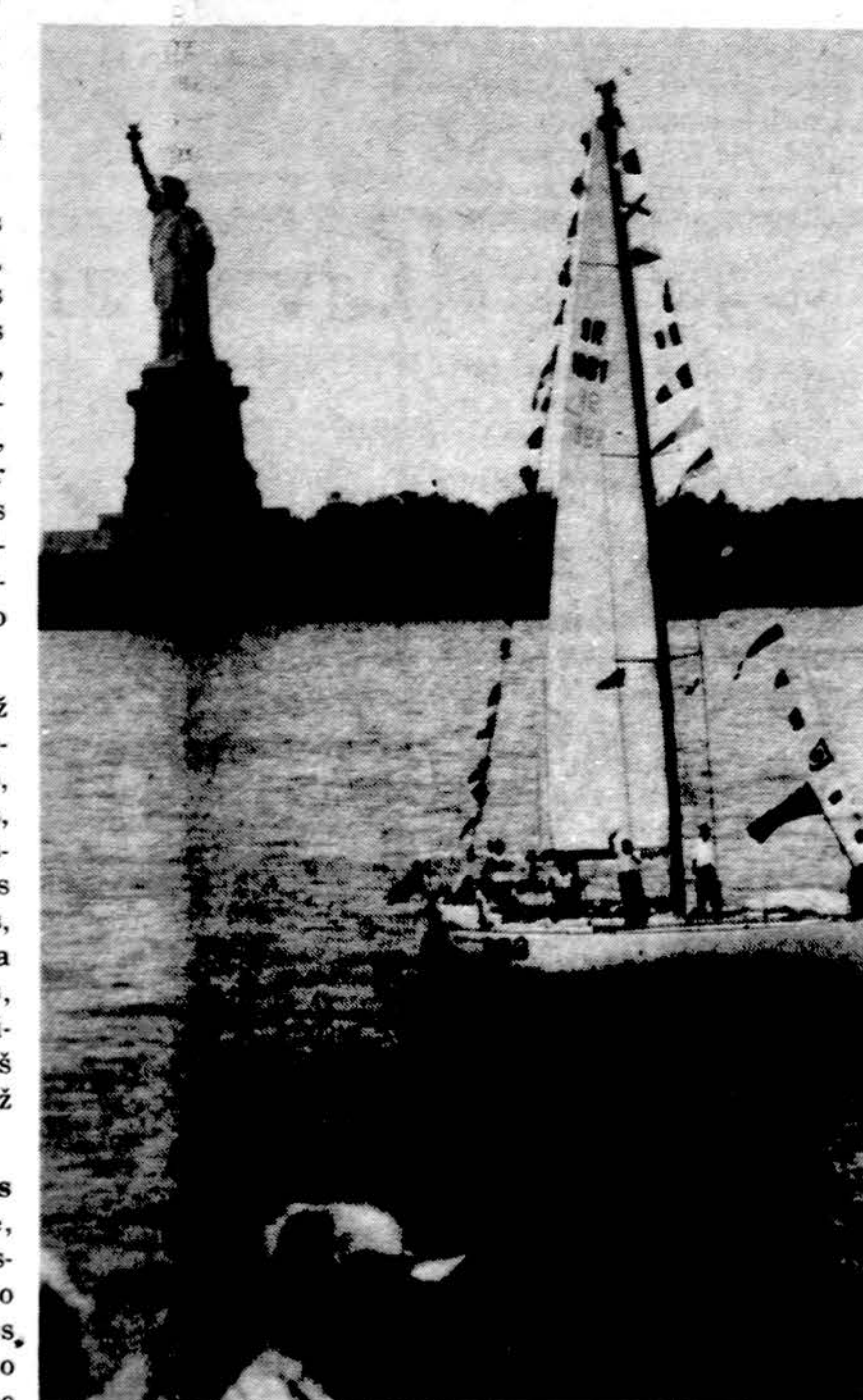
„Dailė“ burlaivis, praplaukęs Atlanta, Liberty statulos fone.

Prof. Landsbergis padėjo už tokį šiltą priėmimą. Priminė, kad Chicagoje jau buvo prieš 1½ metų tada kalbėjo apie Čiurlionį, apie lietuvių kūrybinę dvasią, kuri padėjo išlaikyti lygybę jausmą tarp tautų. Toliau kalbėjo, kad daugeliui rodosi, jog sąjūdis toks neaiškus dalykas. O sąjūdis yra tai, kas vyksta širdyse, protuose, kas tikra ir reikalinga. Tai galima