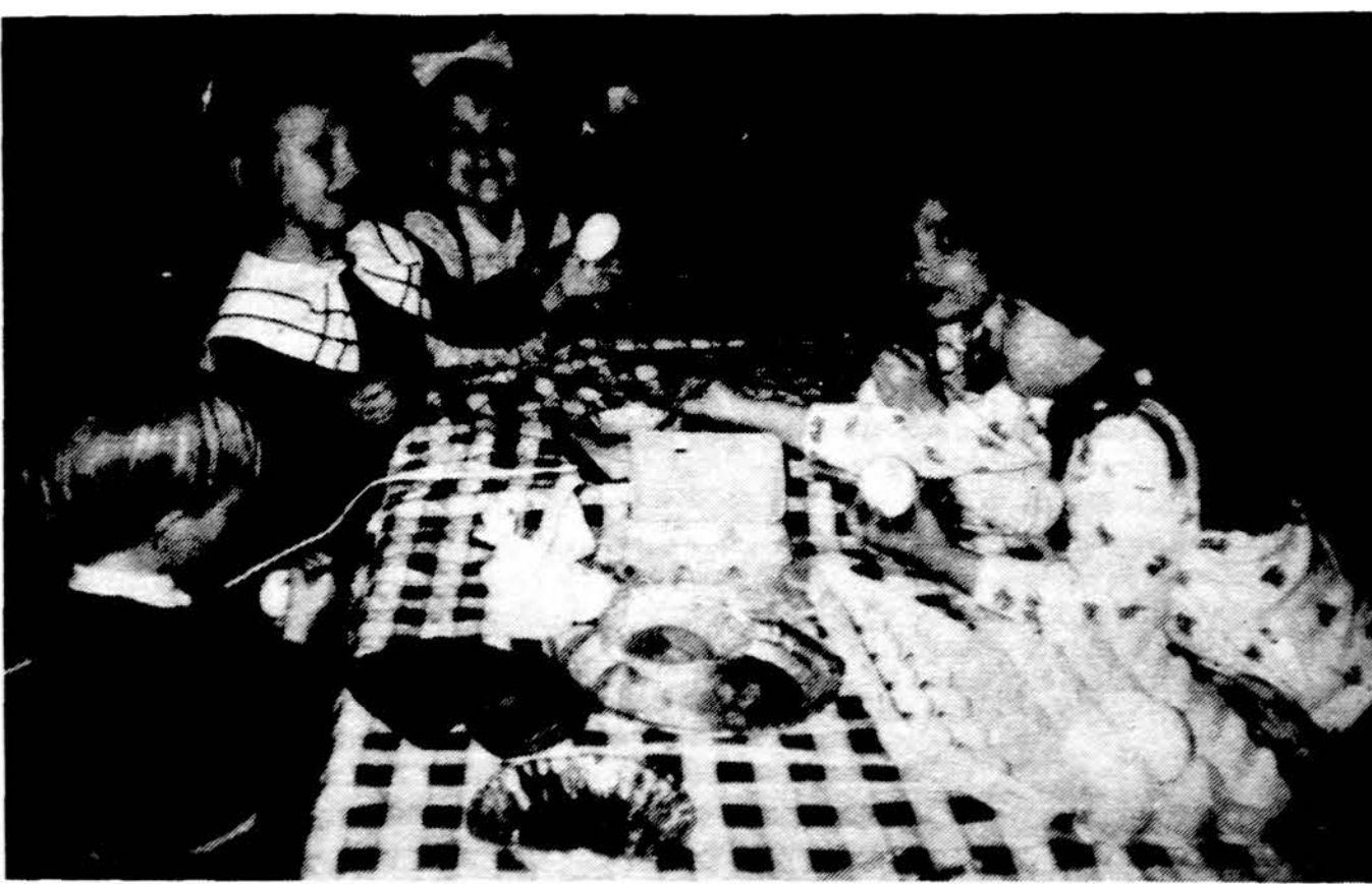
Mano margutis bus gražiausias.

Isteigtas Lietuvių Mokytojų Sąjungos Chicagos skyriaus