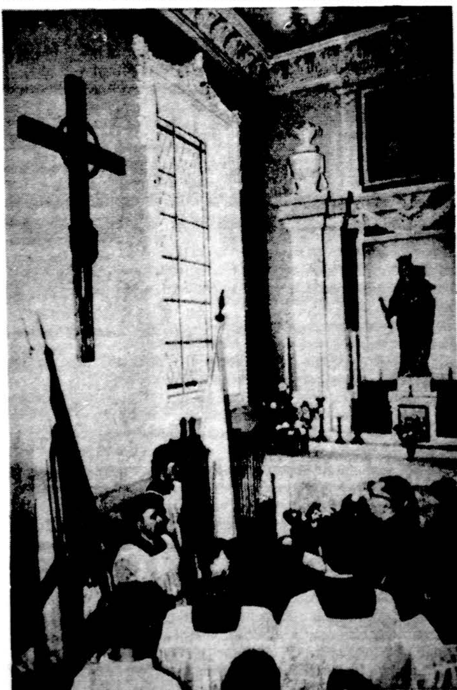
Šv. Antano bažnyčioje Kaune pašventintas tremtiniams atminti kryžius birželio 14 d.

Pastaba. Užsakant knygas per paštą, pinigų nesiūsti, užsimokėsite gavę sąskaitą, kurioje bus pridėta ir persiuntimo išlaidos.