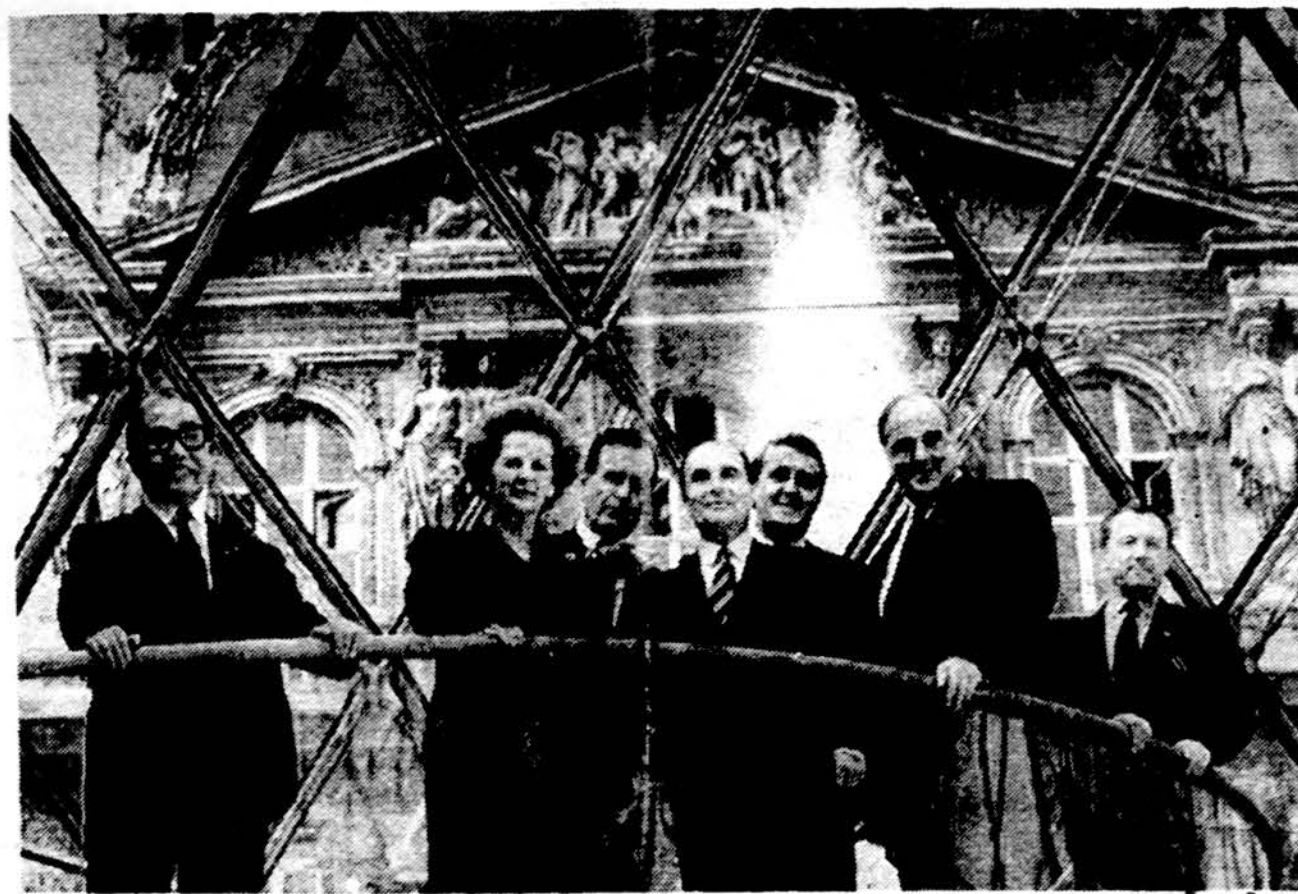
Prieš pradėdami septynių didžiųjų valstybių ekonominę viršūnių konferenciją Louvre rūmuose. Iš kairės matyti Japonijos min. pirm. Souseke Uno, Britanijos min. pirm. Margaret Thatcher, JAV prez. George Bush, Prancūzijos prez. Francois Mitterrand, Kanados min. pirm. Brian Mulroney, Vokietijos kancleris Helmut Kohl ir Europos Bendruomenės prez. Jacques Delors. Nuotraukoje nėra Italijos min. pirm. Ciriaco De Mita, kuris taip pat dalyvavo sesijose.