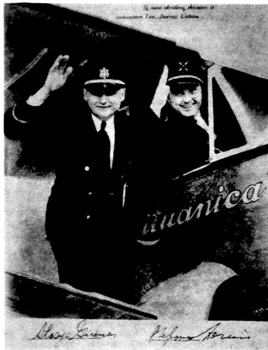
Lietuvių tautos didvyriai Steponas Darius ir Stasys Girėnas.

Isteigtas Lietuvių Mokytojų Sąjungos Chicago skyriaus