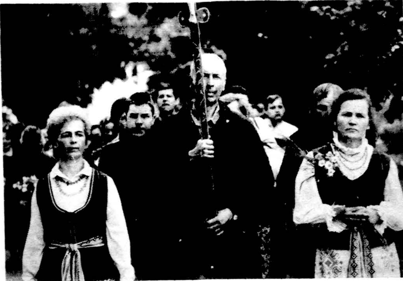
Kelionėje iš Vilniaus į Žemaičių Kalvariją.

„Stovėkit amžiais čia tvirti, kaip saulė stovi! —