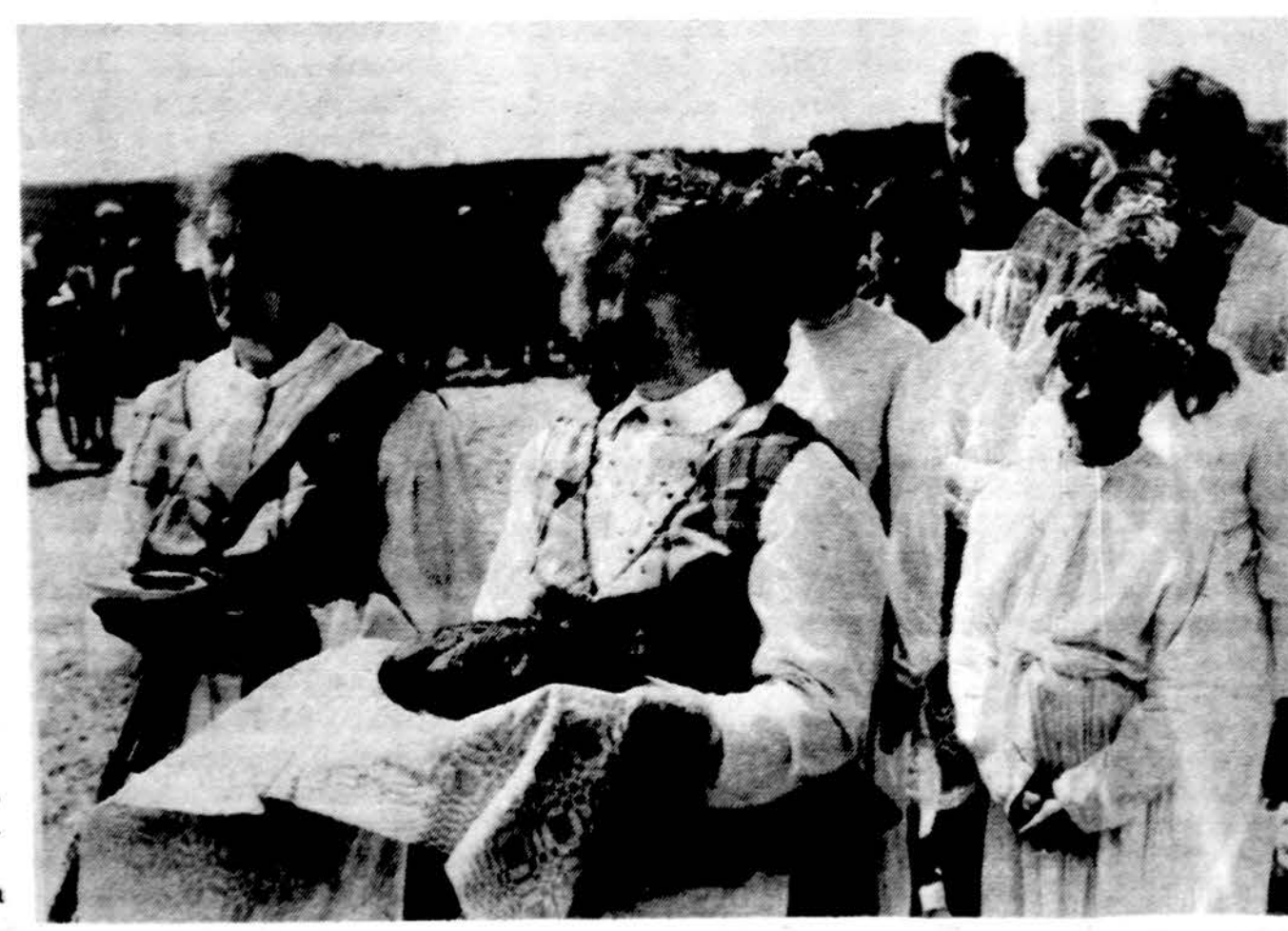
Maldininkus pasitinka Grinkiško parapijos kryžiaus mylėtojai.