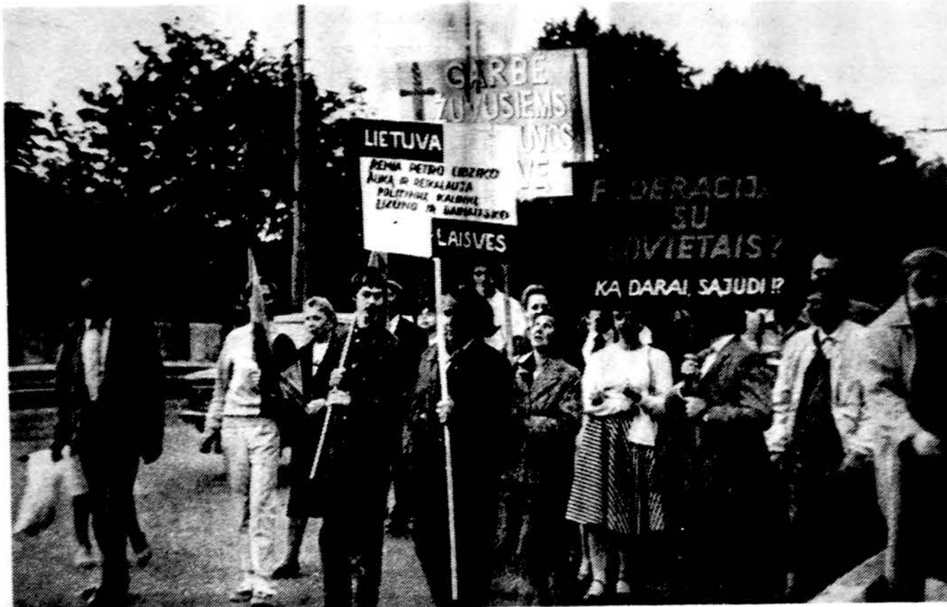
Demonstracijos Lietuvoje išreiškia lietuvių tautos nuotaikas. Čia matome tik mažytę dalelę protestuotojų iš tūkstančių Vilniuje, kai krašto gyventojai pasisako prieš federaciją su Sovietais.