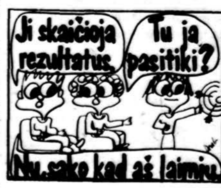
Piešė Lina Grigaitytė