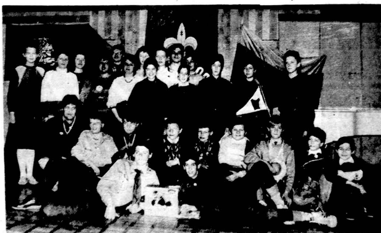
Mažeikių miesto skautai ir skautės