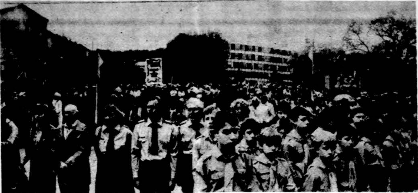
Skautų gretos Gedulo ir Vilties iškilmėse Kaune, š.m. birželio 14 d.