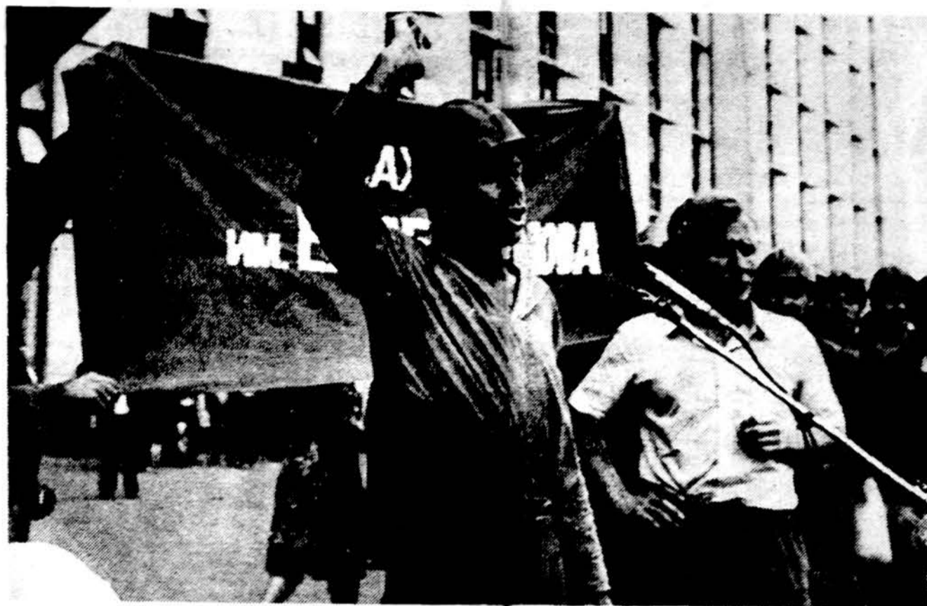
Vienoje Ukrainos Donecko srities kasykloje streikuotojų vadas stato kasyklininkų reikalavimus. Gorbačiovas ragina vietines unijas, Komunistų partijos komitetus ir savivaldybes reaguoti į reikalavimus, o streikuotojus, jei reikia, pašalinti neįtrauktus valdininkus.

ru ir išvijos politinių veikėjų mintis apie tai, kad kelias į Lietuvos nepriklausomybę – tai konstitucinis parlamentinis kelias. Juo suinteresuoti Rytai ir Vakarai“.