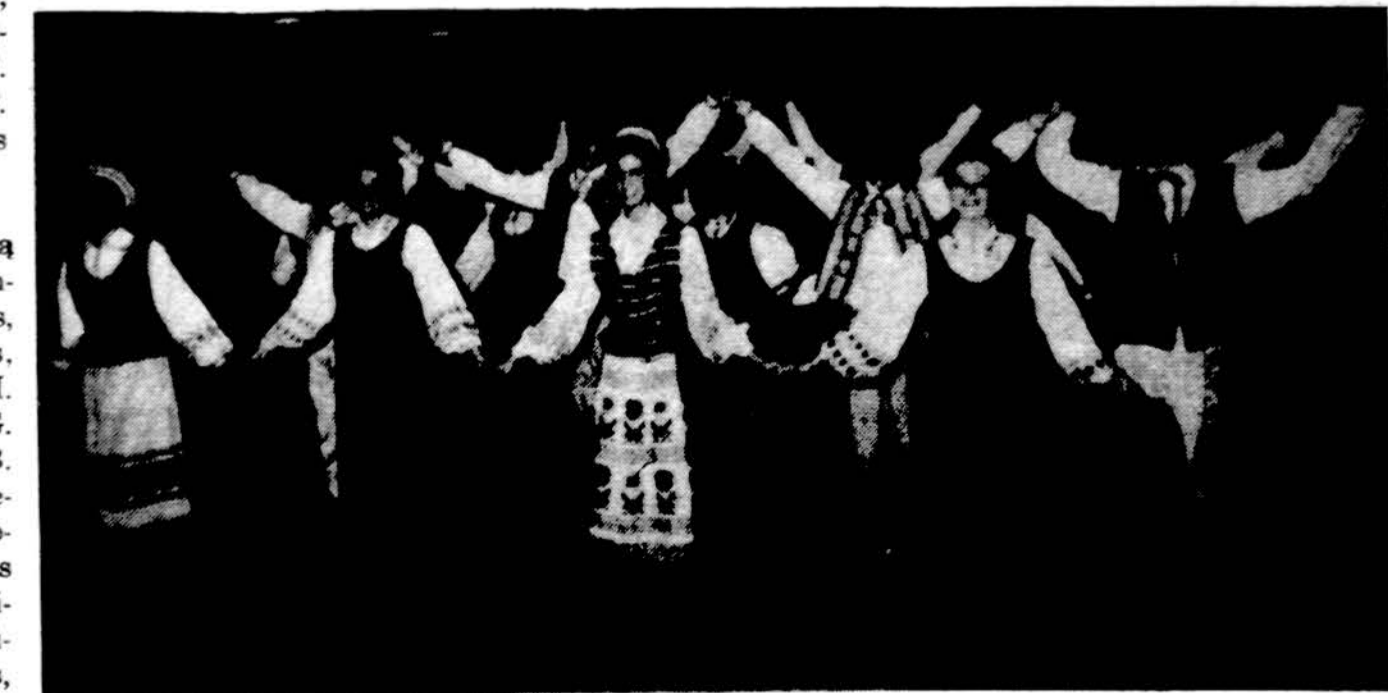
„Spindulio“ tautinių šokių šokėjai šoka per savo vakarą birželio 10 d. Lemonte.

Dr. Vyt. Landsbergis, lyg dailininkas, plačiais tvirtais potėpiais drobėje piešė, apibūdino dabartinę būklę Lietuvoje. Protarpiais jo ramiame pasakojime švytėdavo ir juoko gaidelė. Tėvynėje jau, atrodo,