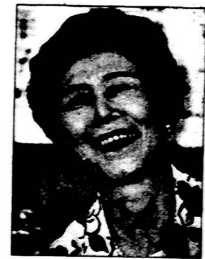
Takako Doi, Japonijos naujai atsigaivintos Socialistų partijos vadovė, džiaugiasi rinkimine pergalė.

Saulė teka 5:38, leidžiasi 8:15. Temperatūra ketvirtadienį: aukščiausia 92 F, žemiausia 74 F; debesuota, galimybė audros. Penktadienį: aukšč. temperatūra 86 F, žem. 72, debesuota, galimybė audros.