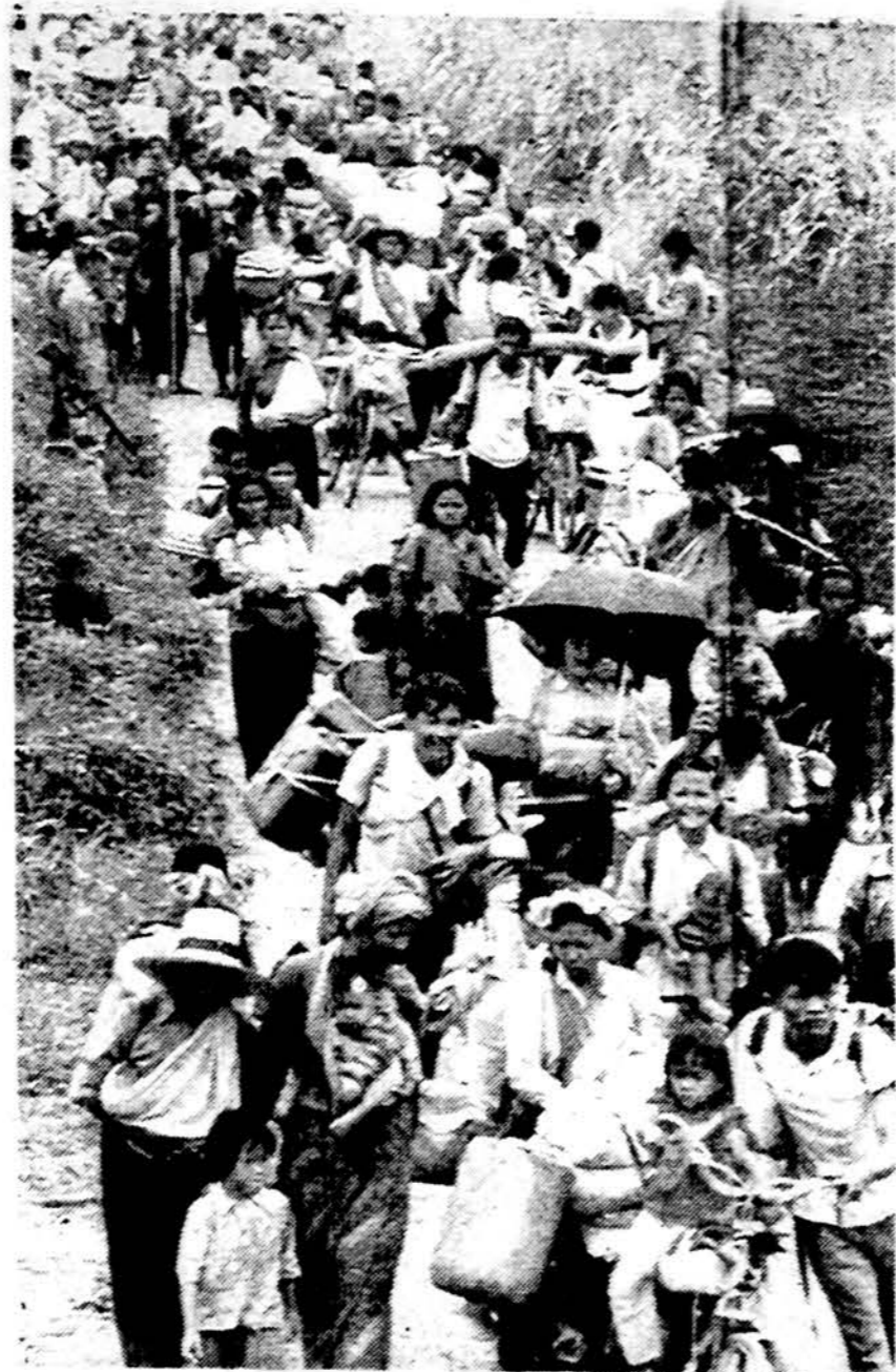
Kambodičiai pabėgėliai apleidžia komunistų kontroliuotą tremtinių stovyklą Tailando-Kambodijos pasienyje. Praėjusį savaitgalį, užpuolus š. vietnamiečiams, aštuoni žmonės buvo užmušti. Pirmadienį derybos Paryžiuje, kad Vietnamas nustotų okupuoti Kambodiją nutrūko dėl nesutarimo.

Eina nuo 1972 metų, Perskaitęs duok kitam! Jei gali, padaugink!