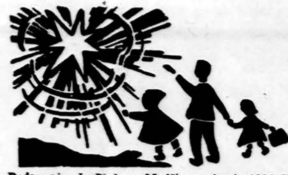
Redaguoja J. Plačas. Medžiagą siūsti: 3206 W. 65th Place, Chicago, IL 60629

x ALTS Chicago skyrus gegužinė įvykis š.m. rugpjūčio 6 d., sekmadienį, 1 v. p.p. Ateitininkų namų ažuolyne, Lemon-te. Lietuviškoji visuomenė kviečiama gausiai dalyvauti ir maloniai praleisti šią sekmadienio popietę. (sk.)