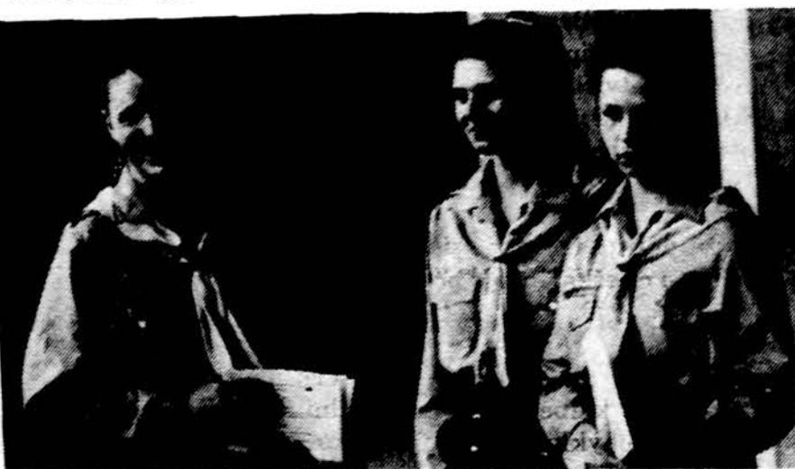
Vyresnės skautės Klaipėdoje laukia laišku nuo brolių ir sesių Amerikoje.

Mūsų mokyklėje jau daugel metų veikia „Gintaro“ klubas.