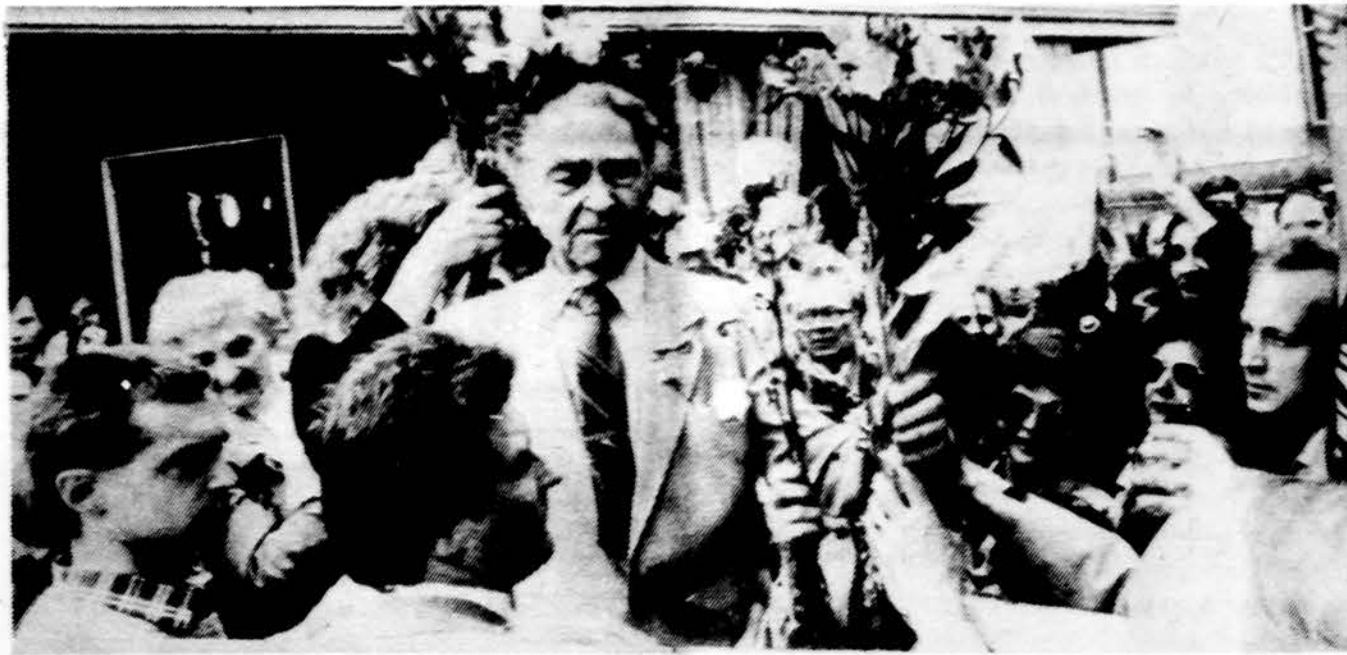
Poetas Brazdžionis patenkintas tarp vidurinės ir jaunosios kartos gerbėjų Vilniuje.

Gruodžio 9 d. – „Dirvos“ jubiliejinį metų atidarymo vakarienė Lietuvos Tautiniuose namuose.