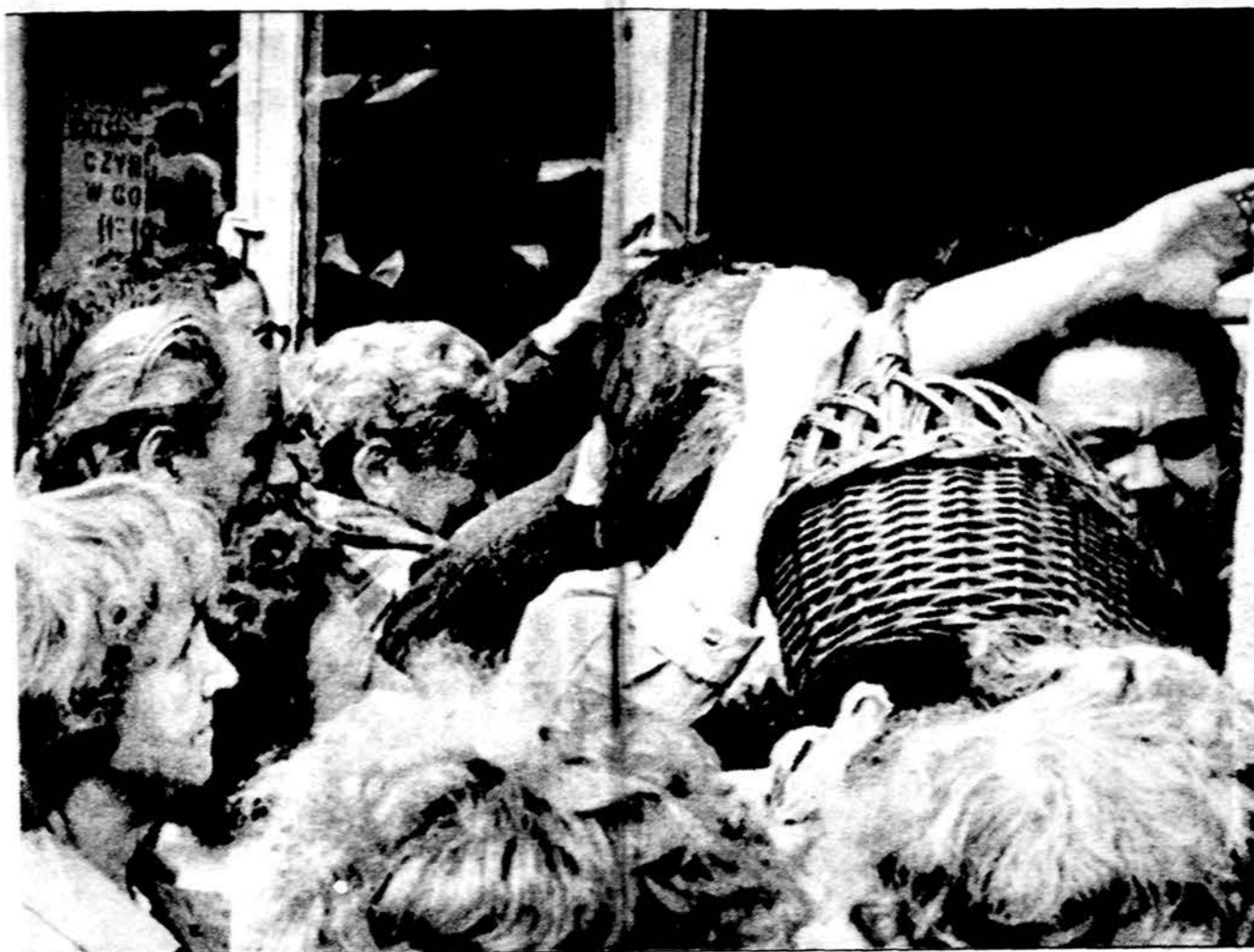
Pikti pirkejai Varšuvoje pirmadienį grūdas į krautuves, stengdamiesi apsirūpinti maistu dar prieš kainų iškilimą net 300 procentų, panaikinus maisto kainų kontrolę. Daugelis krautuvių Lenkijos sostinėje buvo išpardavusios jau prieš vidurdienį ir anksčiau užsidarė.

Po to karstai su palaikais buvo išvežti į įvairias Vilniaus kapines, kur ir buvo palaidoti.