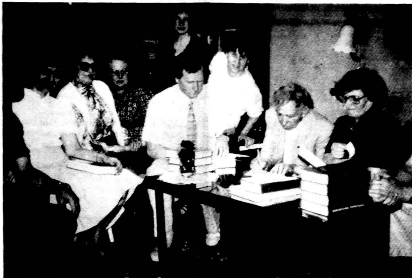
Poetas Bernardas Brazdžionis Vilniuje pasirašinėja savo „Poezijos pilnatį“, Lietuvoje išleista pirvaicia iniciatyva šimto tūkstančių laida.