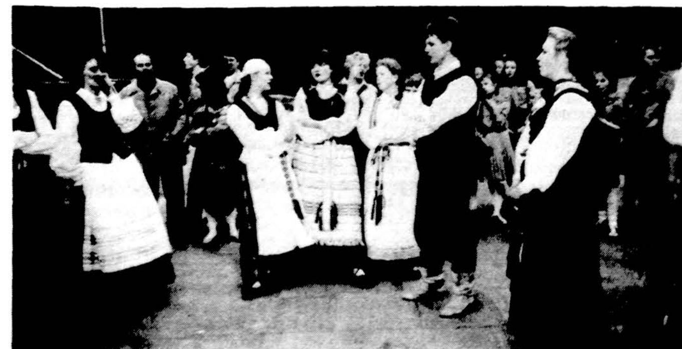
Lietuvos Skautų sąjungos steigiamajame suvažiavime Vilniuje, vykusiame š.m. balandžio 29-30 dienomis, liaudies dainas dainuoja sesės ir brolis iš Klaipėdos.

Specialybė — Vidaus ligų gydytojas Kalbama lietuviškai 6165 S. Archer Ave. (prie Austin) Valandos pagal susitarimą Tel. 585-7755