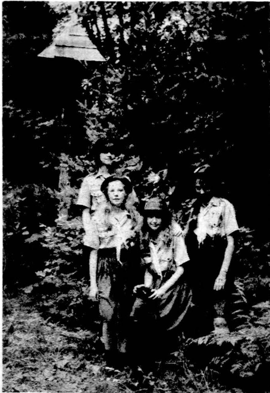
„Gerojo aitvaro“ stovykloje skautėių įžodį davusios sesės iš Lietuvos.

Mažeikiuose yra susikūrusi Kęstučio draugovė, kuri sudeda iš keturių skiltių. Tai „Vilkų“, „Lapinių“, „Vanagų“ skiltys ir nedidelė sesučių „Stirnu“ skiltis. Mūsų veikla įvairi – platiname Sajūdžio spaudą, susipažįstame su rajono, Lietuvos vietovėmis. Lavinamės, ugdome savyje pastabumą, tvirtumą, miklumą. Per savano-