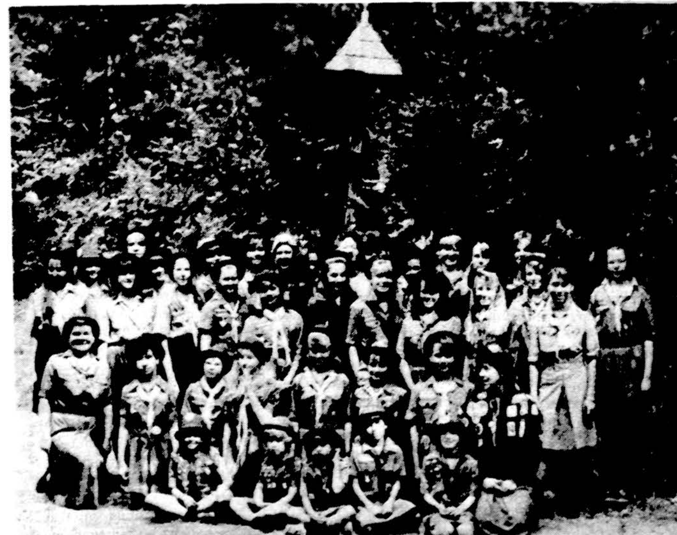
„Kernavės“ tunto „Gerojo aitvaro“ stovyklos stovyklavietėje.