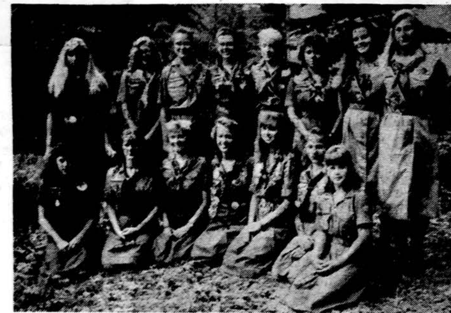
„Aušros Vartų“ tunto „Birutės“ stovyklos stovyklavietėje.