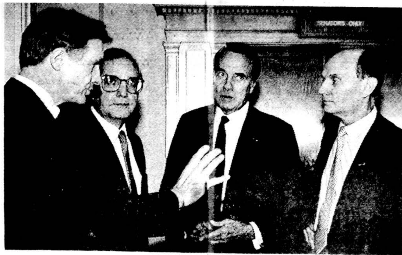
Senatoriai pasikeičia nuomonėmis prieš balsavimą, kai buvo patvirtintas prez. Busho projektas taupymo ir skolinimo bendrovių išgelbėjimui, paskiriant 166 bil. dol. Iš kairės pusės matyti Michigano sen. Donald Riegle, Maine sen. George Mitchell, Kansas sen. Bobe Dole ir Utah sen. Jake Garn.

Gi laikraščiu redaktoriai pastebėjo, jog sumažėjo gyventojų skundai spaudoje. Žmonės dabar pradėjo su savo skundais kreiptis į savo išrinktuosius delegatus.