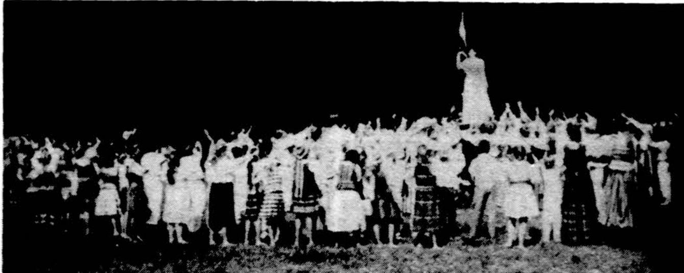
Neringos stovyklos jaunieji stovyklautojai Putnamo seselių šventėje-iškyloje liepos 23 d. pakėlė rankas i laisvės statulą vaizduojančią šaukia: „Lietuva bus laisva!“

Body Politic teatras Chicago šiaurinėje, 2261 N. Lincoln, šiomet švęs savo 20 m. sukaktį. Ta proga sezono pradžioj status britų ir airių komedija.