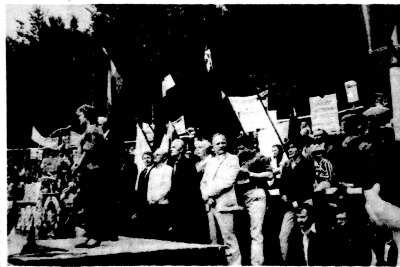
Lietuvos Nepriklausomybės sąjungos mitinge Kalnų parke birželio 11 d.

Darbo val. nuo 9 iki 7 val. vak. Šeštad. 9 v. r. iki 1 val. d.