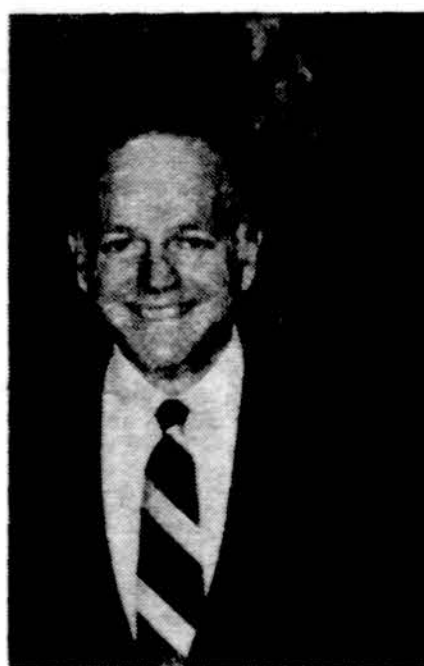
Sen. Dennis DeConcini

— Washingtone prez. Bushas išsireiškė spaudos konferencijoje jog tam tikru atveju jis panaudotų ir karinę jėgą, kad sugrąžintų pagrobtuosius namo.