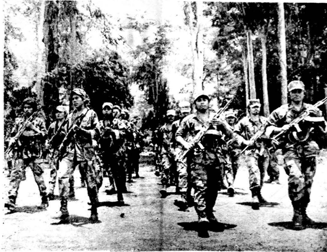
Contras kariai atlieka kasdieninius pratimus Honduro stovykloje. Daugelis jų esą pasiryžę kovoti prieš sandinistus, kai bus sugrąžinti į tėvynę.