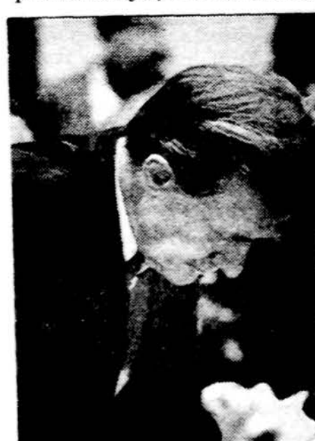
Sen. Donald W. Riegle, Jr.

JAV Kongresas neturi leisti, kad ši liūdina diena praeitų nepastebėta, dėl tos priežasties aš ir pristatau rezoliuciją, 1989 m. rugpjūčio 23 d. skelbiančią Juodojo Kaspino dieną, smerkiančią nacių-sovietų pakto jo pasirašymo 50-tųjų metų dieną. Rezoliucijoje paprasčiausiai Sovietų Sąjungą raginama sutikti su tuo, ką laisvasis pasaulis jau žino — kad Pabaltijo valstybės 1940 m. buvo neteisėtai okupuotos ir iki šiol prieš savo valią tebebudamos Sovietų Sąjungoje, kovoją už tautinį apsisprendimą, nepriklausomybę ir suverenitetą.