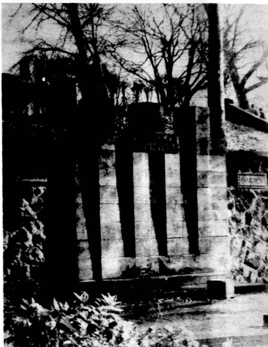
Gedimino stulpai Clevelando Lietuvių kultūriniame darželyje.