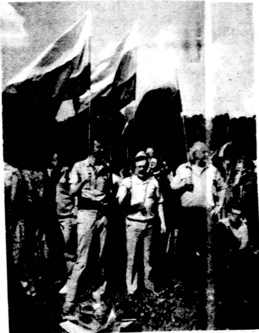
Su trispalvėmis Vilniaus Vingio parke Sąjūdžio surengtoje demonstracijoje - centre ir pats Lietuvos Persitvarkymo Sąjūdžio pirmininkas Vytautas Landsbergis.

Šis trijų užaugusių vaikų tėvas dirba Vilniaus konservatorijoje ir vadovauja Sąjūdžiui, nežūrint jo kelionių ir Maskvą dalyvauti Liaudies Kongrese. Už savo darbą, einant Sąjūdžio prezidento pareigas, jis negauna atlyginimo, o praleidžia daugiau Sąjūdžio reikalams, negu savo šeimai ar tiesiogiam darbiui. Jam tenka vadovauti savitiems Sąjūdžio posėdžiams ir at-