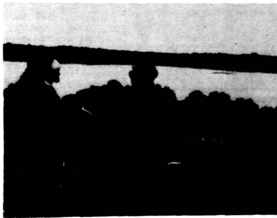
Zygeiviai ilsisi ant Toškonų-Andriūnų alkakalnio.

Specialybė — Vidaus ligų gydymas Kalbame lietuviškai 6165 S. Archer Ave. (prie Austin) Valandos pagal susitarimą Tel. 585-7755