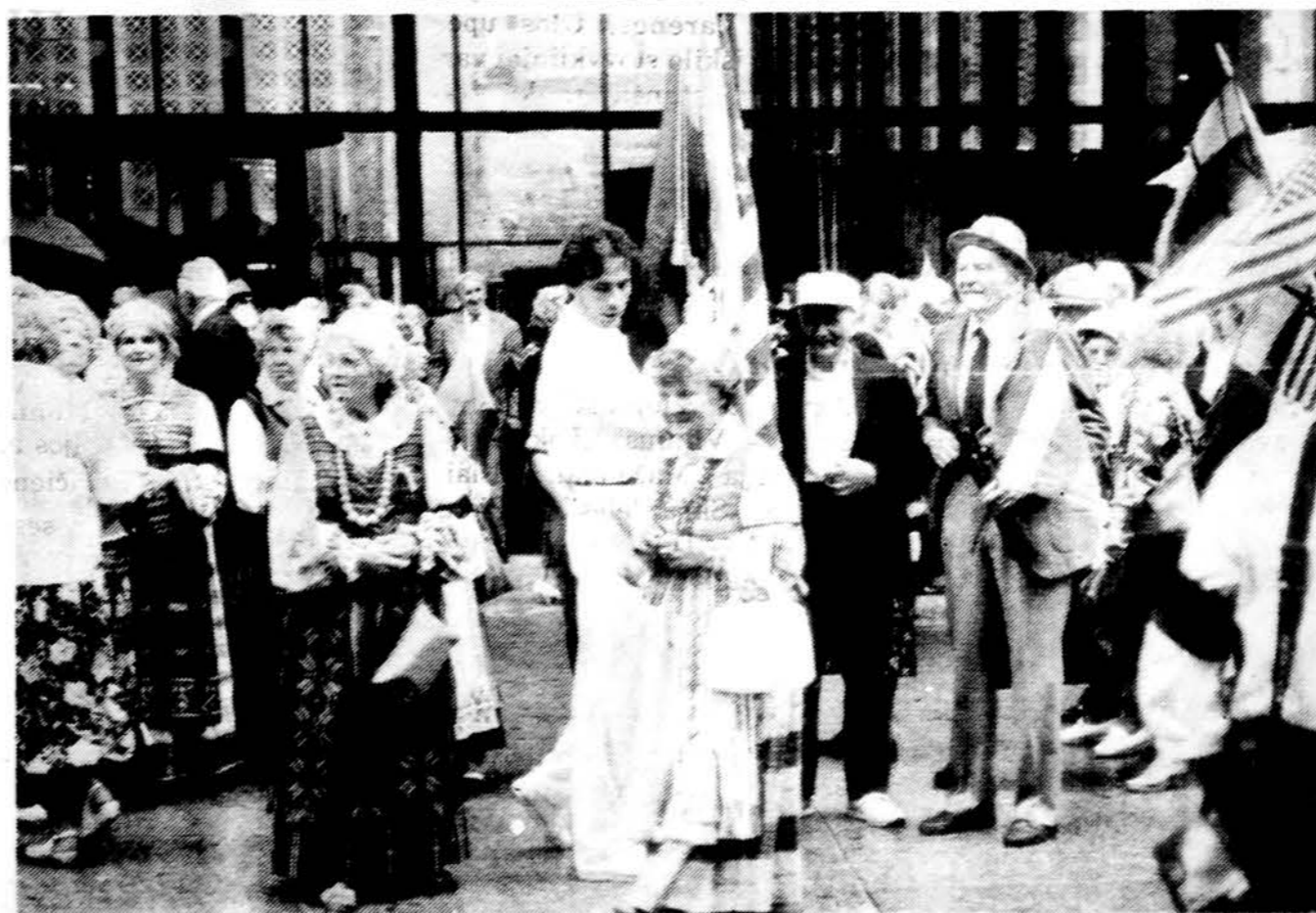
Pasirušę demonstracijai Juodojo Kaspio diena — rugpjūčio 23 d., minint Ribbentropo Molotovo gėdingą sanderį.