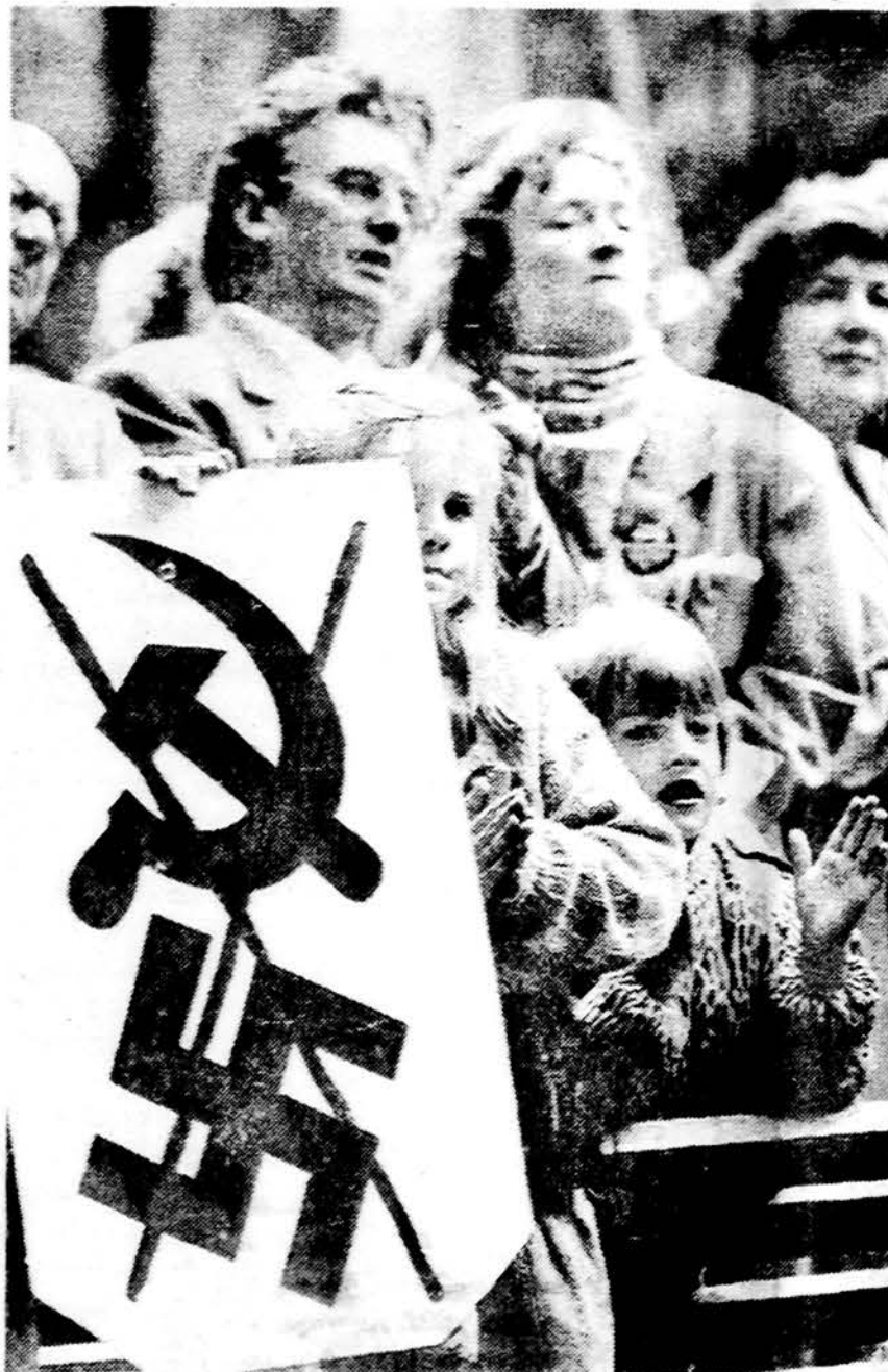
Estijoje jaunos šeimos su vaikais „Baltijos kelio“ žmonių grandinėje prisimena Hitlerio-Stalino pasirašytas sutartis leidžiant Sovietų Sąjungai okupuoti Estiją, Latviją ir Lietuvą. Protesto prieš Sovietų Sąjungą demonstracijoje dalyvavo maždaug du milijonai Baltijos respublikų žmonių.