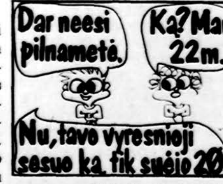
Piešė Lina Grigaitytė

Šio konkurso taisyklės yra išspausdintos „Draugo“ 134 numeryje.