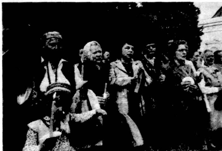
Lietuvės moterys susiėmusios rankomis ir sudarydamos gyvųjų žmonių grandinę nuo Vilniaus iki Talino su vaikais rugpjūčio 23 d. protestuoja prieš Sovietų okupaciją.

Ryga. – Latvijoje šimtai žmonių pradėjo ruošti grįžti į žemės ūkį, kai buvo paskelbtas pranešimas iš Maskvos, kad Baltijos kraštams suteikiama ekonominė autonomija, praneša Reuterio žinių agentūra. Latviai esą norėtų turėti mažesnius ūkius, kad lengviau galėtų apdirbti žemę, nes trūksta irankių ir visokių padargų. Daugiau kaip tūkstantis šeimų jau įteikė pareiškimus atgauti savo turėtai žemei arba ir prašymą naujam paskyrimui. Latvijos vyriausybė mananti, kad dešimtys tūkstančių latvių šeimų pradės atgauti Latvijos žemės ūkį.