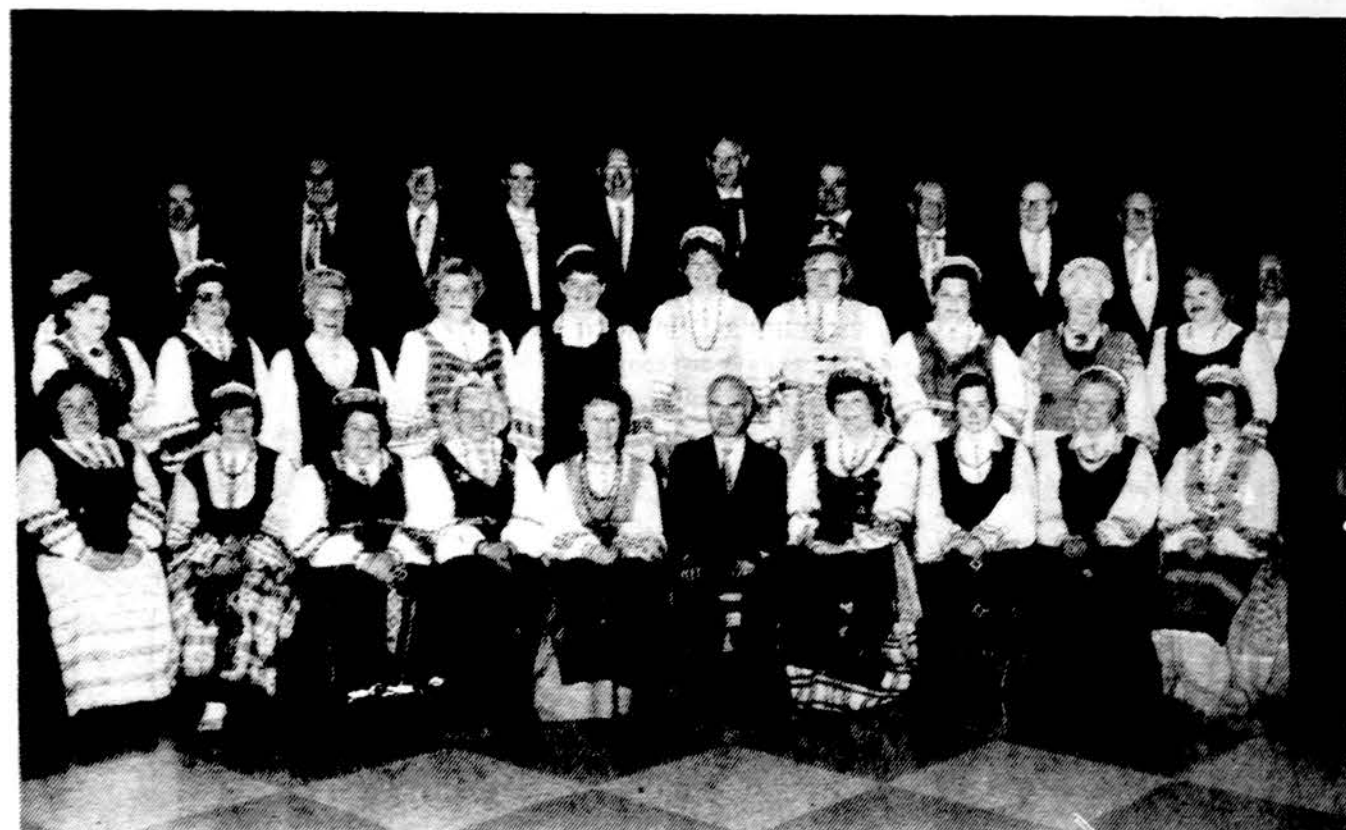
Lietuvos Vyčių choras Lietuvos Vyčių 76-jame seime Chicagoje.