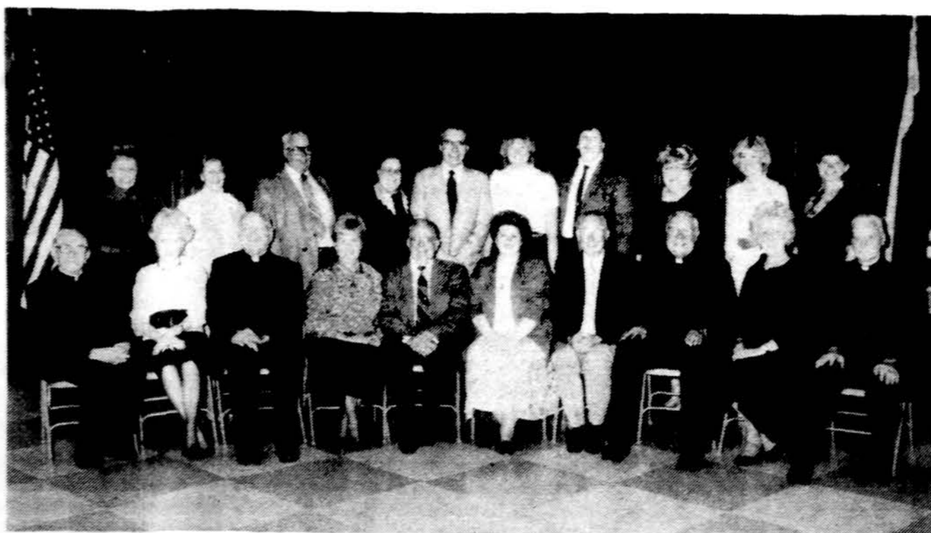
Lietuvos Vyčių seimo rengimo komitetas su svečiais

x Lietuvos kelianinkų dėmesiai . Kas nori patvirtinti ar pakeisti Aerofloto ar kitų linijų skrydžius į Lietuvą, ar gauti patarnavimus New Yorko aerodrome, skambinkite į New Yorko kelionių agentūrą „VYTIS“ 718-769-3300. (sk)