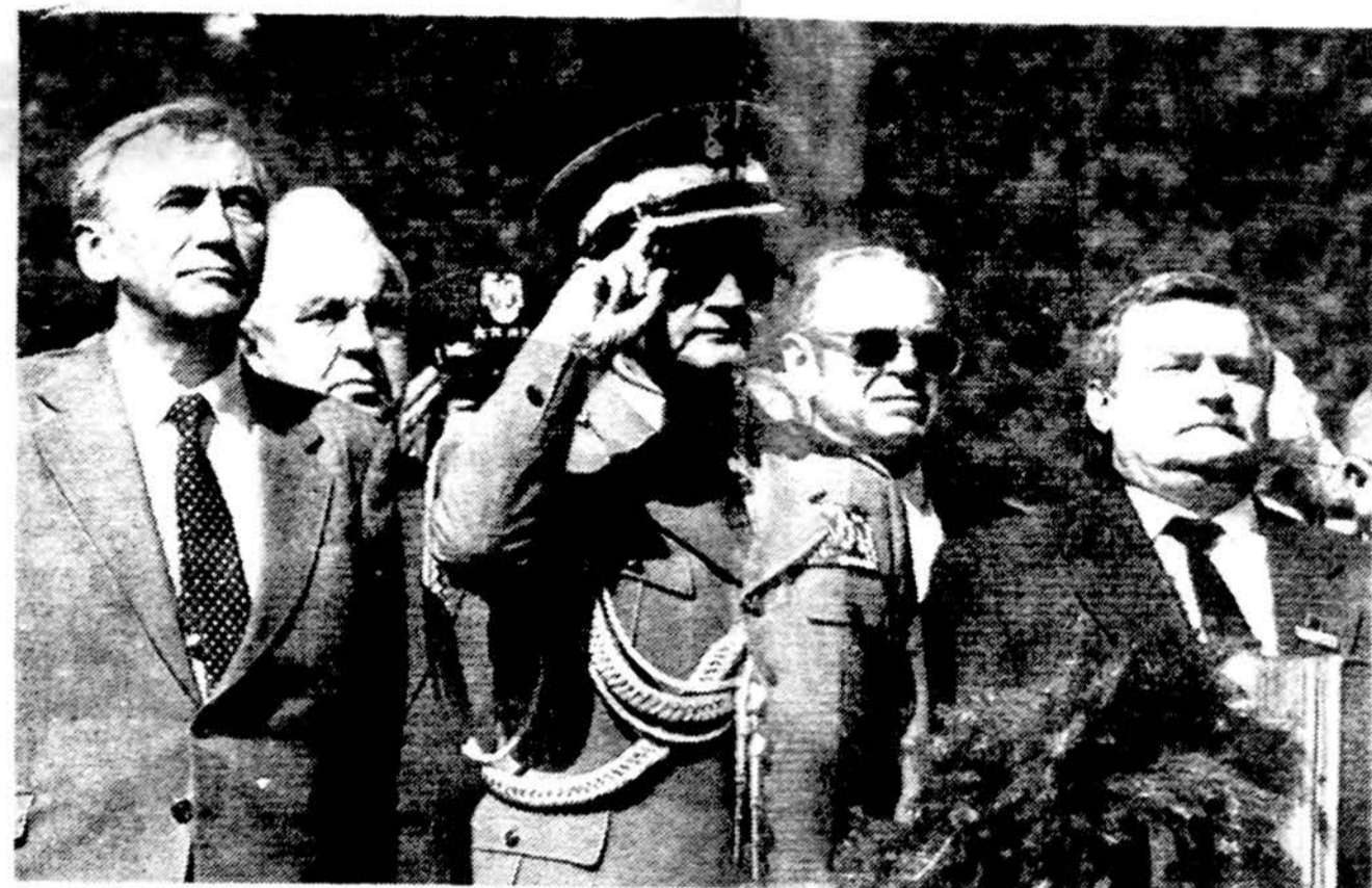
Dabartinės Lenkijos vadai — ministras pirmininkas T. Mazowieckis, kairėje, prezidentas gen. W. Jaruzelskis, cent're, ir Solidarumo vadas Lech Walesa paminint II-jo Pasaulinio karo 50 metų sukaktį Gdanske.

Kijevas. — Reuterio pranešimu, paskutiniu metu sustiprėjo ukrainiečių reikalavimai padaryti ukrainiečių kalbą respublikos kalba, todėl ir kietosios linijos komunistai sutiko pradėti pasitarimus planui, kaip įvesti ukrainiečių kalbą. Ukrainoje maždaug 30% gyvena kitų tautybių žmonių, kurių daugumą sudaro rusai. Jų pasipriešinimas didėja. Ukrainiečių kalbos įstatymo projektas pasirodė jų spaudoje praėjusią savaitę, o praėjusį penktadienį įvyko konferencija, kuri įsteigė Ukrainiečių Tautinio fronto organizaciją. Įstatymo projektas yra panašus Moldavijos ir Baltijos respublikų kalbų įstatymams, kur rusai reikalauja protestus demonstracijomis ir net streikais.