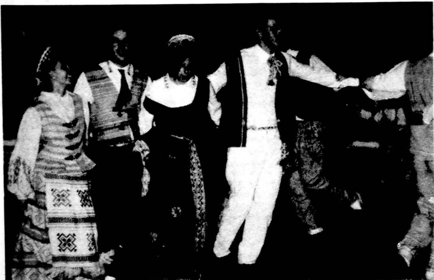
Lietuvos Vyčių ansamblio šokėjai šoka tautinius šokius seimo meninėje programoje.

Rikiojamosi procesijai į Švč. M. Marijos Gimimo bažnyčią. Organizacijos kviečiamos dalyvauti su vėliavomis