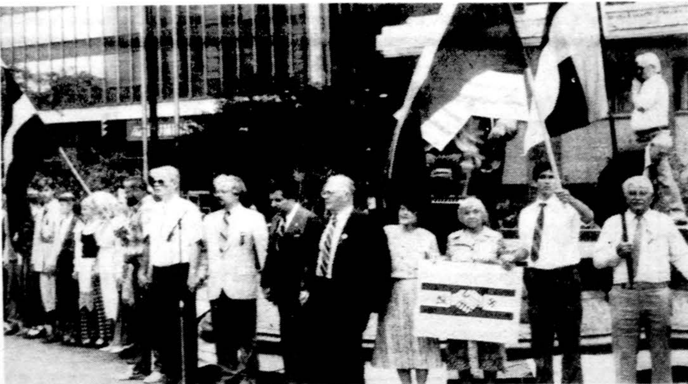
Baltiečių sujungtų rankų grandinė Juodojo kaspino dienos demonstracijoje Clevelande.

„The Cleveland Plain Dealer“ dienraštis, turis pusę milijono prenumeratorių, tai dienai paskyrė vedamąjį, pavadintą „Baltic moment of Truth“ ir pirmajame puslapyje atspausdino straipsnį „Baltics rebuke Kremlin. Lithuanian body rejects Soviet rule“, o kitą dieną aprašė pabaltiečių demonstraciją miesto centre. TV 5-sis kanalas vakare parodė keletą akimirklų iš šio pabaltiečių susi-