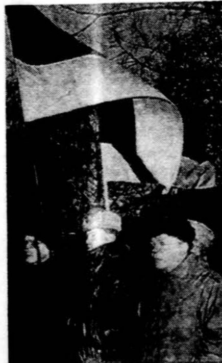
Ir Estijos Taline

„Kai kur atsirado reali tikro pilietinio konflikto, masinių susirėmimų gatvėse su sunkiais padariniais grėsmė“ — toliau skaitome šiame dokumente. Nė vienoje Pabaltijo respublikoje nėra ir nebuvo tokių susirėmimų, tokių konfliktų. Tačiau susidaro įspūdis, kad pareiškimo autoriai norėtų kažkam padiktuoti sprendimus iš jėgos pozicijos, sukurtyti juos veiksmams, gerbiaiariant, išprovokuoti tą patį konfliktą, kurio nėra, ir vietoj politinio dialogo bei pluralizmo griebtis labiau įprastų malšinimo ginklų priemonių. Tuo įtikina ir šios eilutės: „Nueita toli. Pabaltijos tautų likimui gresia