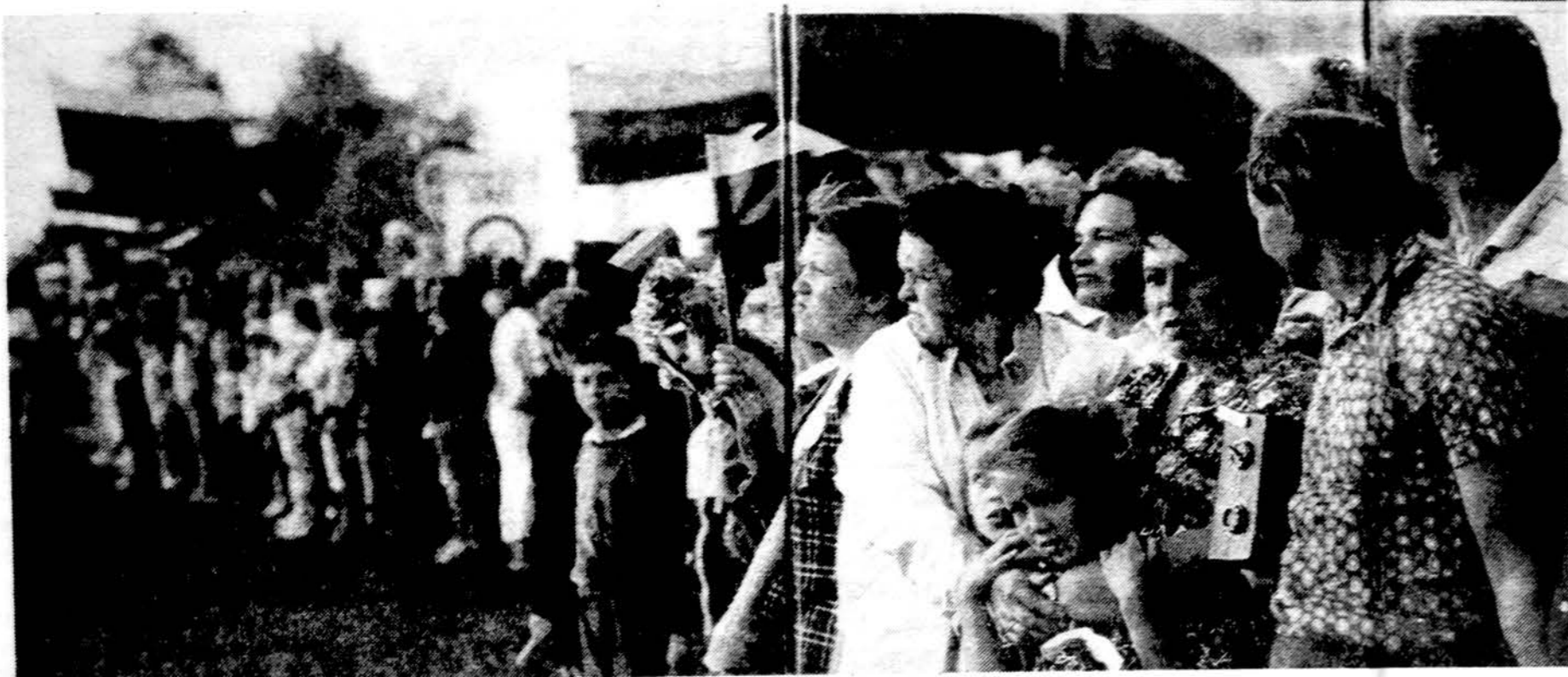
Šimtai Vakarų žurnalistų iš daugelio pasaulio valstybių, dalyvavę Vilniuje, Rygoje ir Taline, rašė pasauliui, kad milijonai žmonių buvo savo ramkomis ir širdimis susijungę rugpjūčio 23 dieną už Lietuvos, Latvijos

ir Estijos kraštų nepriklausomybes. Tai unikali, nematyta ir negirdėta laisvės manifestacija — rankų grandinė, atsuktai veidais ir Vakarų — trijų Baltijos valstybių bendras kelias.