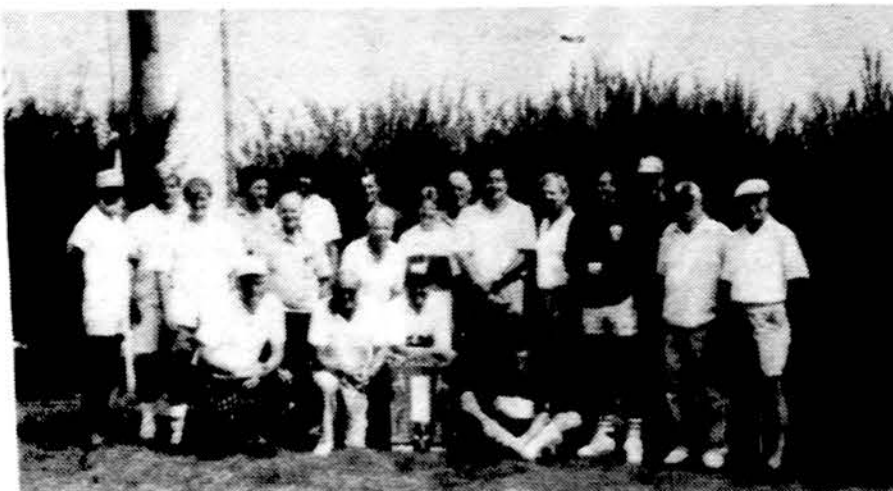
Detroito ir Clevelando lietuviai golfininkai, tarp miestinių varžybų dalyviai.