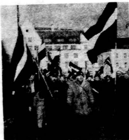
Ir Latvijos Rygoje

Prieš penkiasdešimt metų slapta Vokietijos ir TSRS suokalbis buvo priežastis aneksuoti tris nepriklausomas šalis, su kuriomis Tarybų Sąjunga siejo taikos sutartis. Pažeidžiant tada galiojusius tų valstybių įstatymus, įvedus iš užsienio karinę jėgą, buvo panaikintas nepriklausomas šių šalių valstybingumas. Daugelis oficialių istorikų ir šiandien aiškina, kad Pabaltijo šalis buvo aneksuotos