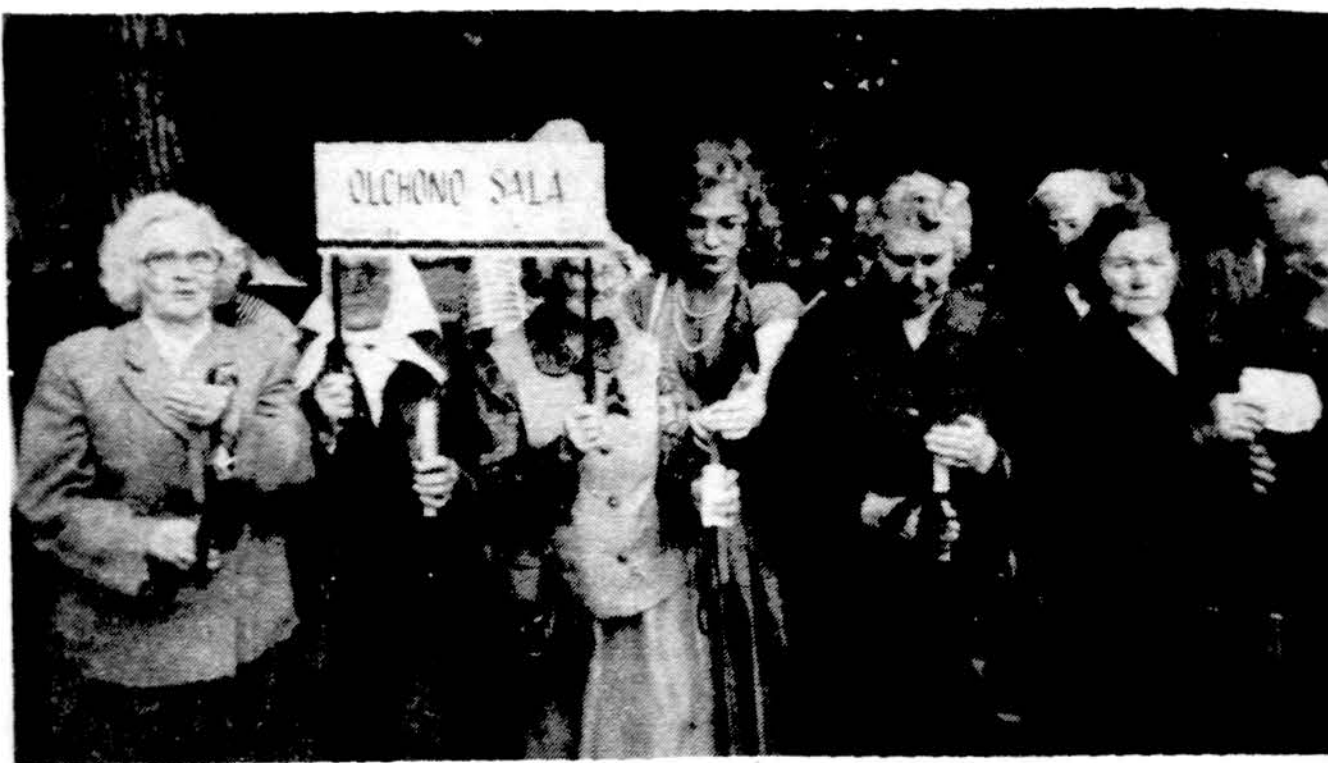
Tremtiniai Vilniuje su savo tremties vieta – „Olchono sala“ demonstracijoje.