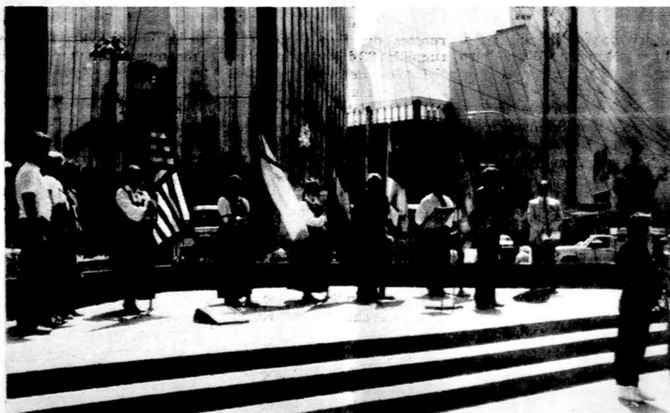
Rochestery, N.Y., Juodojo Kaspino demonstracija rugpjūčio 23 d.

Chicagoje labai padidėjo pacientų greitosios pagalbos padalinys, atvežamų čia dėl sunkių susirgimų dėl alkoholio ar narkotikų. Tokių ligonių į Chicagos ligoninių greitosios pagalbos padalinis 1988 m. buvo atvežta 3,913.