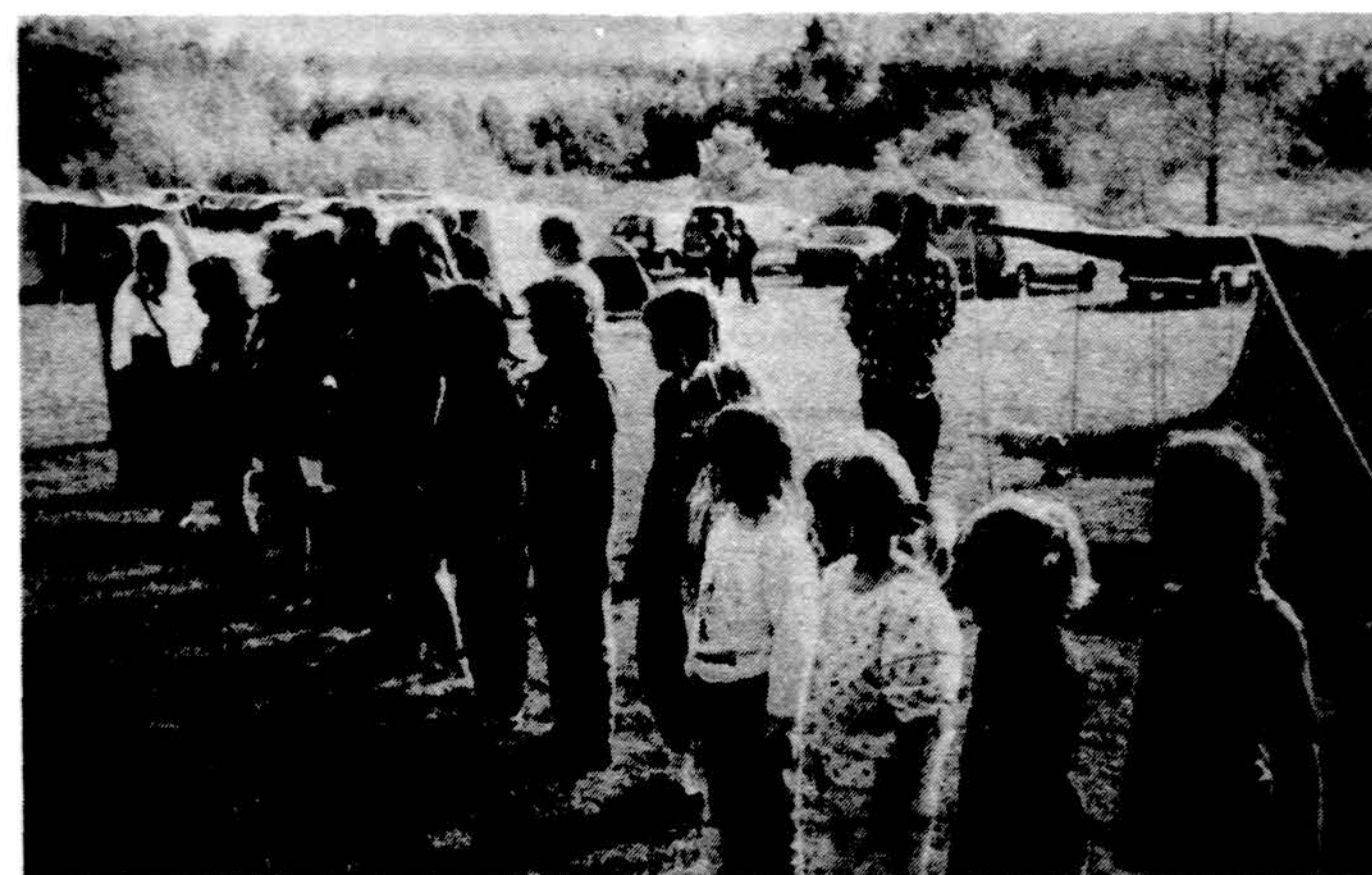
Detroito skautai rikiuojasi „Pilėnų“ stovykloje.

VYČIŲ SUVAŽIAVIMAS Lietuvos Vyčių Vidurio centro apygardos suvažiavimas vyks rugsėjo 22-24 d. Du Bois, Pa. Posaėdžia vyks Sv. Juozapo bažnyčios salėje. Du Bois vyčių 86 kuopa rengia seimą ir mirusių vyčių ypatingą prisiminimą specialiomis pamaldomis kapinėse. Siame seime dalyvaus delegatai ir svečiai iš Cleveland, Oh., Dayton, Oh., Detroit, MI, Saginaw, MI, Southfield, MI, ir Pittsburgh, PA. Penktdienį , rugsėjo 22 d., 8 val. vak. Best Western Motel vestibulyje vyks delegatų registracija ir svečių susipažinimas bei užkandžiai. Dauguma vyčių čia ir nakvos. Šeštadienį , rugsėjo 23 d., 9 val. ryto Sv. Juozapo bažnyčios salėje vyks Vidurio centro apygardos delegatų registracija ir susirinkimas. 9:30-12 val. ryto bus religinis seminaras. 1:00 val. p.p. delegatai rinksis seiminiam susirinkimui. Tarp svarbesnių šiuolaikinių klausimų, bus svarstomi jaunimo reikalai ir tėvynės Lietuvos laisvės raida demokratėjimo keliu... Kiek Lietuva patyrė rusų žadėtos laisvės? 7:00 v.v. parapijos salėje vyčiai ir svečiai gėrės pietumis ir šokiais. Sekmdienį , rugsėjo 24 d., 10:00 val. ryto Sv. Juozapo bažnyčioje bus pamaldos. 11:15 val. ryto Sv. Juozapo kapinėse bus specialios pamaldos mirusių vyčių prisiminimui. Reikia pažymėti, kad kapinės išpuodingai įrengtos ir šventovė. 12:15 val. p.p. Lietuvių klubo valgykloje bus specialūs pietūs. Vincas Gražulis