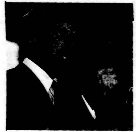
JAV viceprezidentas Dan Quayle

Paklaustas, ar Washingtonas reaguotų, jei Sovietų Sąjunga atsiskaitų suteikti nepriklausomybę Baltijos valstybėms, atsakė, kad taip galėtų būti, kiekvienas įvykis sulaukias atsakymo „ir jei būtų neigiamas dalykas Baltijos valstybėms, aš manau, kad būtų Amerikos neigiamas atsakymas“. Sovietų Sąjunga paskutiniu metu yra tautinių pasireiškimų Baltijos valstybėse ir Azerbaidžane sujudinta. Praėjusį šeštadienį naujas masinis ukrainiečių mitingas ragino pašalinti ir teisti Ukrainos respublikos veteraną Komunistų partijos vadą.