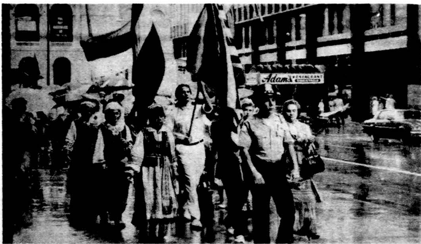
Demonstruoja Chicago miesto centre rugpjūčio 23 d., gėdingos Molotovo-Ribbentropo sutarties 50-tosė metinėse.