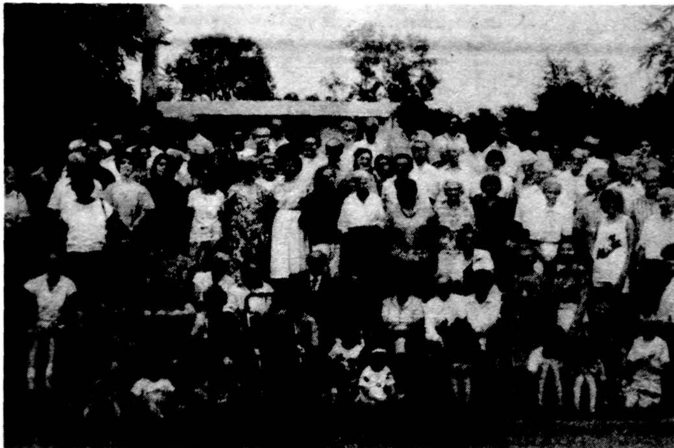
Mokytųjų, jaunimo ir šeimų studijų savaitės dalyviai rugpjūčio 7-13 d. Dainavoje.