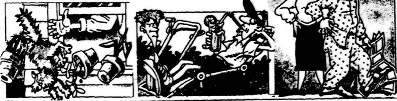
Vengdamas dabar siaučiančios šienligės (hay fever) elkis taip: 1. Mes lauk iš kambario augalus ir gyvuliukus. 2. Neįpauk žolės. 3. Klausyk žmonos: iš miegamojo pašalink knygas ir kitokius dulkių prilaikytojus.