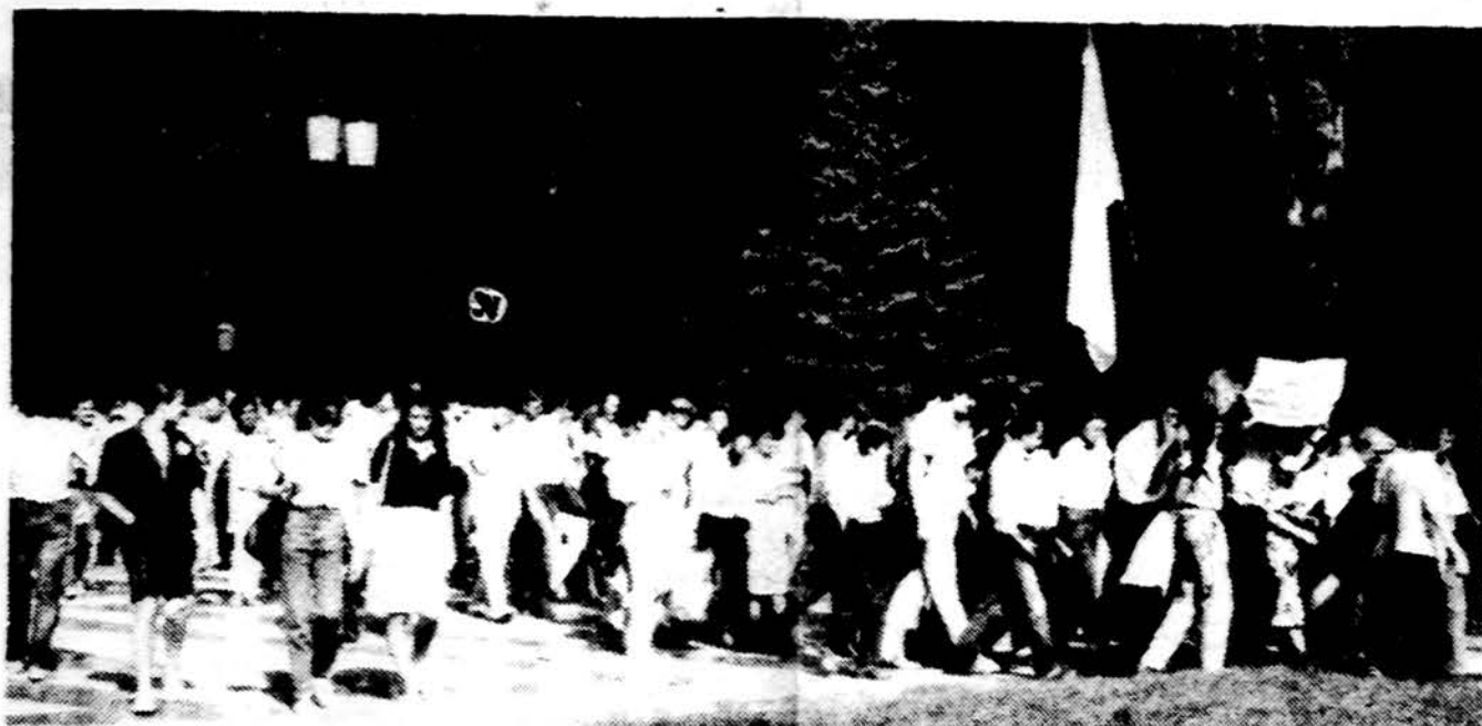
Kijeve ukrainiečiai sekmdienį žygiuoja prie Aukščiausio Sovieto pastato pareikšti protesto prieš rusų dominavimą respublikoje. Jie reikalavo pilnos autonomijos Ukrainai ir ukrainiečių kalbos įteisino, o taip pat reikalavo įstatymo, kad būtų leista vartoti tautinius ukrainiečių simbolius.

— Alytuje, kur anksčiau stovėjo Laisvės paminklas, kuris stalinistų buvo nugriautas, buvo toje vietoje palaidoti tarybiniai kariai. Dauguma alytiškių pageidauja karių palaikus iš Dariaus ir Girėno gatvės miesto centre perkelti į centrinės kapines, o toje vietoje atstatyti Laisvės paminklą. Nežinantys praeities, stebisi, kodėl grupė karių palaidota atskirai.