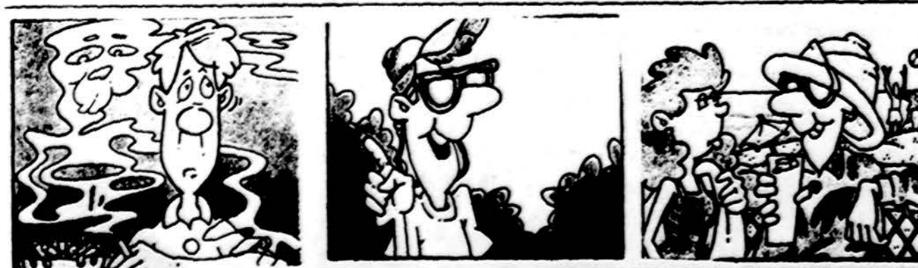
Saugodamasis nuo vėžio elkis šitaip: 1. nerūkyk, 2. stikliuko atsisakyk ir 3. būdamas gryname ore, sauleje nesikaitink.