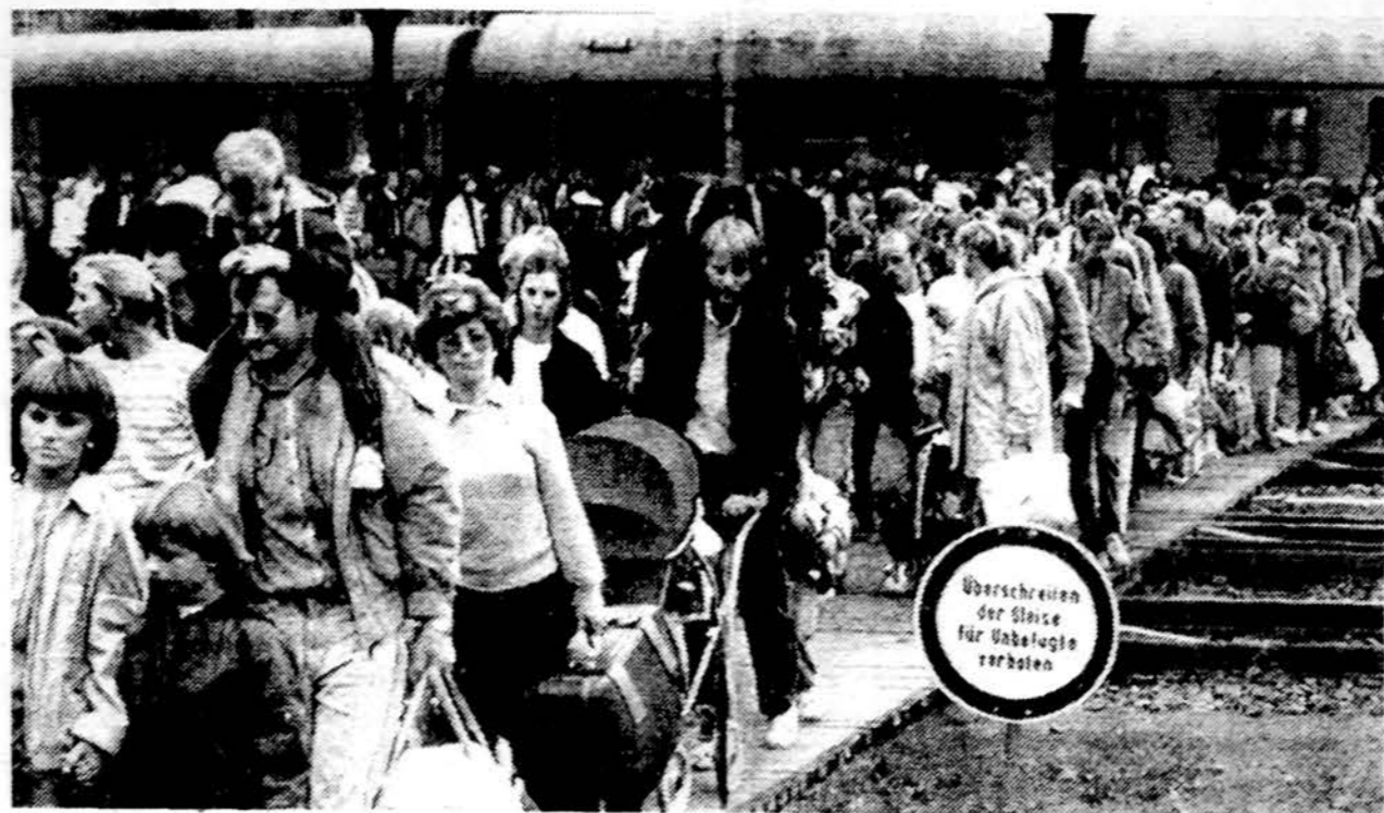
Rytų Vokietijos pabėgėliai, kurie buvo prisiglaudę Vak. Vokietijos ambasadoje Prahoje, atvyko į Gissena, kai šios traukiniai per Rytų Vokietiją atvežė į laisvę. Išlipę iš kiekvieno traukinio jų kalbėtojai pareiškė, kad šis jų egzodas yra protestas prieš Sovietų okupaciją Rytų Vokietijoje.

Mus sieja ne tik ekonomika ir geografija — mus sieja bendras istorinis sielvartas ir bendras siekis padaryti pasaulį, o ypač