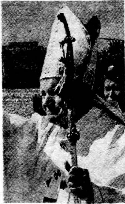
Popiežius Jonas Paulius II sekmadienį meldėsi už abiejų Korėjų susivienijimą.

Popiežius jau anksčiau ne kartą yra minėjęs, kad norėtų aplankyti Sovietų Sąjungą, ir kai žurnalistas lėktuve jo paklausė, ar kelias į Maskvą atviras, popiežius atsakė: „Taip, aš manau, kad situacija palankesnė“, bet pridėjo: „aš negaliu būti pranašas, pamatysime“. Didžioji kliūtis dar nepašalinta — tai Ukrainos Katalikų Bažnyčios legalizavimas. Popiežius yra pareiškęs, kad vyks į Sovietų Sąjungą tik tada, kada galės aplankyti ten katalikus bei kur.