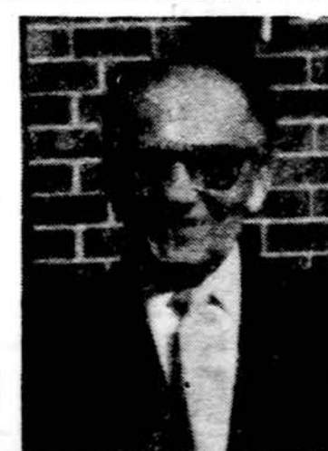
„Aš priglaudžiau prie žemės širdi Ir ji tėvynės balsą girdi Ir amžinybėje žvalgaus Tėvynės Lietuvos dangaus“. B. Brazdžionis