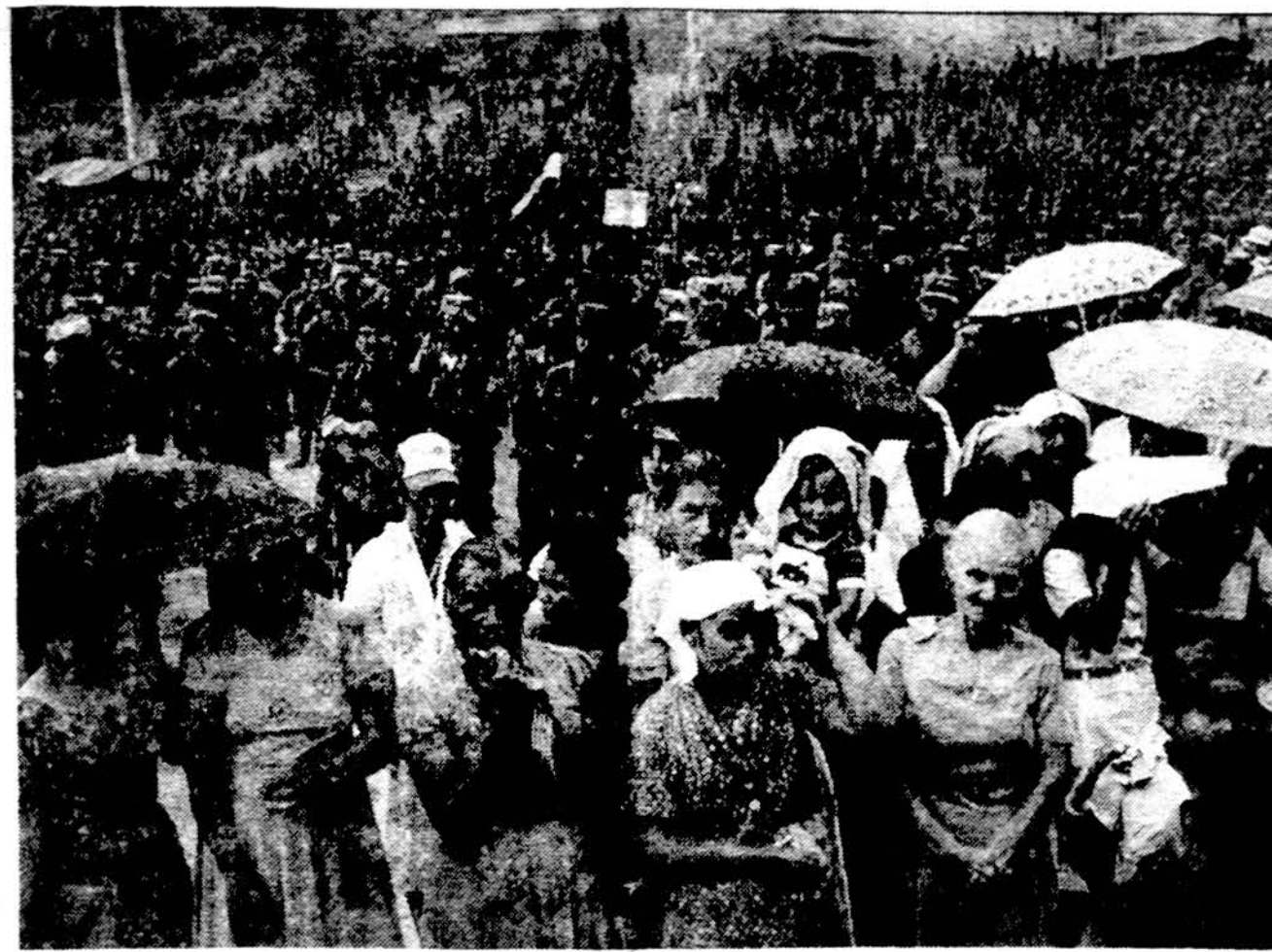
Nikaragvos laisvės kovotojai Contras ir jų šeimos Hondure klausosi tarptautinės komisijos narių raginimo sugrįžti į Nikaragvą, išjungti į kasdieninį gyvenimą ir sutikti su pasiūlymu daugiau nebekariauti prieš sandinistų marksistinę vyriausybę.