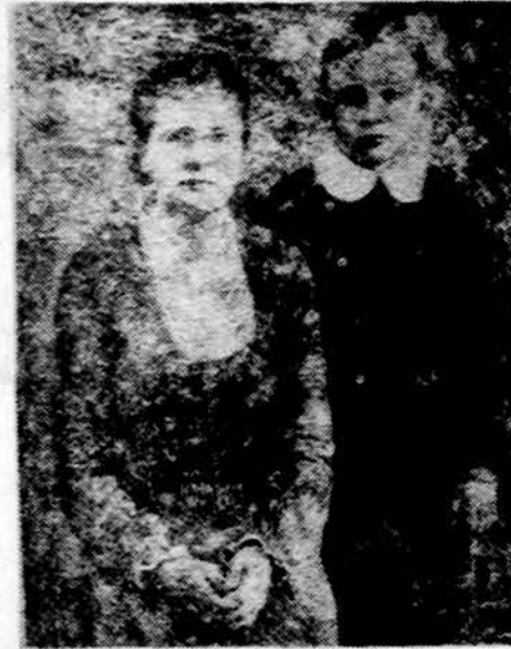
Motina ir sūnus Negalestinga mirtis 1975 m. spalio 18 d. nutrukaė Dantų Gydytojos