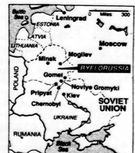
Pietų vėjai neša Černobylio radiaciją į Gudiją.

Černobylys. Praėjo trys su puse metų, kai įvyko didžioji branduolinė nelaimė šioje vietoje. Tada buvo daug evakuota gyventojų, nes susidarė didelis pavojus gyvybei ir žmonių sveikatai. Dabar vėl buvo pranešta tūkstančiams šeimų, kad jų sveikatai yra pavojus ir bus vėl vykdomas jų išskeldinimas iš tų aplinkinių kaimelių. Tūkstančiai žmonių serga nepagydomomis ligomis. Dar 37 kaimeliai bus evakuoti. Žmonės ten negali valgyti savo užsiaugintų daržovių, nes jos yra nuodingos. Žuvę esančios pilnos upės, bet jų negalima valgyti — visos yra užkrėtos. Valdžia turi uždaryti esančius kaimus aplink Gomelį ir Mogiljevą. Sovietų vyriausybei vėl kainuos evakuacija kelis bilijonus rublių.