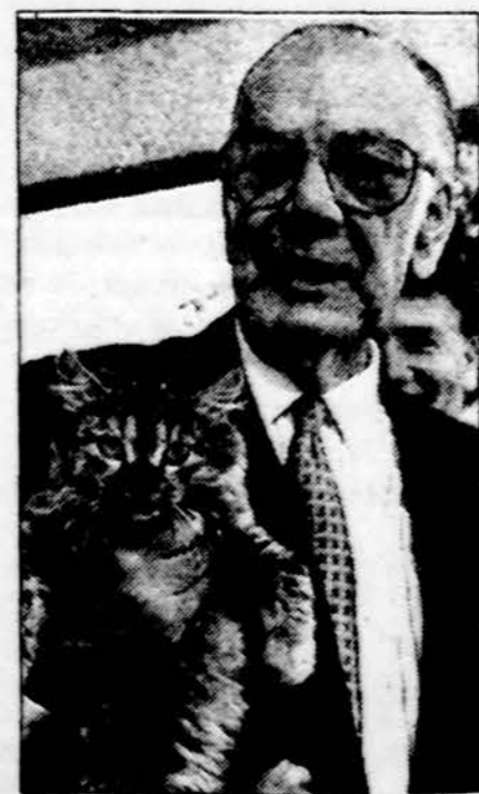
Camilo Jose Cela, ispanų rašytojas, Nobelio literatūros premijos laureatas.

Stockholmas. Ispanijos rašytojas Camilo Jose Cela laimėjo šių metų Nobelio literatūros premiją. Švedijos Mokslų akademija praneša, kad jam premija skiriama už „turtinę ir stiprią prozą“. Jo romanas „Paskvalio Duartes šeima“, atspausdintas 1942 m., buvo populiariausias Ispanijoje po Cerneteso „Don Kichoto“. Tačiau pats geriausias laikomas „Avi-