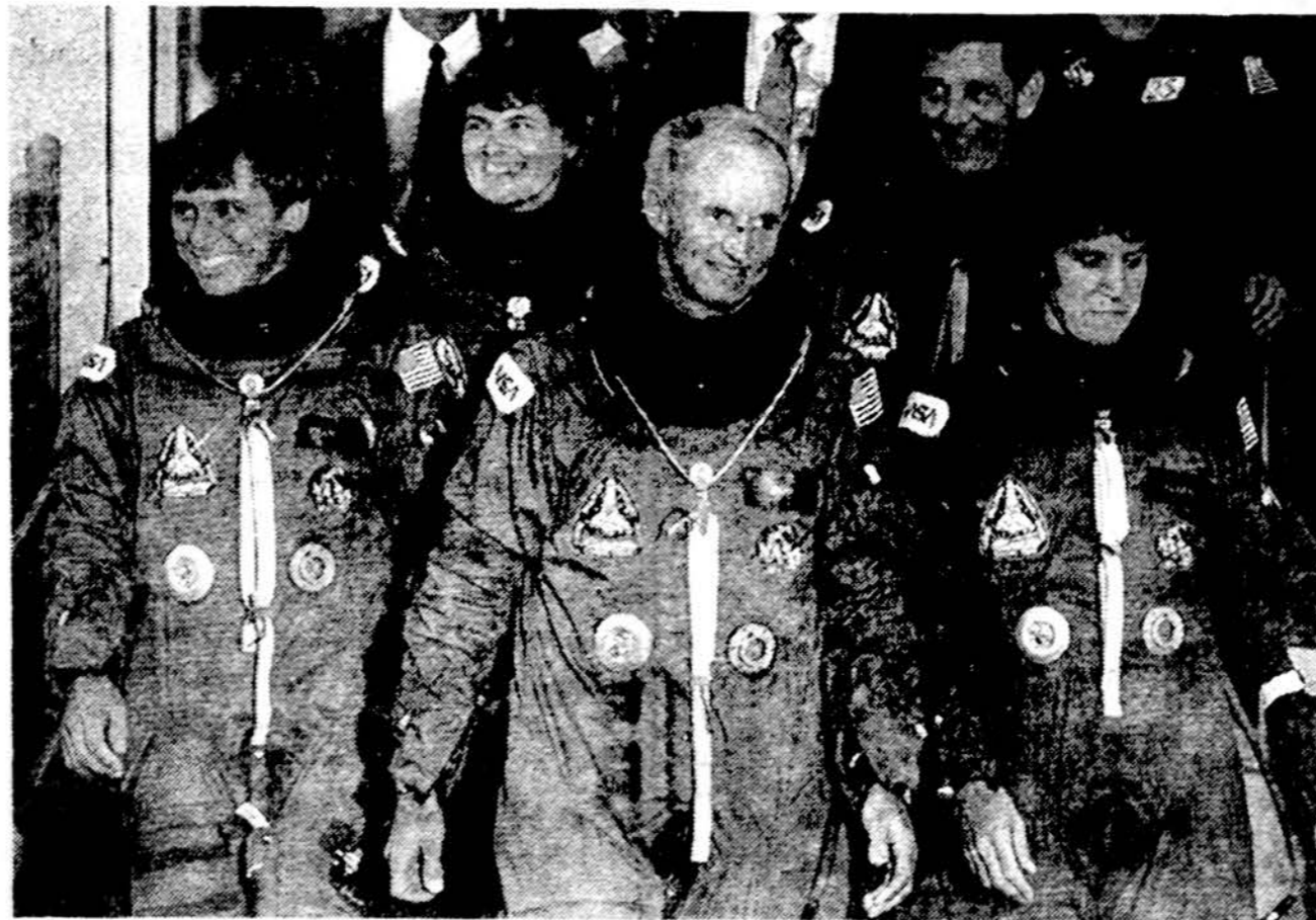
Atlantis erdvėlaivio igula. Misijos astronautai iš kairės į dešinę: dr. Franklin Chang-Diaz, fizikas, dr. Shannon Lucid, biochemikė, misijos vadovas, kapitonas Donald Williams, misijos pilotas Michael J. McCulley, laivyno karininkas, ir dr. Ellen S. Baker, gydytoja.

— Lenkija įsivedė maisto kortelės, kad galėtų kovoti su infliacija, kuri Lenkijoje yra 1,000%.