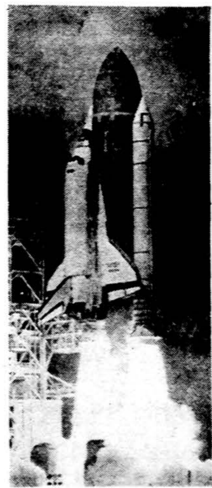
Atlantis skrieja į erdves.

Saulė teka 7:08, leidžiasi 6:02. Temperatūra šeštadienį 47 l., sekmadienį 54 l., pirmadienį 61 l., antradienį 60 l.