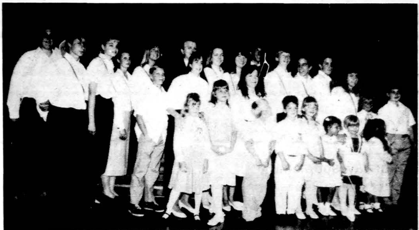
Los Angeles jauniečiai ir moksleiviai ateitininkai Šeimos šventėje.

Balfui dėkingi ne tik stovyklose gyvenusieji, bet ir sveikatas išlaikysieji, ir Sibire išlikusieji gyvi lietuviai.