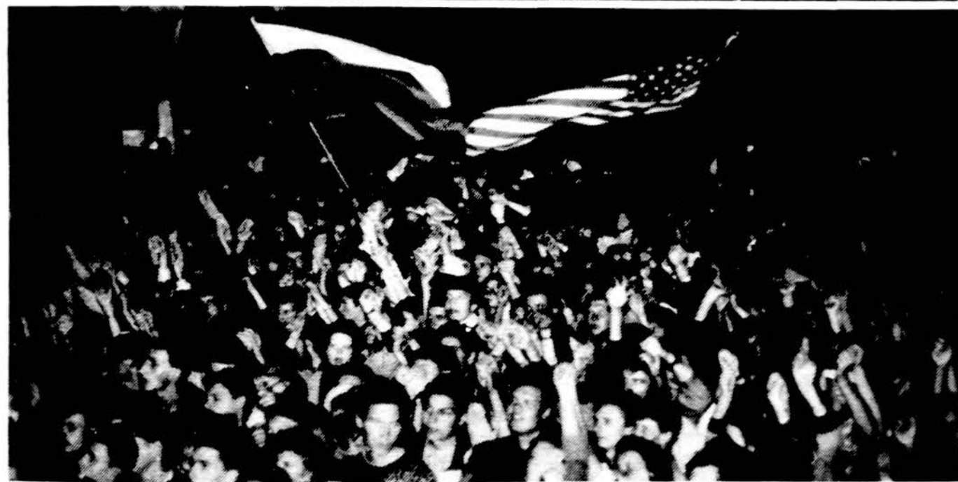
Roko maršo dalyvių minia išgyveno Amerikos ir Lietuvos kultūrų jungtį, ieškant naujų muzikines išraiškos formų.