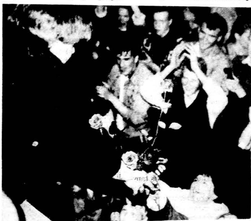
Per Roko maršą rožės išsako, ko muzika ir žodžiai negali.

Prisiminimai įvairūs – tai jaudinantys, tai juokingi, tai malonūs... Išeiviai su ašaromis akyse klausėsi „Foje“ grupės