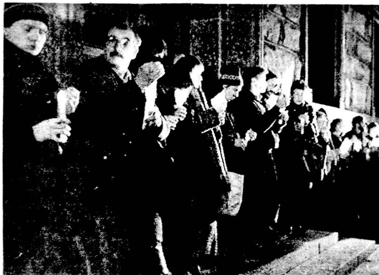
Maždaug 2,000 Ma. kvos gyventojų apsupo Liubiankos kalėjimą, KGB centrinę įstaigą, tylos proteste laikydami žvakes ir meldamiesi už Stalino nužudytuosius, kol policija nepradėjo juos mušti. Šis pastatas dešimtmečiais buvo laikomas baisiausia vieta Sovietų sistemoje.

Ukrainos Donetskio anglių regione, didžiausiame visoje sąjungoje, vėl darbininkų komitetai pakartojo savo anksčiau iškeltus reikalavimus, kurių vyriausybė neišpildė. Jei Kremlius nesugebės darbininkų prašymų patenkinti, tai streikas bus pradėtas bet kada ir tai vėl suparalizuos anglių produkciją, kaip kad buvo šią vasarą. Darbininkų streikų komitetai tebeveikia.