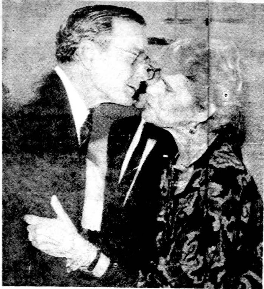
Prezidentas George Bushas sveikiasi su Violetta Chamorro, Nikaragvos opozicijos prezidentine kandidatė San Jose mieste, Costa Ricoje, kur Bushas dalyvavo suvažiavusių įvairių valstybių prezidentų pasitarime. Amerika remia jos kandidatūrą į Nikaragvos prezidento postą.

Valstybės departamento sekretorius J. Bakeris III dar prieš Busho kalbą Washingtone pasakė, jog Ortigos ginklų paliaubų nutraukimas gali būti preliudas į rinkimų panaikinimą Nikaragvoje. Valstybės departamentas dabar paskelbė, jog sandinistai, kai buvo pradėtos ginklų paliaubos, „puolė rezistencijos karių su dideliu agresyvumu“. Mažiausiai buvo užmušta 105 contrų kariai. Washingtone antradienį Senatą 95 balsais (niekas nebalsavo prieš) priėmė rezoliuciją, smerkiančią Ortega už grasinimą nutraukti paliaubas. Antradienį dar nebuvo pranešta, kad sandinistai nutraukė ginklų paliaubas ir pradeda contrų puolimus.