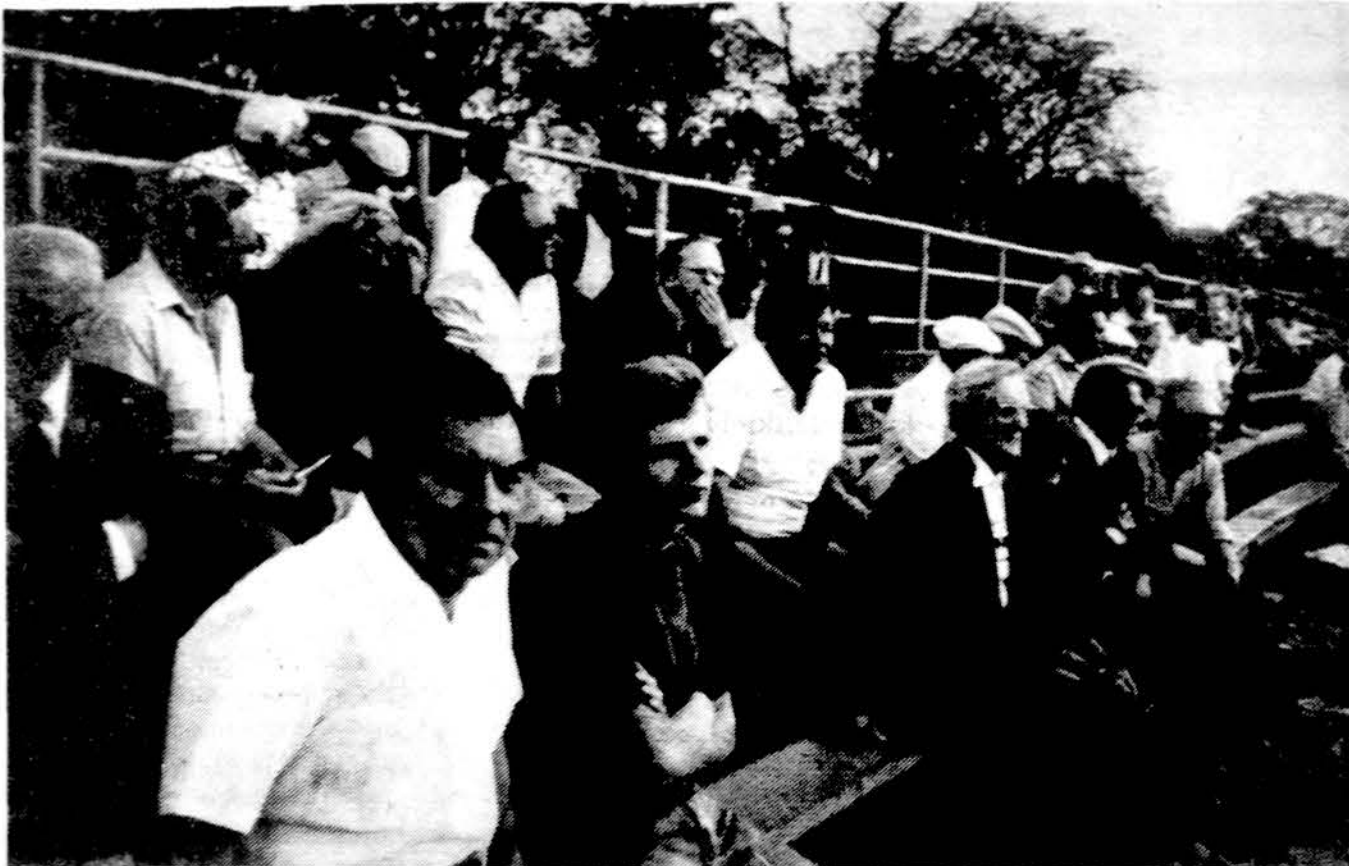
Kad rungtynės įtemptos, matosi iš „Lituanicos“ futbolo komandos gerbėjų veidų.