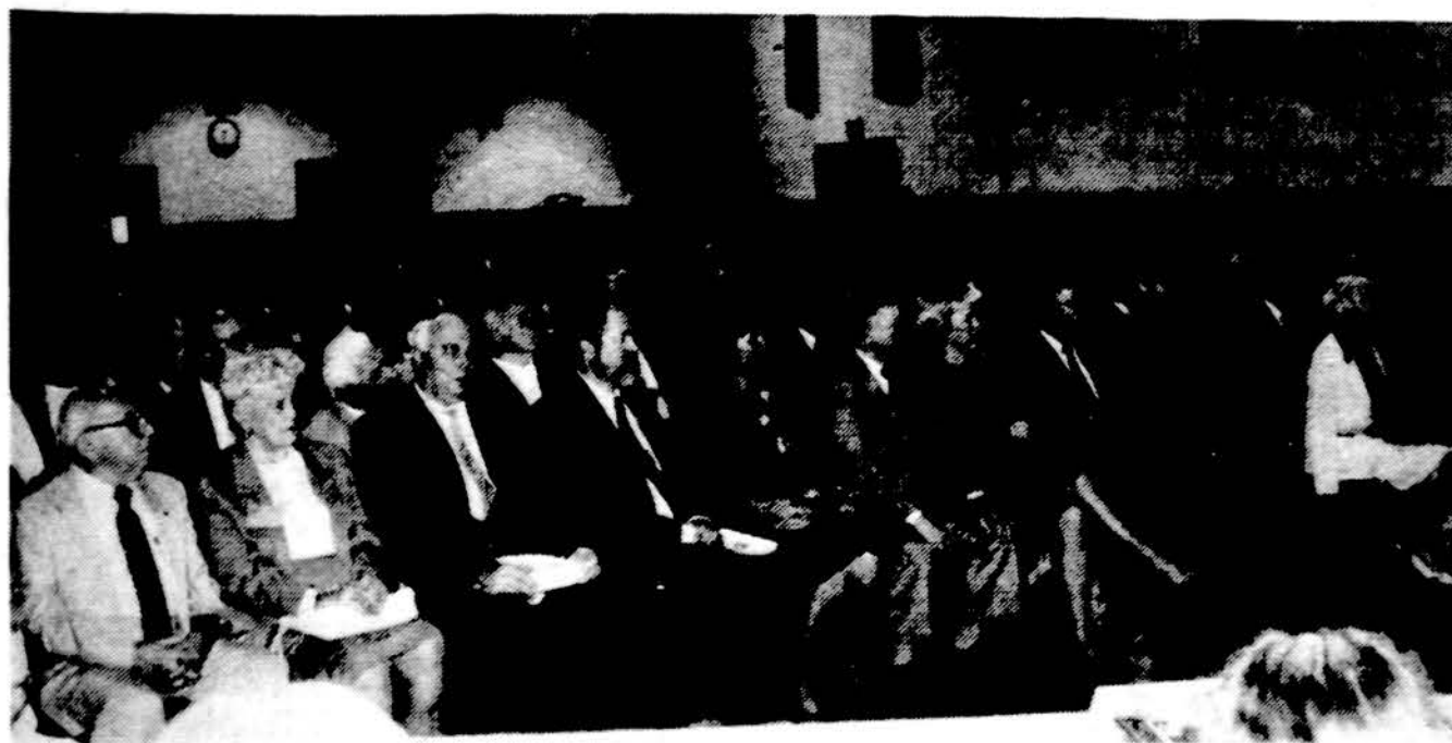
Dalis atstovų ir svečių Lietuvių kongrese Los Angeles.